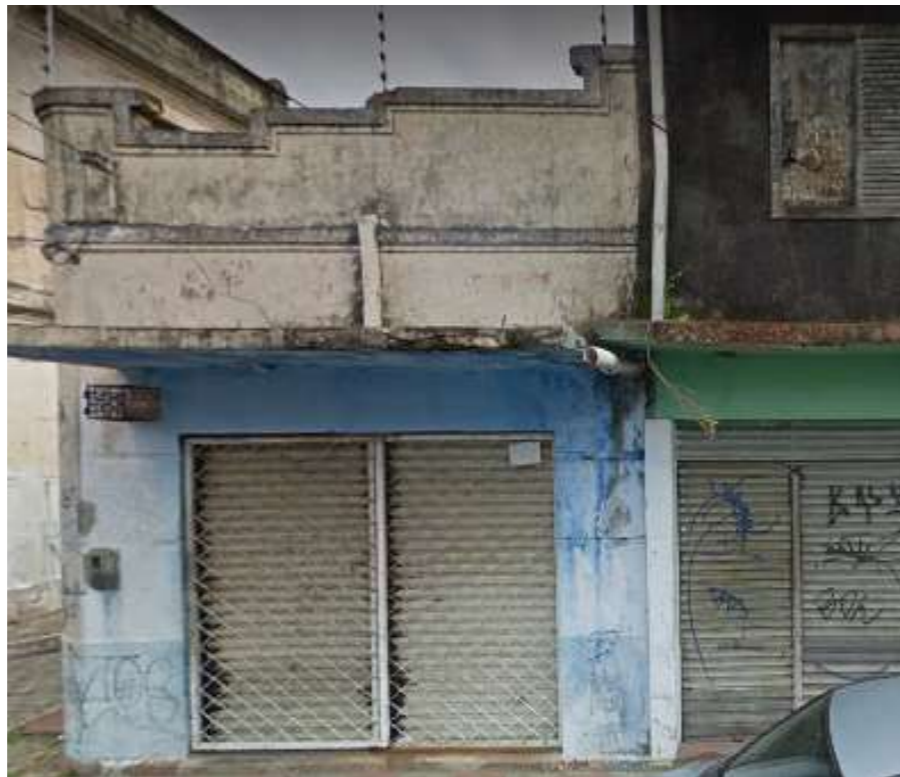
IMAGEM FRONTAL EDIFICAÇÃO RDB-166 (AGO. DE 2019)