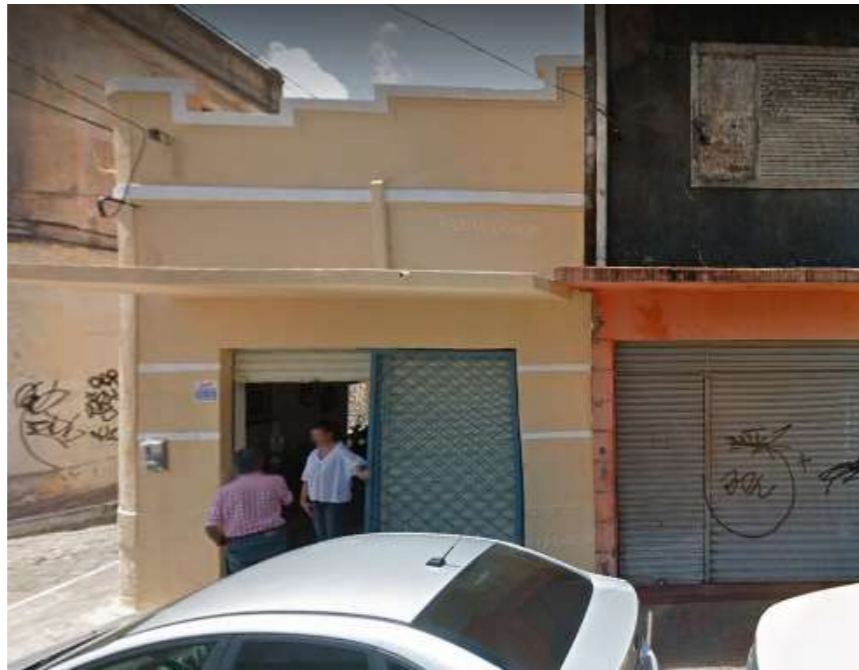
IMAGEM FRONTAL EDIFICAÇÃO RDB-166 (NOV. DE 2011)