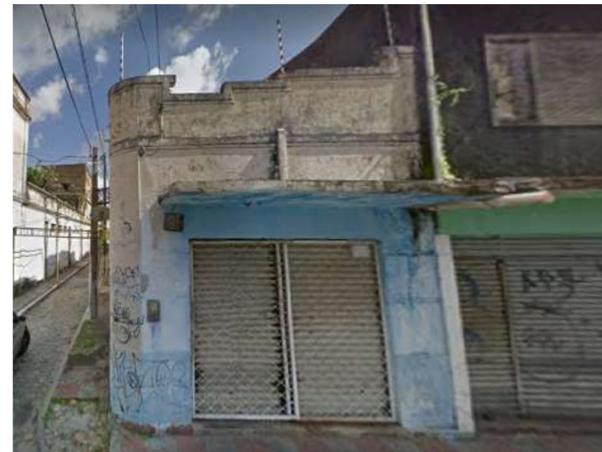
IMAGEM FRONTAL EDIFICAÇÃO RDB-166 (DEZ. DE 2014)