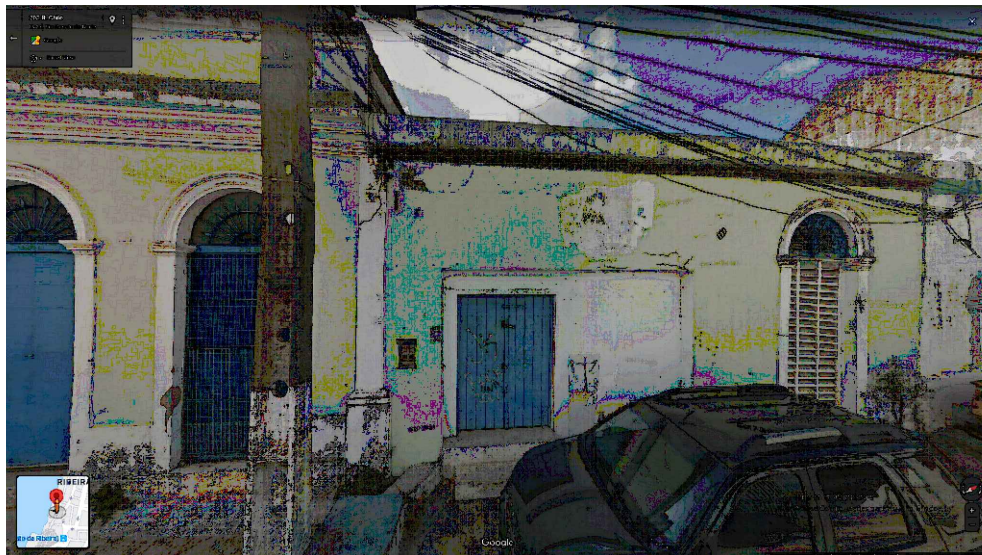
IMAGEM FRONTAL EDIFICAÇÃO RC-188 (JUN. DE 2016)