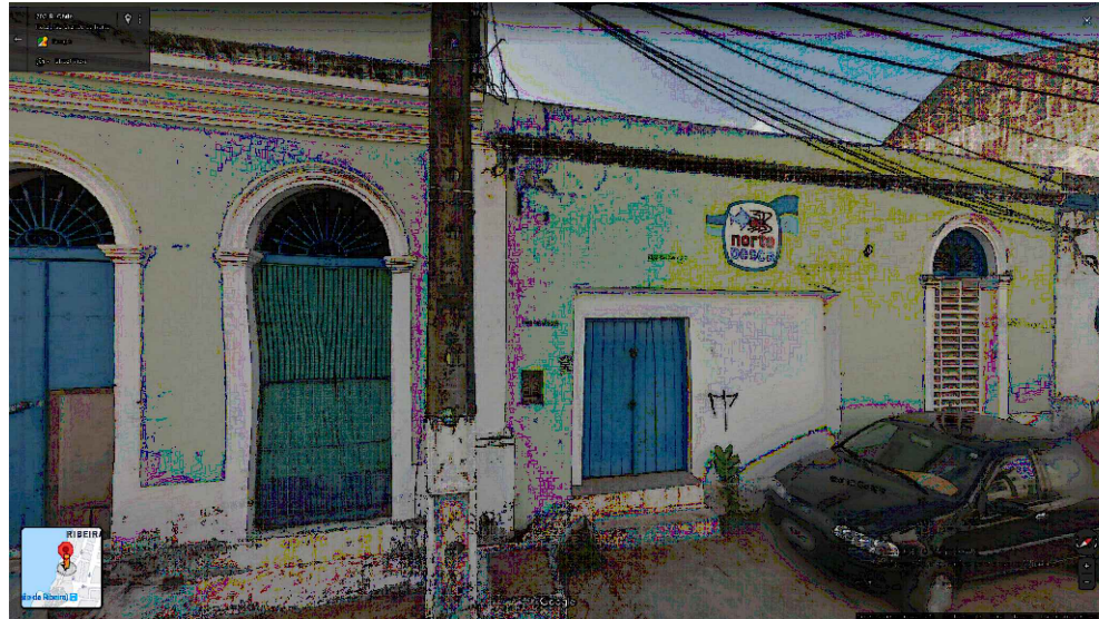
IMAGEM FRONTAL EDIFICAÇÃO RC-188 (NOV. DE 2011)