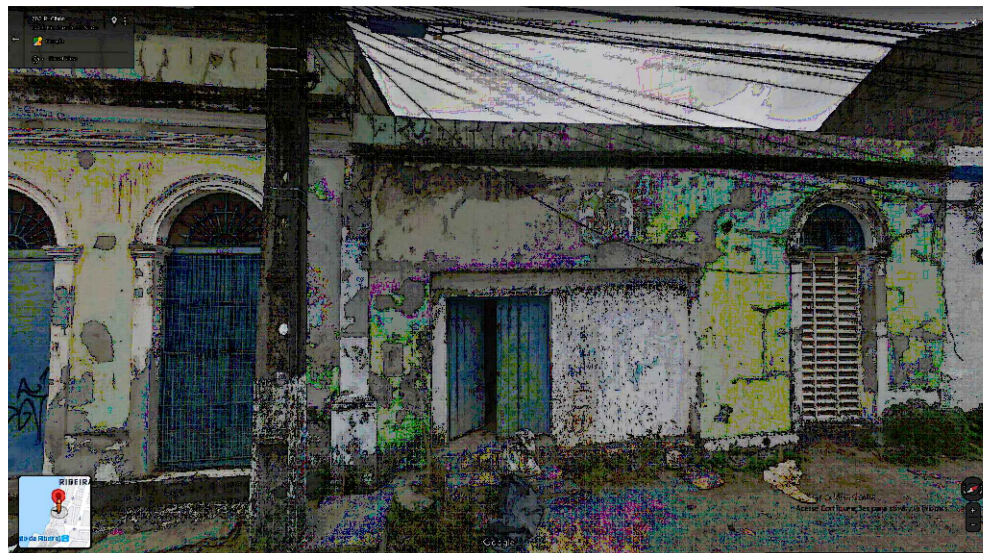
IMAGEM FRONTAL EDIFICAÇÃO RC-188 (AGO. DE 2019)