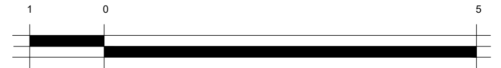
ESCALA GRÁFICA Coordenada geográfica: 5°46'40.7"S 35°12'24.2"W