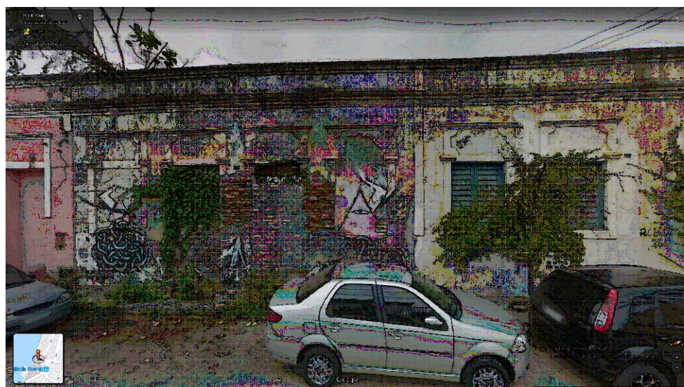
IMAGEM FRONTAL EDIFICAÇÃO RC-251 (AGO. DE 2019)