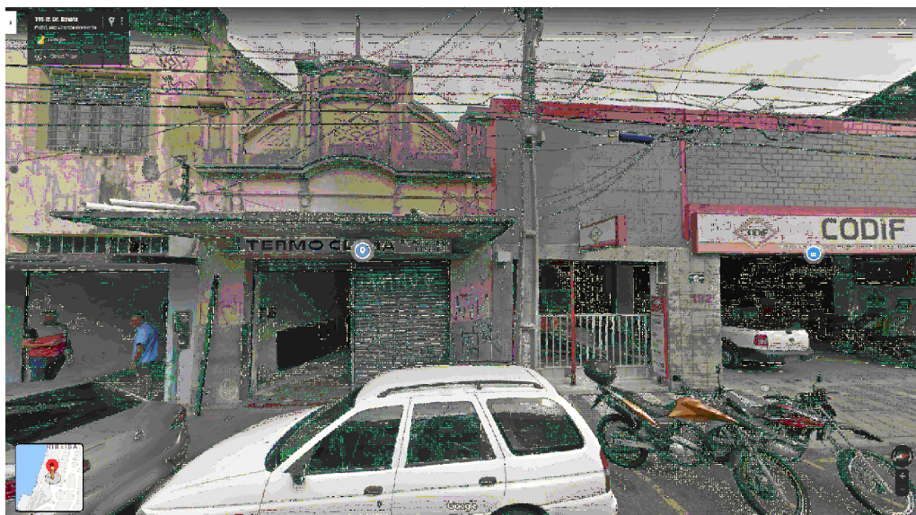
IMAGEM FRONTAL EDIFICAÇÃO RDB-194 (AGO. DE 2019)