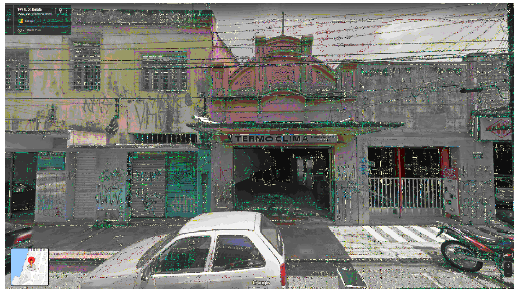
IMAGEM FRONTAL EDIFICAÇÃO RDB-194 (AGO. DE 2015)