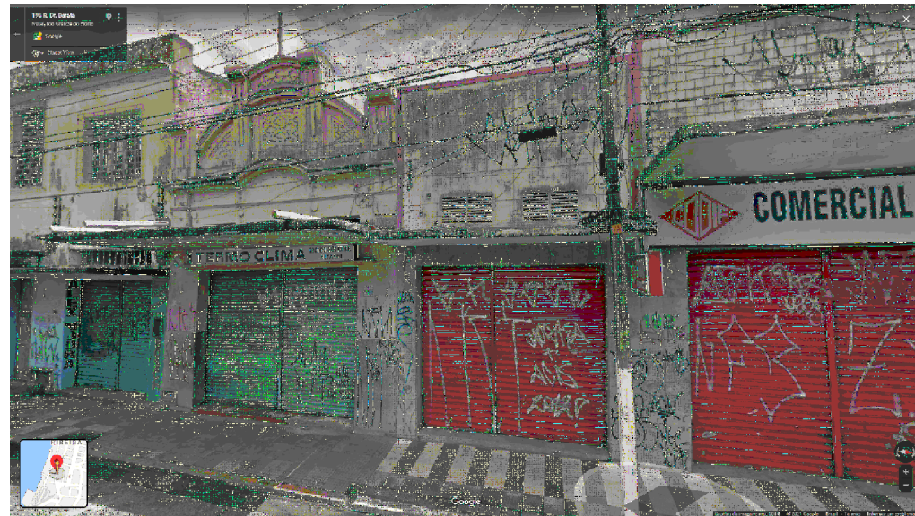
IMAGEM FRONTAL EDIFICAÇÃO RDB-194 (NOV. DE 2011)