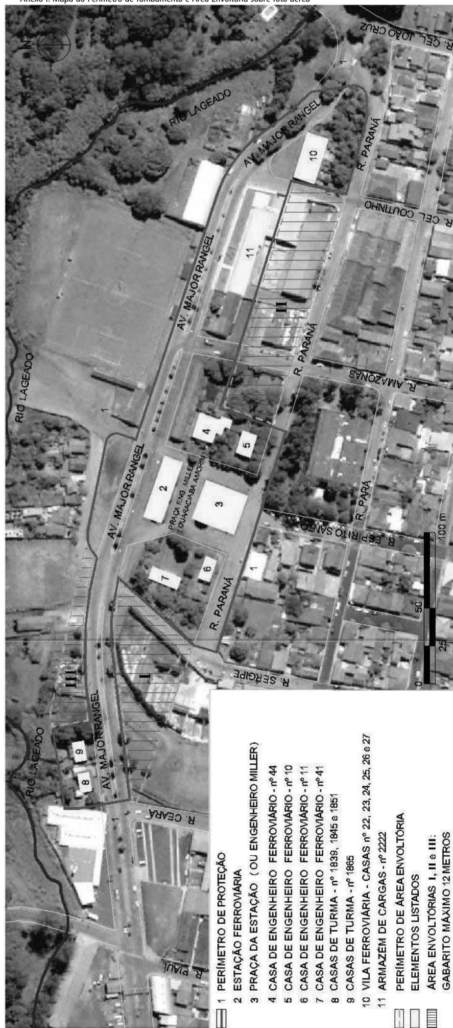
Anexo I: Mapa do Perímetro de Tombamento e Área Envoltória sobre foto aérea