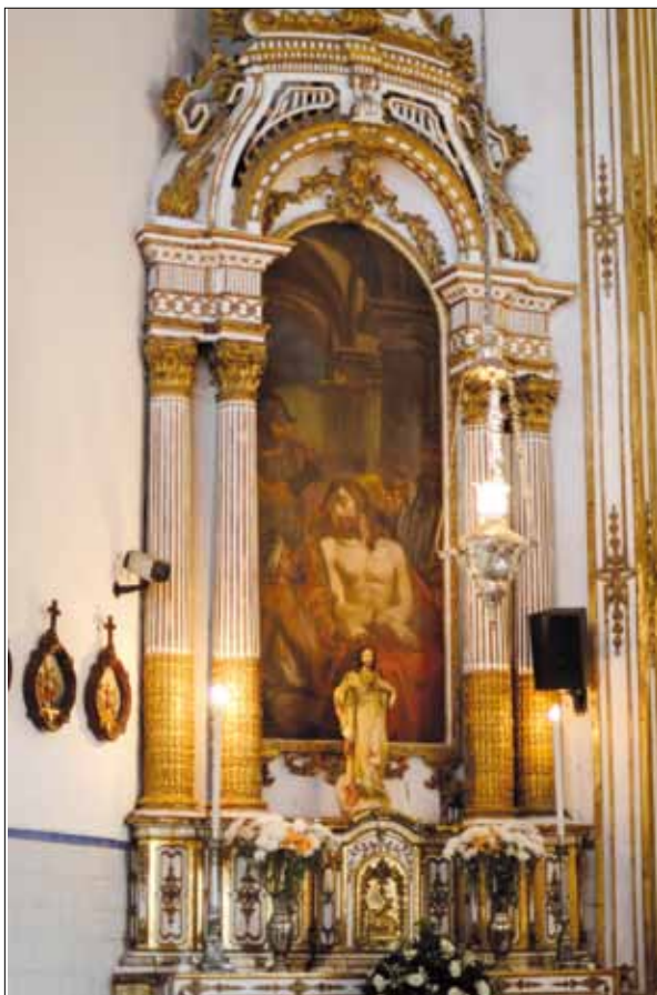
Altar lateral da Igreja do Bonfim – Foto: Marcelo Reis, 2010.

laterais, enquanto, nos corredores e nas dependências, outros artistas realizaram outras obras, dentre as quais a elevação dos consistórios e das seis tribunas, muito baixas até então; o fechamento dos corredores laterais e a colocação de grades de ferro, a cargo do serralheiro Domingos Correa Neves 18 .