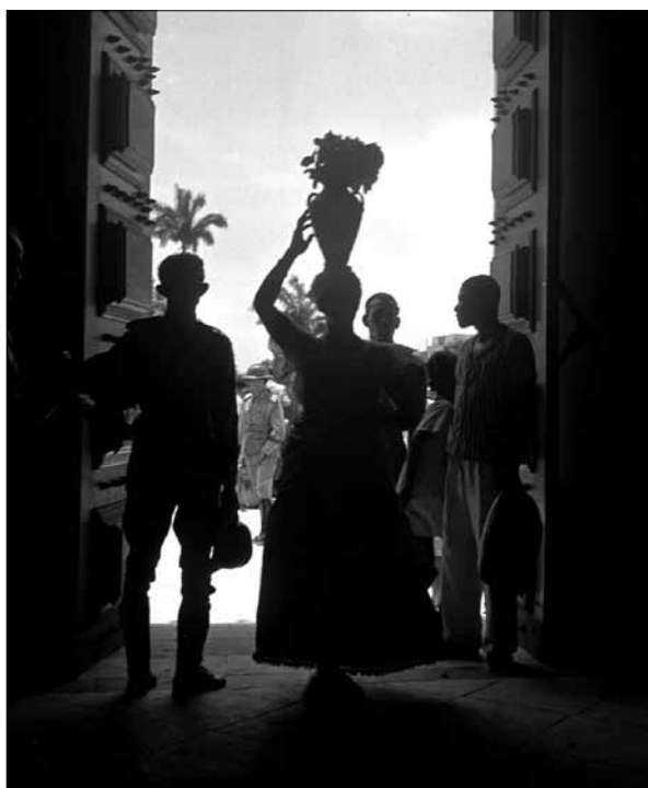
Lavagem da Igreja do Bonfim – Foto: Pierre Verger, 1947.

para a festa, em inúmeras casas de candomblé, as escadas são lavadas. Algumas dessas mulheres entram em transe, ao que acodem outras para que a quartinha não se quebre contra o chão. Não dura muito a Lavagem propriamente dita, qual seja, a varrição e lavagem das escadarias e do adro da igreja do Bonfim.