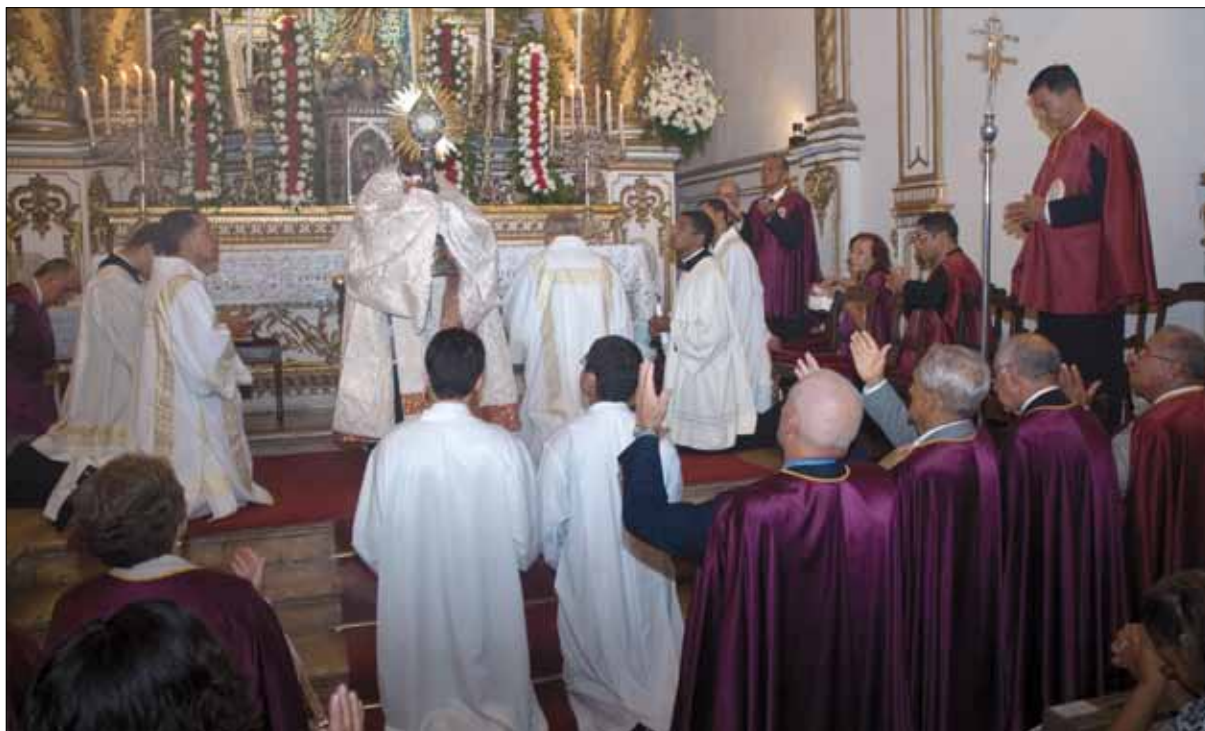
Missa solene na Igreja do Bonfim – Foto: Marcelo Reis, 2010.

Carvalho Filho 35 nos dá essa informação com base no livro de eleições da Devoção. Segundo ele, encontra-se registrado nesse livro o dia 23 de março como a data de realização da festa, em 1761; em 1763, foi celebrada em fevereiro; em 1765, no mês de abril; em 1769, no dia 16 de maio; e em 1771, 20 de setembro.