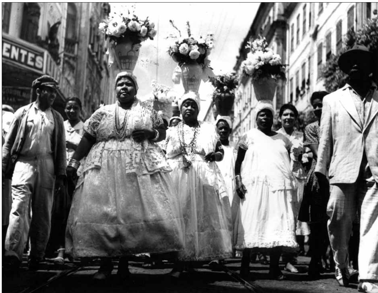
Cortejo das baianas – Foto: Voltaire Fraga, 1950.

Chegando ao Largo de Roma, é a Península de Itapagipe que se faz o centro da cidade. O que se destaca do mapa na direção do centro da baía realiza o milagre de caberem todos que chegam, entre o Largo de Roma e a Baixa do Bonfim. Chega à Baixa do Bonfim e às imediações da igreja, incluindo a colina da Sagrada Família, a