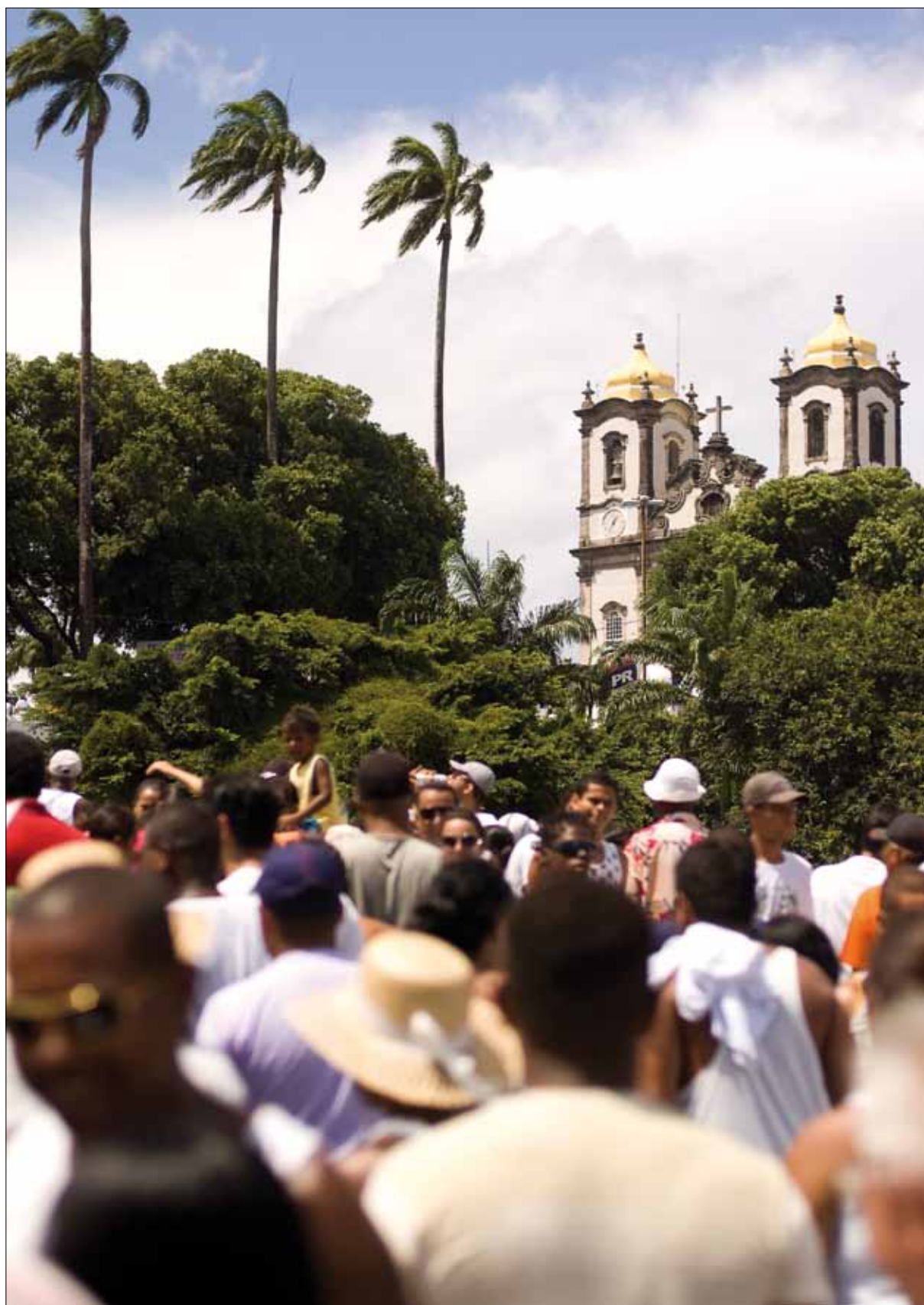
Chegada do Cortejo ao Bonfim – Foto: Marcelo Reis, 2010.