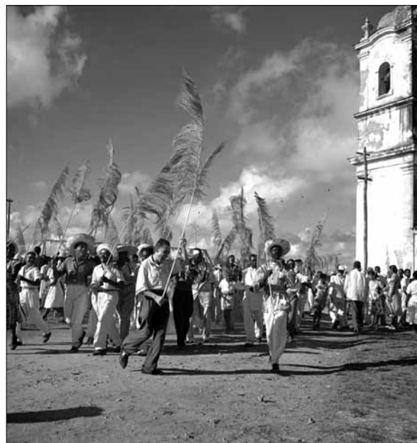
Cortejo do Bonfim

Nosso Senhor do Bonfim é o padroeiro da Bahia; é Jesus e Oxalá. A lavagem da igreja, ao mesmo tempo rito católico e