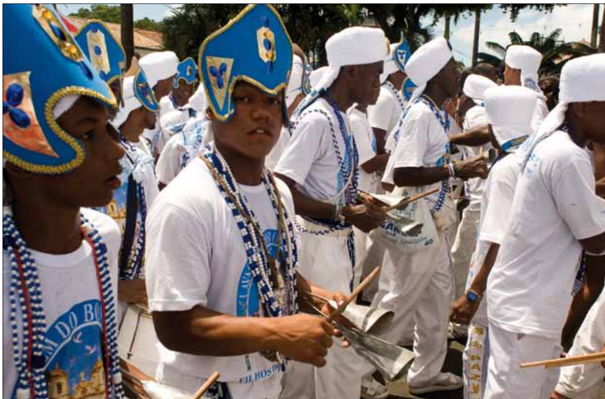
Filhos de Gandhi no Cortejo – Foto: Marcelo Reis, 2010.

música deles, a mesma cor que remete ao Senhor do Bonfim e Oxalá, tudo isto conferindo ao cortejo uma grandiosidade admirável.