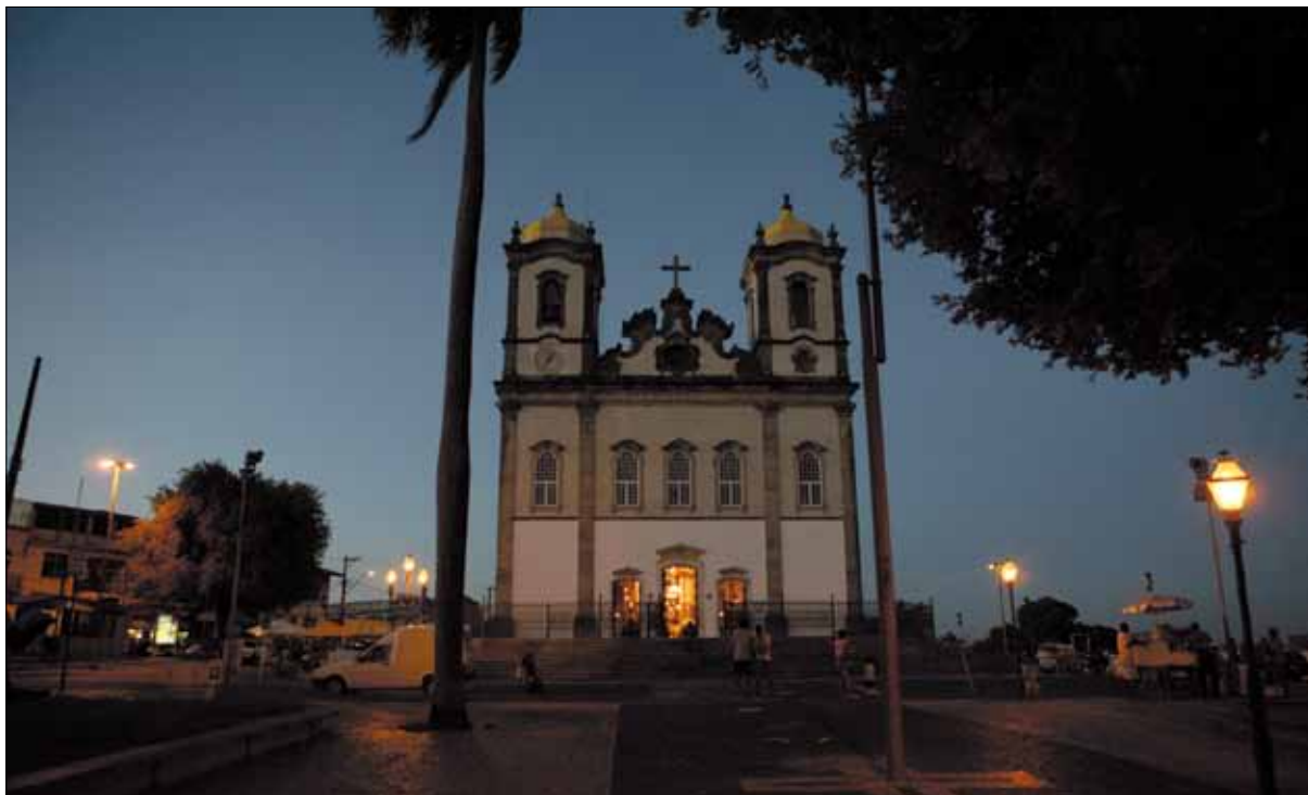
Igreja do Bonfim – Foto: Titus Casal, 2010.

Segundo esse estatuto de 1919, são funcionários da Devoção um Capelão, zelador, sineiro, sacristão e organista. O Capelão deve ser um sacerdote de exemplar conduta, será nomeado pelo Prelado Diocesano e receberá um ordenado marcado pela Mesa e reconhecido pelo Prelado. Cumpre celebrar todos os dias, na capela, as missas; reside em uma das casa do largo, pertencente à Devoção, que lhe é facultada gratuitamente, por assim convir aos interesses do culto e da administração, como auxiliar dela; tomar parte, como um direito que lhe assiste, nas novenas e festas que se celebrarem na capela.