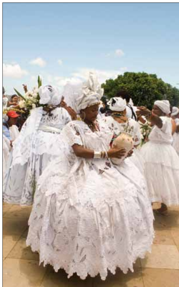
Chegada das baianas ao Bonfim – Foto: Marcelo Reis, 2010.

Os membros de terreiro que seguem o cortejo ritualmente não consomem bebidas alcoólicas durante o percurso. Somente ao chegar à Colina é que, tendo cumprido sua obrigação, podem se entregar ao prazer da bebida. Esse preceito parece generalizado entre os candomblés associados à Lavagem, sendo considerada falta de respeito a ingestão de cerveja ou outra bebida enquanto a água ritualmente preparada ainda estiver no interior da quartinha, pronta para ser despejada sobre o adro e as escadarias da igreja. Nessa ocasião, os fiéis retiram as contas que levam ao pescoço, pois se considera que o momento sagrado propriamente