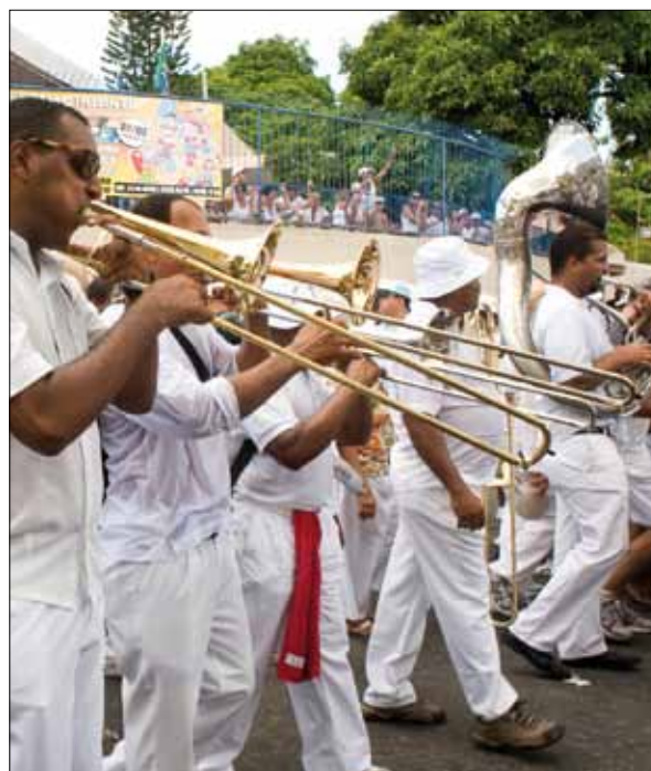
Banda de música no Cortejo

O tipo de música mais praticado na Festa do Bonfim sempre foi o samba. Tanto se fazia o samba de roda em círculos animados que aguardavam a saída do cortejo ao pé da Basílica da Conceição, como ao longo do cortejo. Também em cima das carroças e caminhões faziam-se rodas de samba.