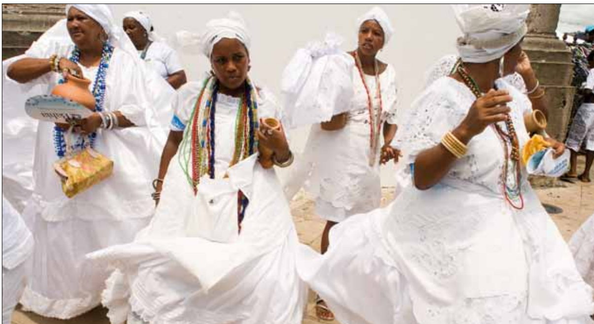
Lavagem do Bonfim – Foto: Marcelo Reis, 2010.

Ladeira da Lenha e a Praça Divina, já no início da Avenida Beira Mar, a rua do Céu e a rua Guilherme Marbach. As carroças sobem a colina empurradas pelos seus passageiros, que apeiam para ajudar os animais a completar o cortejo. De certa forma, como que se verifica a cena de 1944 descrita por Jorge Amado.