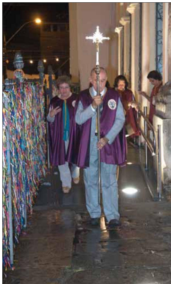
Irmãos da Devoção do Senhor do Bonfim – Foto: Marcelo Reis, 2010.

A Devoção demonstra, por meio dos Estatutos, a tentativa de aproximação com os fiéis, a preocupação com assistência e promoção social; entretanto, mostra-se extremamente criteriosa e excludente no que diz respeito à ocupação dos cargos, exigindo diploma de Bacharel em Direito e Contador para as funções de Procurador e Tesoureiro, respectivamente. É predominantemente uma devoção masculina, ocupada por engenheiros, jornalistas, professores da faculdade de medicina, deputados federais e advogados.