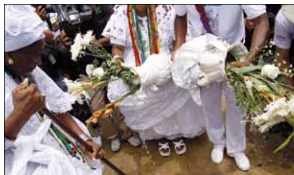
Lavagem do Bonfim – Foto: Marcelo Reis, 2010.

Num revolteio de saias brancas, num movimento mágico das quartinhas que despejam água tratada