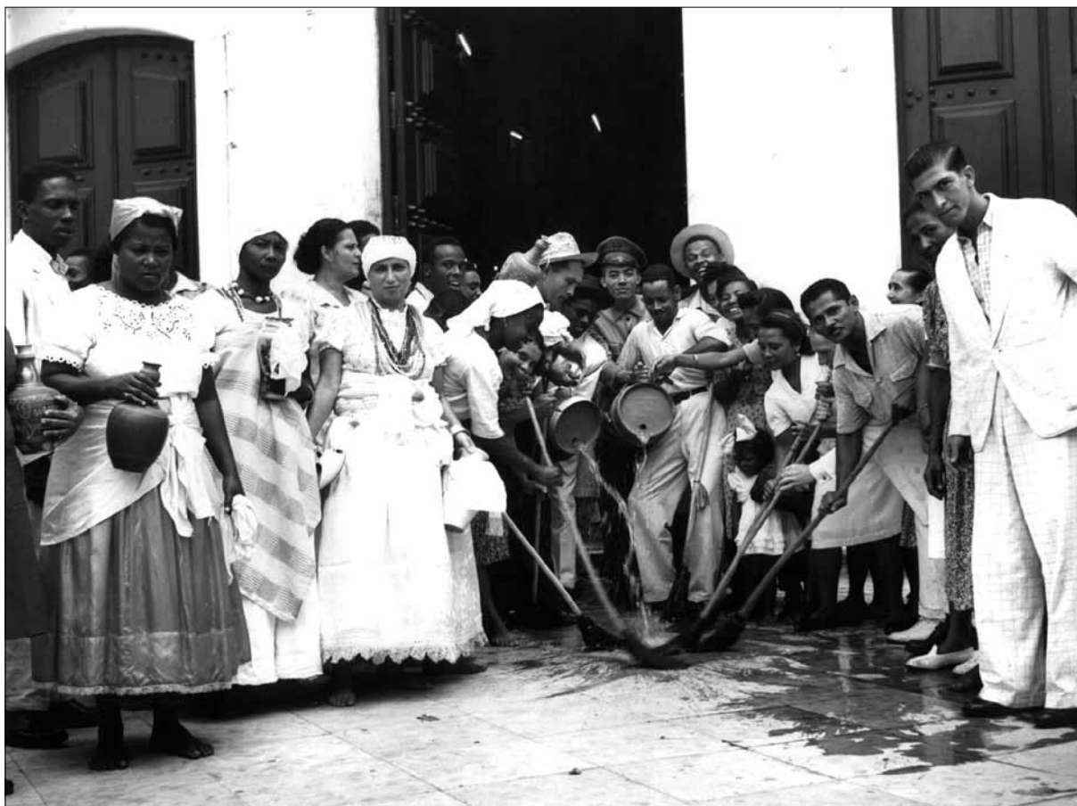
Lavagem da Igreja do Bonfim – Foto: Voltaire Fraga, 1950.

Tendo visto com a maior surpresa e assombro, em alguns dos Registros de São Gonçalo, que no dia 3 do corrente, durante a celebração dos santos mistérios na festividade do mesmo glorioso santo, se distribuiu na capela do Senhor do Bonfim a sacrílega, blasfema, indecente e ridícula legenda ou inscrição, “São Gonçalo das moças”, que derivando-se de absurdos prejuízos ou crenças populares, deslustra a pureza do culto tributado àquele santo, e importa uma verdadeira superstição, que os teólogos chamam de culto indêbito, injurioso aos progressos da civilização, e apenas própria desses desgraçados tempos, em que uma mal entendida piedade misturava nos atos mais santos o sagrado com o profano, a mitologia com o evangelho, e Babilônia com Sião, [...] profanando a efigie de um dos mais insignes heróis de perfeição evangélica, com seu título mal soante, ainda aos ouvidos menos delicados, e que decerto nenhum homem sério consentiria que se ajuntasse ao seu nome, ou se estampasse por baixo de seu retrato. 40