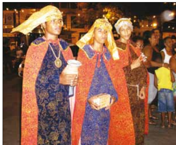
Ternos de Reis – Fotos: Edilece Couto, 2009.

Segundo seus organizadores, hoje, não se trata de uma festa “da Igreja” – no sentido de instituições