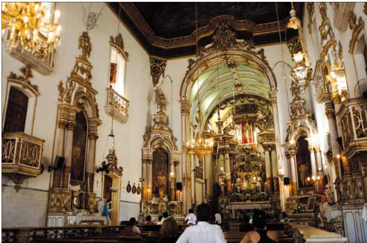
Interior da Igreja do Bonfim – Foto: Marcelo Reis, 2010.

Em 1863, foram inaugurados o chafariz do largo e o adro da igreja, cujas pedras foram colocadas em 1865 12 . No meio do largo, ergue-se o chafariz, mandado vir da Itália, todo em mármore branco, encimado pela estátua do Salvador, esculpida em mármore de Carrara. O monumento foi colocado em 1863, por iniciativa do tesoureiro da Devoção, com o produto das esmolas dos devotos. A estátua, que tem um metro e cinqüenta centímetros, representa Jesus Cristo abraçado com a cruz, trazendo à esquerda uma corrente despedaçada e, à direita, o index apontando para o céu. Está apoiada sobre um hemisfério e tem o pé esquerdo pisando uma serpente. A cruz representa a fé e a salvação; a corrente partida é a redenção da humanidade, a sua libertação do pecado; o index apontando para o céu diz que há um só Deus dadivoso, remunerador das eternas moradas; o pé pisando a serpente define o triunfo sobre o pecado.