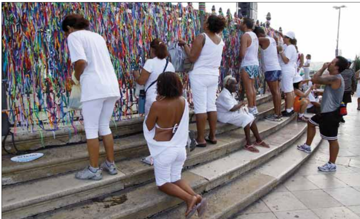
Devotos fazem pedidos – Foto: Marcelo Reis, 2010.

de filhos de santo que adentrou o santuário com roupas rituais. Em ambas as ocasiões, uma dessas pessoas encontrava-se em estado psíquico alterado, ainda que não propriamente manifestada, de cabeça coberta, cuidadosamente arrodada pelos irmãos de santo. Uma cena assim vem confirmar o que se afirmou sobre a interseção entre as duas matrizes religiosas.