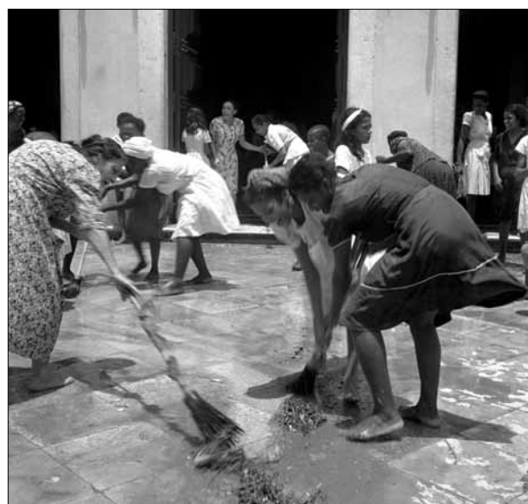
Lavagem do adro da Igreja do Bonfim – Foto: Pierre Verger, 1947.