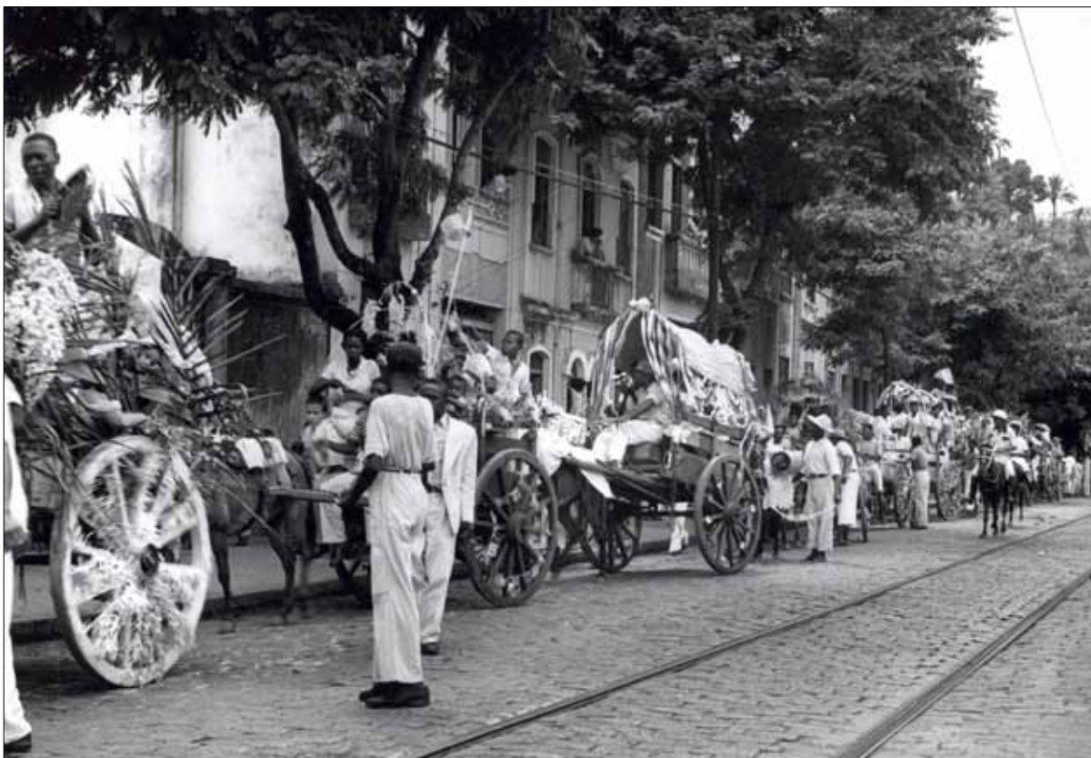
Carroças no Cortejo do Bonfim – Foto: Voltaire Fraga, 1950.

Escolhiam-se os animais de saúde comprovada, capazes de trotar quilômetros afora a caminho de algum ponto da rota do cortejo, evitando-se aqueles conhecidos como agressivos e perigosos. Os arreios, as selas e ferraduras eram cuidadosamente verificados, assim como o pêlo passava por um banho esmerado. Alguns cavaleiros iam apenas com sua montaria; outros, em duplas e trios; outros ainda combinavam entre si de modo a formar grupos maiores, passando a integrar garbosamente o cortejo. Um costume que se guardava, até então, era “derrubar alguém do cavalo” durante o cortejo, consistindo em puxar suas mãos até que perdesse o equilíbrio e tivesse que apear. Grupos inteiros de familiares, vizinhos e colegas de trabalho acorriam ao local do cortejo também para ver passarem os conhecidos montados.