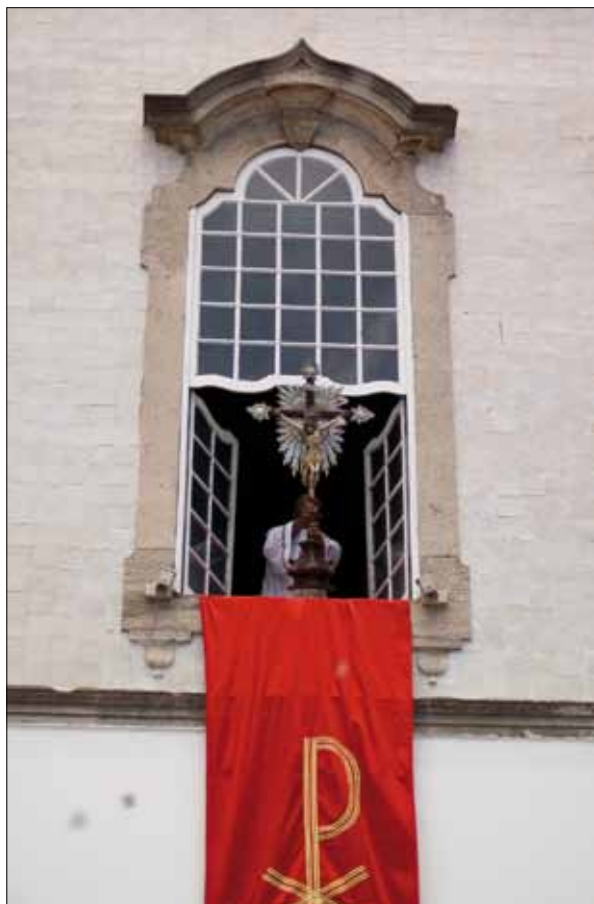
Benção no dia da Lavagem – Foto: Marcelo Reis, 2010.

poucas caretas emblemáticas do seu Carnaval, no Largo de Roma.