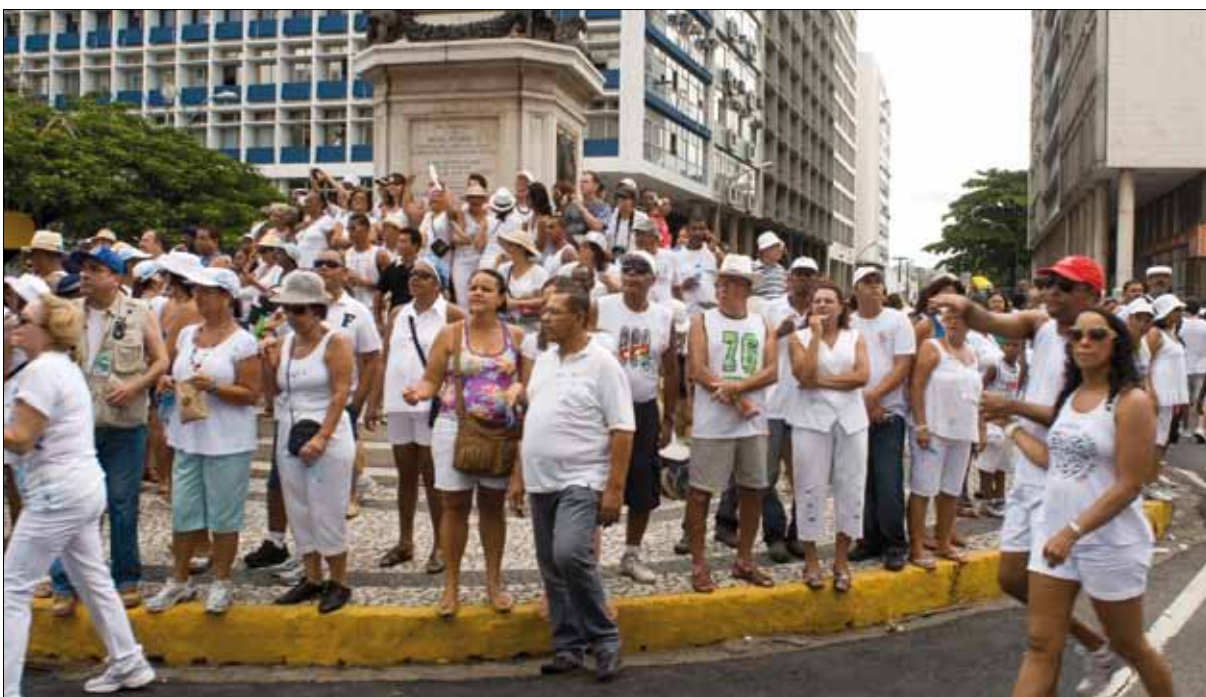
Festa do Bonfim – Foto: Marcelo Reis, 2010.