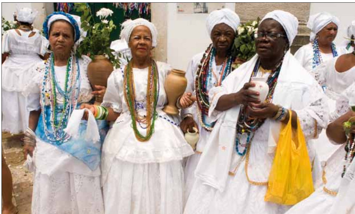
Baianas na Lavagem da Igreja do Bonfim