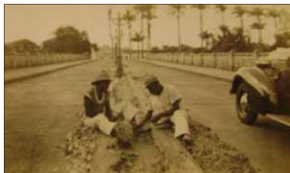
Ladeira de acesso à Colina do Bonfim

Em 1810, foi construída a então denominada Ponte de Pedra, a atual ladeira do Bonfim, notável obra de alvenaria, destinada a facilitar o acesso dos romeiros. Em 1849, as “Casas dos Romeiros” já estavam construídas.