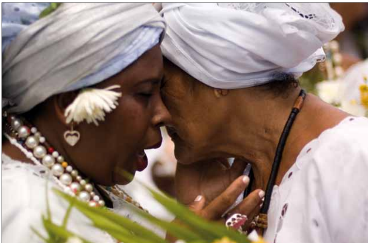
Festa do Bonfim – Foto: Marcelo Reis, 2010.

impedia que acontecessem, num templo de ampla afluência popular, cenas como estas, que mostram uma profunda interação de duas matrizes religiosas tão distintas entre si.