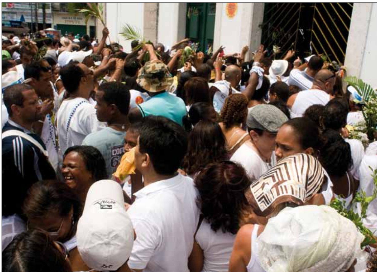
Saída da Procissão – Foto: Marcelo Reis, 2010.

mado de missa, e sim, “o sabá negro das feiticeiras”, e ainda comparou a nave da igreja a uma “sala de dança, grande, alegre e animada”. 49