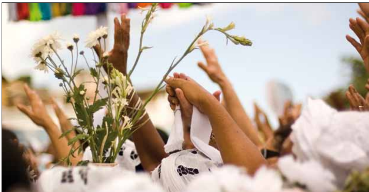
Festa do Bonfim – Foto: Marcelo Reis, 2010.

condições financeiras para arcar com essas despesas. Torna-se necessário, então, que os órgãos competentes identifiquem as baianas mais assíduas e forneça ajuda de custo e transporte. Além disso, muitas vezes o trajeto desde suas casas, localizadas nas ilhas, cidades do Recôncavo ou na periferia de Salvador, até a concentração em frente à Igreja da Conceição da Praia, é muito maior que aquele percorrido por todos os participantes. É fundamental garantir também água e alimento a essas mulheres.