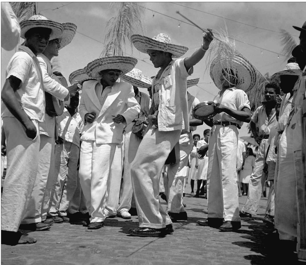
Roda de Samba na Festa do Bonfim – Foto: Pierre Verger, 1947.

vera, não eram jumentos, eram animais simbólicos e lendários. Nunca se reuniu no mundo tanto colorido, tanta graça e tanta alegria. Todas as cores nos vestidos das baianas , nos papéis pintados, nos desenhos dos tabuleiros, nas flores sobre as filhas, os moringues, os potes. Ah! A sedução destas bilhas, destes potes, destes moringues... As frutas da Bahia, mangas, laranjas, sapotis, abacaxis, esplêndidas, saltam dos tabuleiros, são para o santo. Porque Senhor do Bonfim, como os orixás negros, recebe presentes de frutas nos ritos africanos 69 .