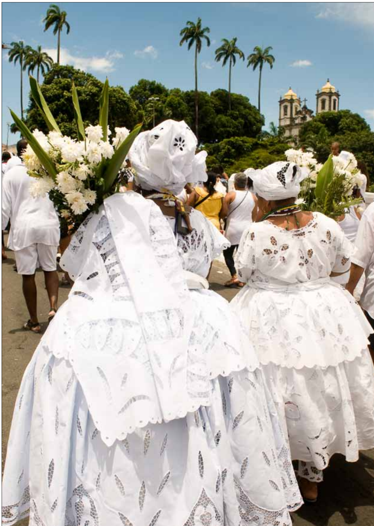
Cortejo das baianas – Foto: Marcelo Reis, 2010.