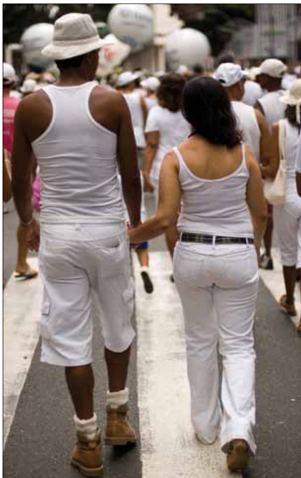
Cortejo do Bonfim – Foto: Marcelo Reis, 2010.