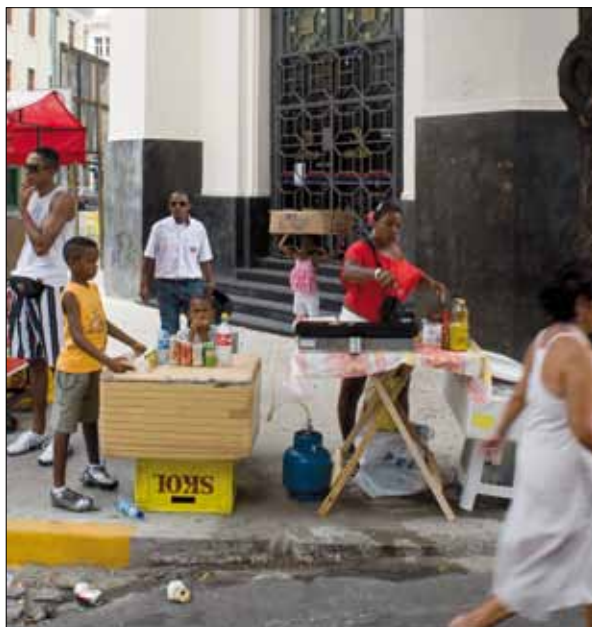
Vendedores – Foto: Marcelo Reis, 2010.

se deve, provavelmente, à recorrência das imagens da festa, oportunizadas pela mídia, a cada ano.