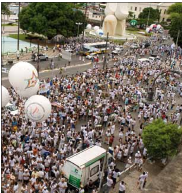
Saída do Cortejo – Foto: Marcelo Reis, 2010.

gar a trinta, de diversos tamanhos e correspondendo a diversos tipos de repertório – aguardavam a passagem desses elementos. O primeiro trio só começava a se deslocar próximo da Igreja da Conceição da Praia, quando as baianas já tivessem se distanciado, nas imediações da Feira de São Joaquim. Cabe observar, também, que nem todos esses trios ultrapassavam o Largo de Roma e que, em boa parte dos casos, só no final da tarde deixa-