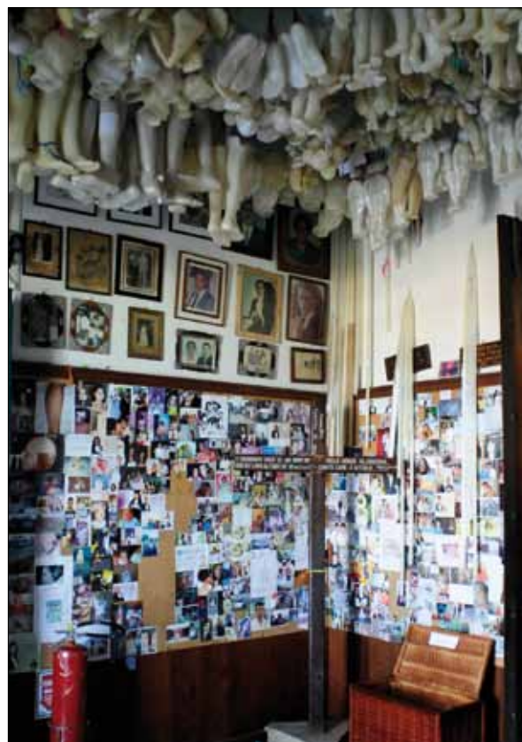
Museu de Ex-votos, Igreja do Bonfim