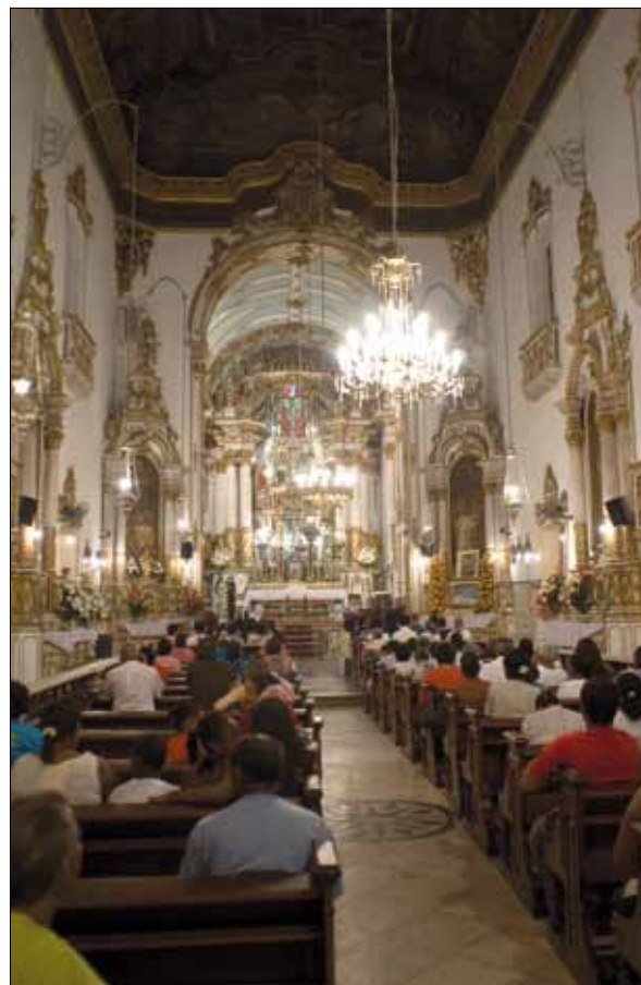
Novena na Igreja do Bonfim – Foto: Marcelo Reis, 2010.

A Mesa se reunirá na última semana de dezembro, com a presença do Reitor, cuja nomeação fica a critério do Arcebispo Primaz para poder eleger o juiz, escrivão,