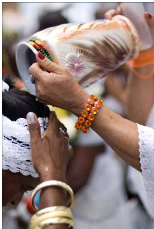
Lavagem da Igreja do Bonfim – Foto: Marcelo Reis, 2010.

Carlos Ott 44 tem uma explicação interessante para a Lavagem. Seria um ato simbólico de lavar o santo para a festa em comemoração ao seu aniversário. O costume dos descendentes de africanos de lavar o orixá na véspera de sua festa ainda pôde ser observado pelos alunos do professor em Arembepe, praia próxima a Salvador, na segunda metade do século XX, mas pode ter sido substituído pela lavagem da igreja ou da casa do orixá.