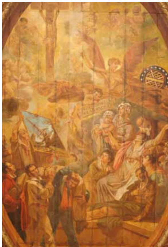
Pintura do teto da Igreja do Bonfim – Foto: Marcelo Reis, 2010.

No decorrer dos anos, a igreja foi remodelada várias vezes. A primeira mudança se deu 60 anos depois da