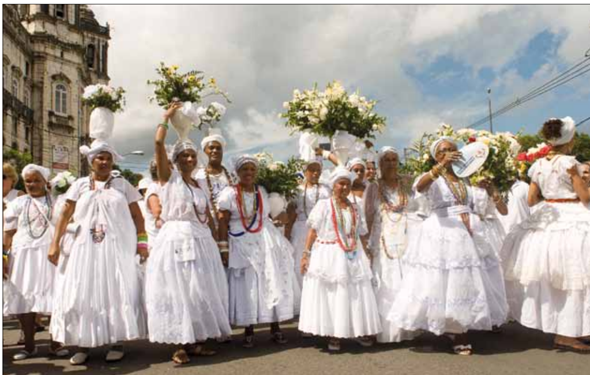
Saída das baianas da Igreja da Conceição da Praia