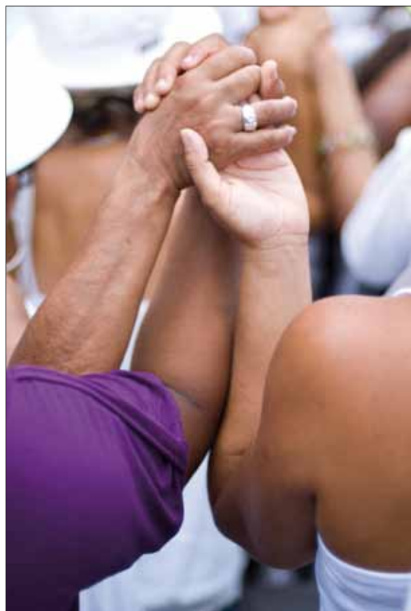
Festa do Bonfim

Para a equipe que trabalhou neste dossiê, a manifestação mais impressionante da experiência de sentido da Festa do Bonfim vem das baianas que a frequentam como uma missão familiar. Muitas baianas recebem como herança o hábito de participar do cortejo e da Lavagem. É comum ouvir frases como: “Quanto eu era pequena, vi-