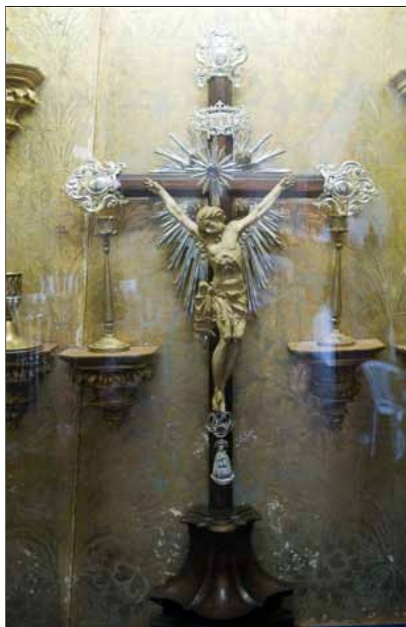
Imagem de Nosso Senhor do Bonfim

pertencente à paróquia de Santo Antônio, e que ficaria conhecido como Colina do Bonfim. A igreja só ficou pronta em 1754. No dia de São João, 24 de junho desse ano, os devotos tiveram bons motivos para fazer os festejos juninos, com mais brilho e foguetes ainda mais intensos, pois a imagem do Senhor do Bonfim foi transladada da Igreja da Penha para a capela própria no Alto do Bonfim. No altar-mor, também foi colocada uma imagem de Nossa Senhora da Guia.