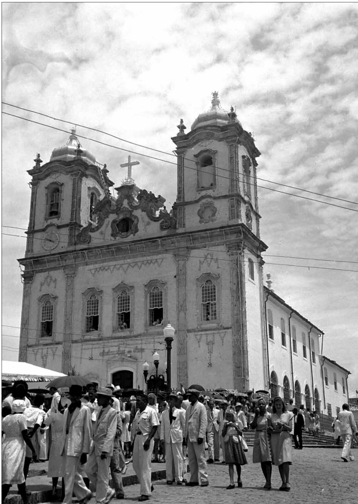
Igreja do Bonfim – Foto: Pierre Verger, 1959.