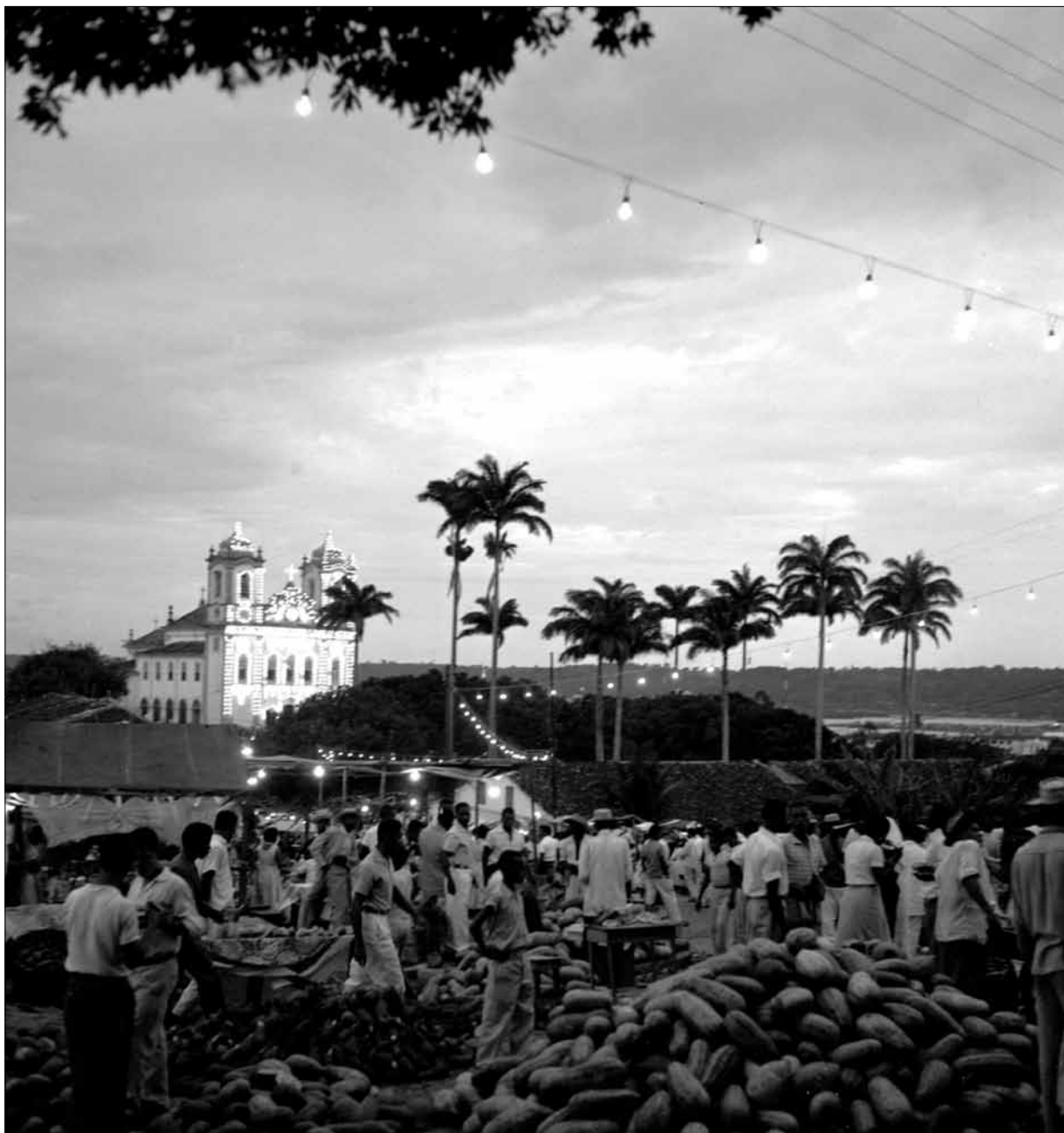
Festa do Bonfim – Foto: Pierre Verger, 1959.

dificuldade na passagem da liderança. Com a morte do Reiseiro, o grupo tende a se desfazer ou passar longo período sem realizar a brincadeira; 3. Por último, o maior dos problemas: a falta de financiamento para confeccionar a indumentária e os adereços, bem como para alimentar e transportar os integrantes até os locais das apresentações.