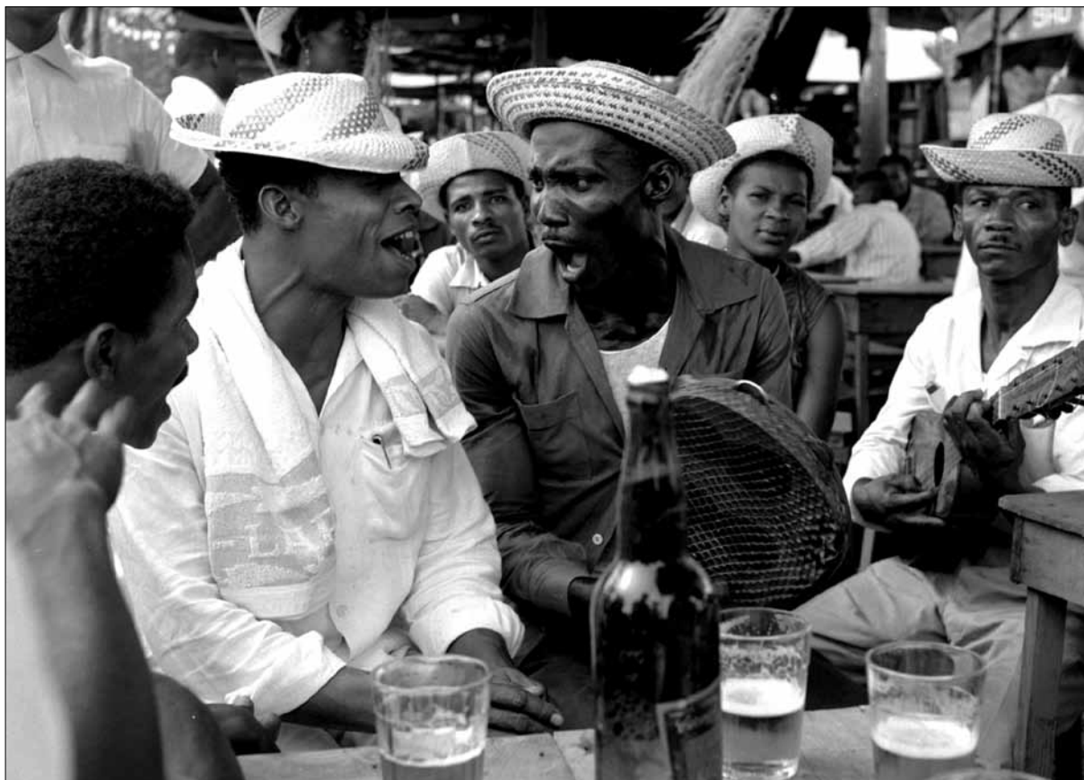
Barraca na Festa do Bonfim – Foto: Pierre Verger, 1947.

mavam a atenção, absurdos, mas evocadores do esplendor, das lendas e das veladas alegrias de um mundo de sonho. Um deles era Flor do Amor; outro era Filho de Deus; um terceiro, Maravilhas da Arábia. Outros eram Novo Mundo, O Conquistador, Os Reis do Oriente, As Três Belas Meninas [...] A fragrância da comida em preparo se exalava no ar aquecido. Não vi ninguém se esforçando por vender, se bem que as barracas estivessem cheias de fregueses. Havia enorme consumo de tapioca e de laranja “americana” que, tenho certeza, fora engarrafada nos Estados Unidos havia muito, pois o seu sabor estava horrivelmente estragado por preservativos. Havia também aruá, que era a bebida da gente do culto, e água de coco, fresca, bebida no próprio coco 68 .