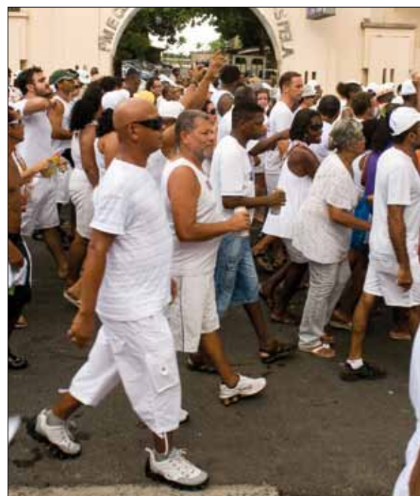
Cortejo do Bonfim – Foto: Marcelo Reis, 2010.

Desde a saída, o cortejo da lavagem é um desagudouro de muitos pequenos cortejos que vão confluindo desde muitos e diferentes locais de origem. Desde cedo, descem alguns pequenos grupos da Ladeira da Conceição e mesmo da Avenida Contorno, sendo que algumas pessoas ainda se arrumam, seja nos trajés, seja nos apetrechos que nessas horas se reconfiguram em adereços: chapéus, bonés, viseiras, bandanas, toalhinhas, colares, cataventos. Gente dos Barris, da Barra e de diversos bairros que têm linhas de ônibus até o ponto mais próximo do Elevador Lacerda, qual seja, hoje, a rua do Pau da Bandeira.