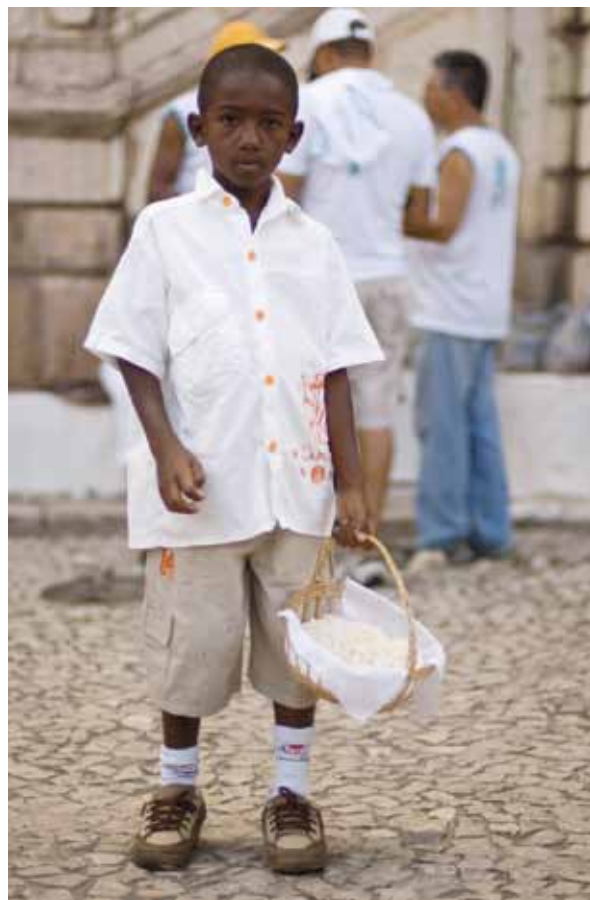
Festa do Bonfim – Foto: Marcelo Reis, 2010.

Uma festa que atrai milhares de pessoas num único dia, o da Lavagem, que tem um percurso oficial com