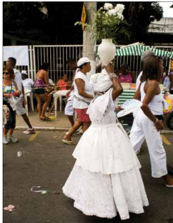
Cortejo do Bonfim – Foto: Marcelo Reis, 2010.