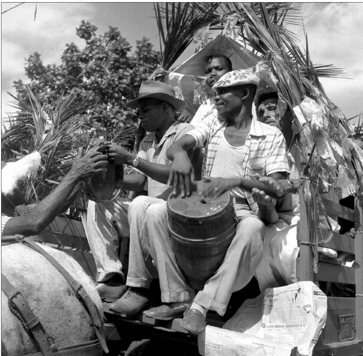
Sambistas no Cortejo da Festa do Bonfim – Foto: Pierre Verger, 1959.

eirista, profundo entendedor destes mistérios e trouxe a todos os presentes uma agradável convicção. Mesmo porque a baiana [em itálico no original] que leva um pequeno pacote cheio de água é um convite ao pecado com seus olhos de dengue e sua boca de beijos. Não há o pecado neste dia felizmente!