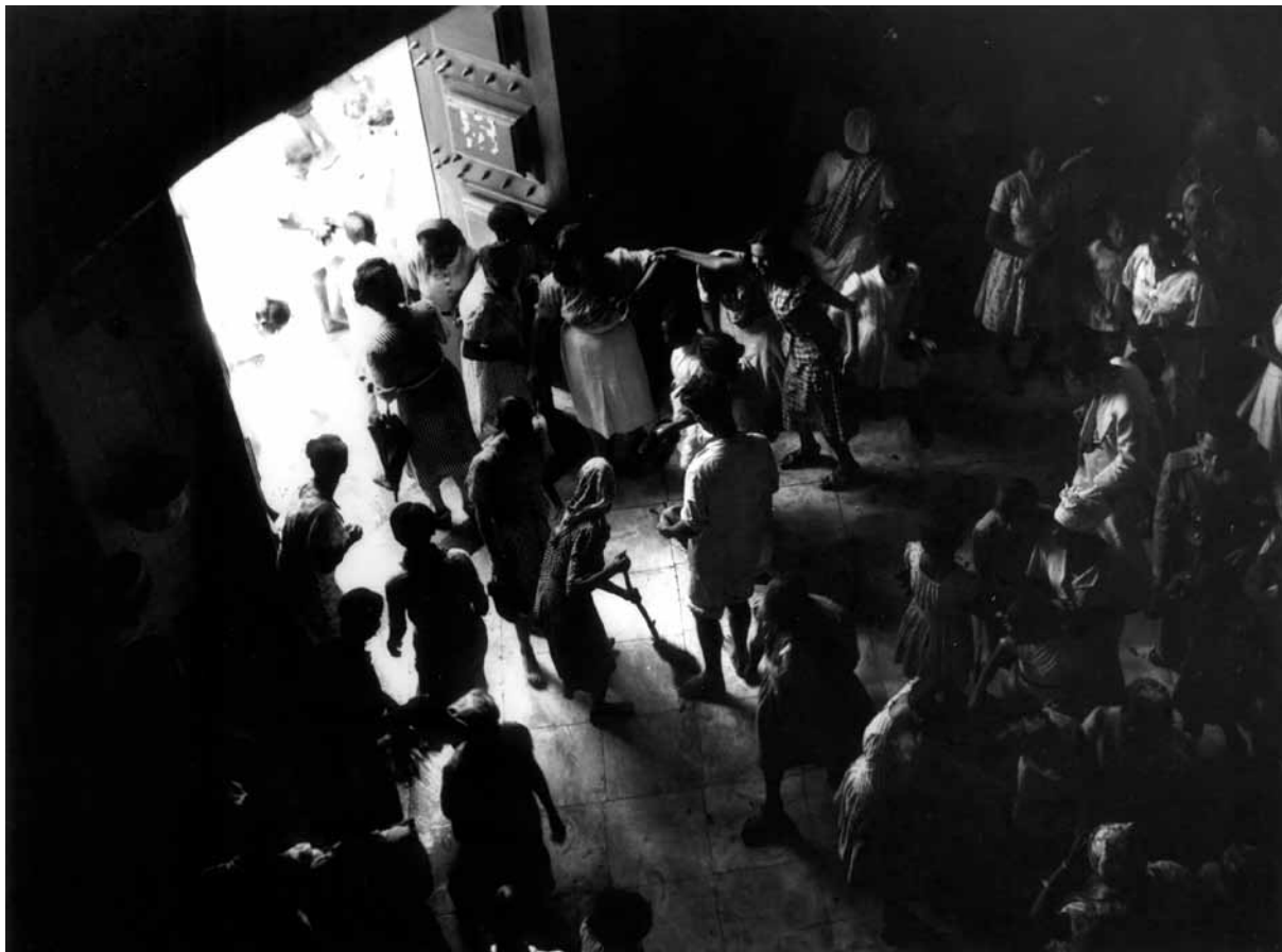
Lavagem no interior da Igreja do Bonfim – Foto: Voltaire Fraga, 1950.