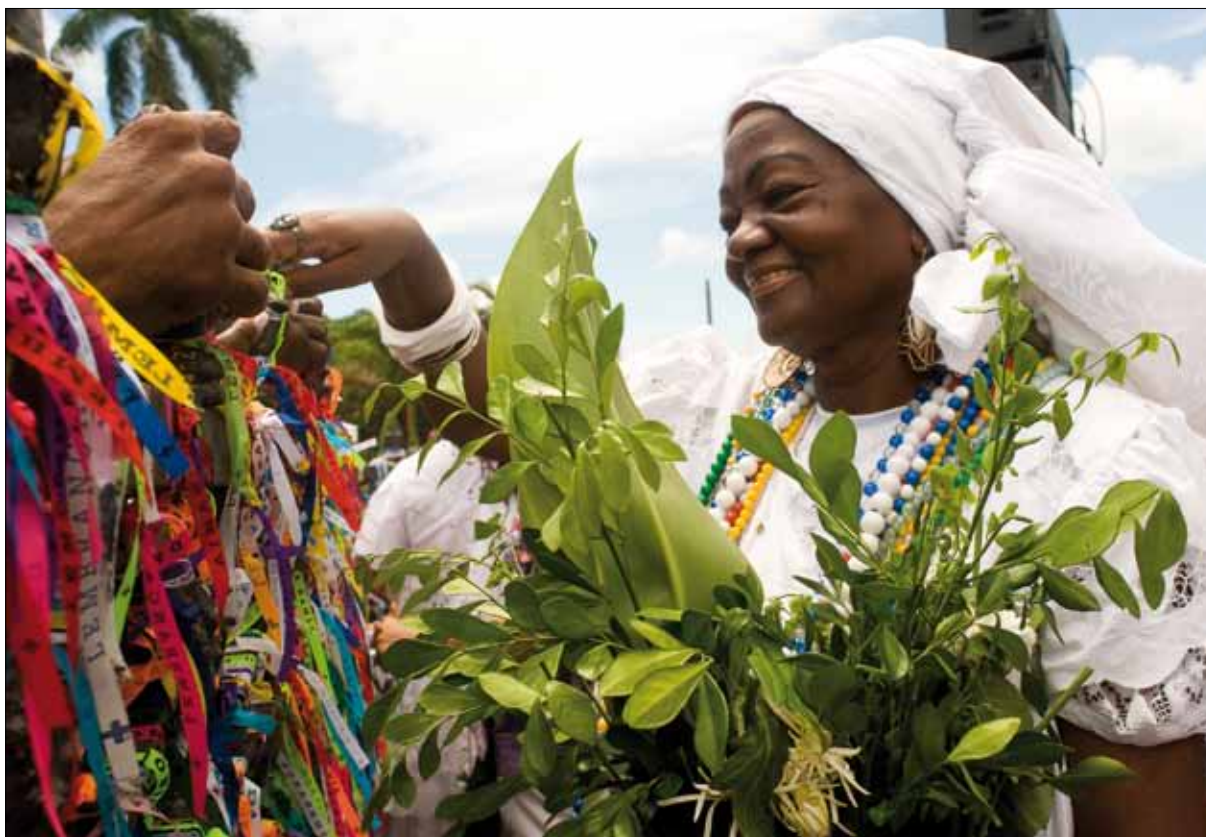
Lavagem da Igreja do Bonfim – Foto: Marcelo Reis, 2010.

Muitos tentaram extinguir a Lavagem do Bonfim, mas foi esse arcebispo quem conseguiu, com o apoio da polícia, proibir tal ato. Suas normas expressas em ofícios e portarias deveriam ser respeitadas em todos os templos da capital, porém a Igreja do Bonfim é citada em função da importância da festa para os baianos e do enorme “ajuntamento” de pessoas pelas ruas da cidade. Segundo o próprio arcebispo, “pela multidão de pessoas de ínfima classe que para ali afluem nesse dia” 51 Ou seja, pela quantidade de praticantes do Candomblé, africanos e descendentes em sua maioria.