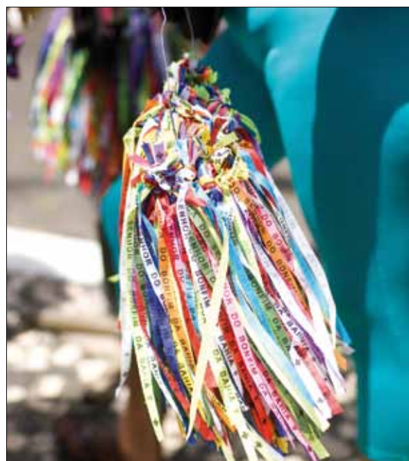
Fitas do Senhor do Bonfim – Foto: Marcelo Reis, 2010.

Atualmente, as pessoas usam a fita do Senhor do Bonfim no pulso, com nós que correspondem ao número de pedidos, normalmente três, na expectativa de