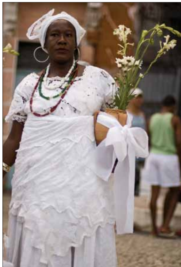
Baiana na Festa do Bonfim – Foto: Marcelo Reis, 2010.

Poder-se-ia perguntar: como os gestores da Festa do Bonfim a apresentam à população, sobretudo