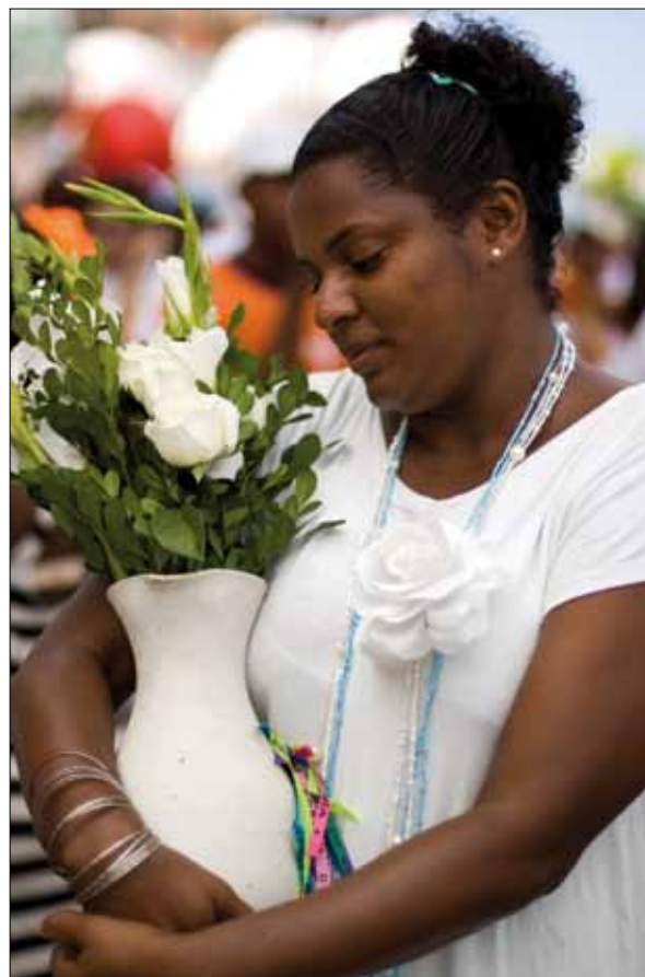
Festa do Bonfim – Foto: Marcelo Reis, 2010.

O candomblé alcançou o status do que se pode chamar de segunda religião oficial do Estado da Bahia nos