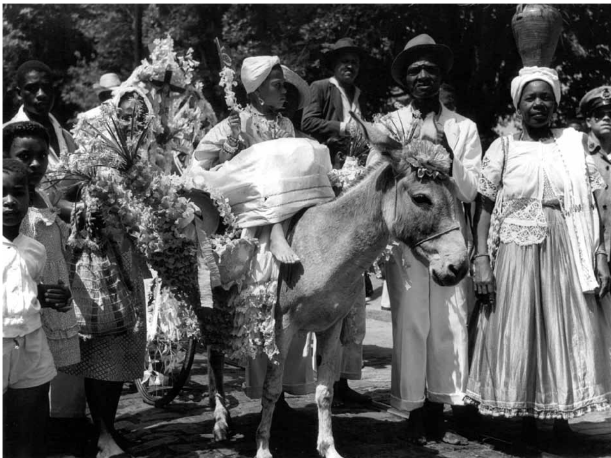
Cortejo do Bonfim – Foto: Voltaire Fraga, 1950.

famoso parece ter sido o grupo É com esse que eu vou , que saía da Lapinha, bairro vizinho à Liberdade, em direção ao Bonfim, lá chegando aproximadamente na mesma hora em que aí despontava o cortejo que vinha da Conceição.