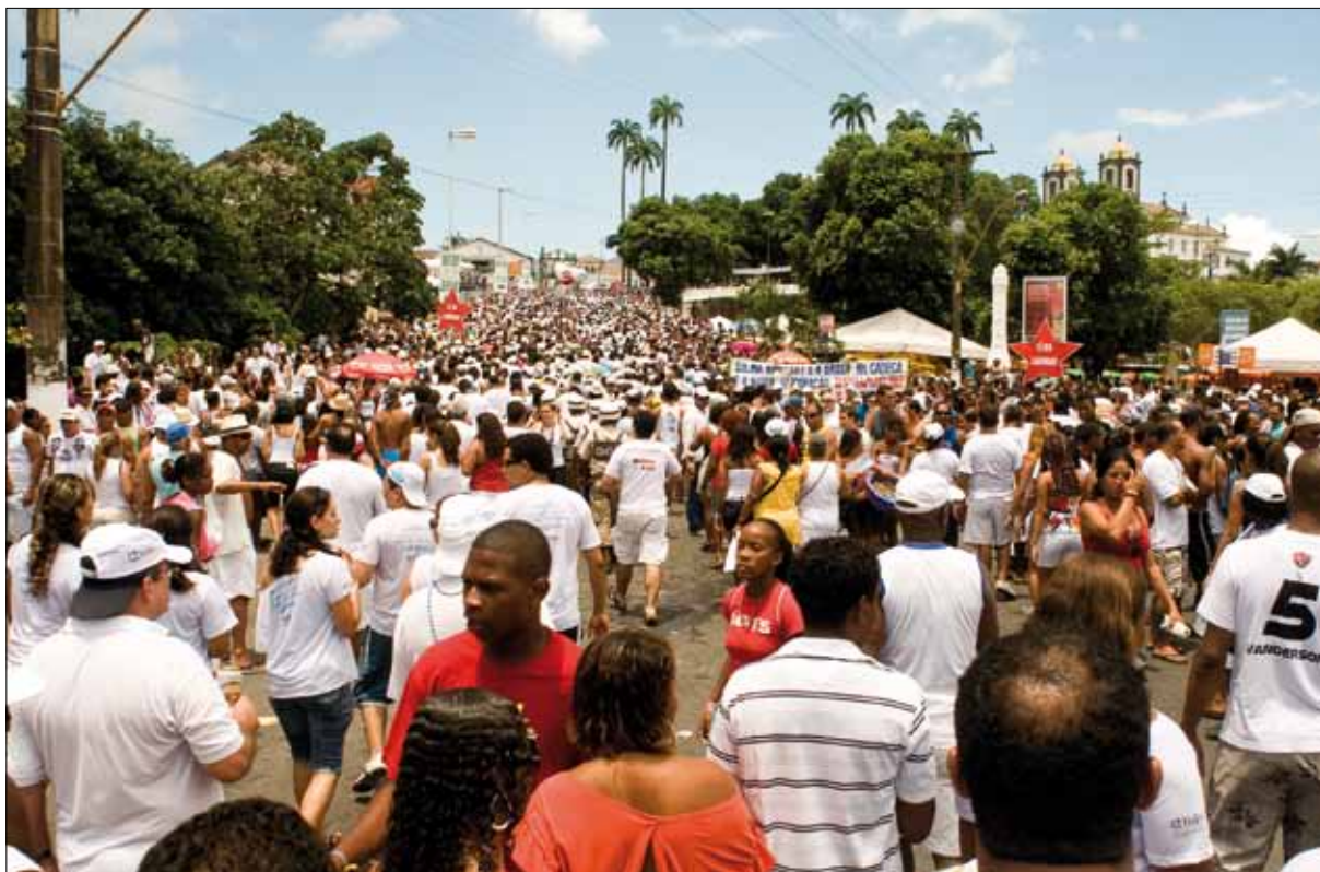
Festa do Bonfim – Foto: Marcelo Reis, 2010.

curioso e desconhecido. Pelo contrário, todos os entrevistados mostraram já conhecer os festejos seja através da imprensa, seja do relato de amigos e parentes, seja ainda da literatura, da música ou da internet. A Festa do Bonfim, assim, integra o conjunto de referências da cultura brasileira que os visitantes e turistas já trazem consigo quando querem conhecê-la diretamente. Alguns depoimentos neste sentido: “Sempre desejei conhecer, porque ouvia muito falar. Faltava essa oportunidade”. “Desde que ouvia falar, nas músicas, na televisão, eu tinha vontade de vir aqui e fazer minha oração. Só hoje estou podendo realizar esse sonho”. “Acho que todo brasileiro devia vir aqui e ver que aquilo que a gente ouve no rádio, na televisão, acontece de verdade. É uma emoção muito grande, espero poder voltar e trazer meus filhos. A Festa do Bonfim é uma das coisas mais marcantes que já vi no Brasil”.