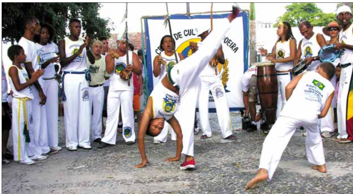
Roda de Capoeira na Festa do Bonfim – Foto: Horst Wolf, 2009.

Outro elemento que vem caracterizando a musicalidade da Lavagem do Bonfim nas últimas décadas são os grupos de capoeira, desde a saída do cortejo, na Conceição, abrindo rodas em alguns pontos do cortejo. Independentemente de integrar ou não as academias de capoeira, esses grupos levam berimbaus, atabaques e agogôs, surdos, pandeiros e repeniques. Quando se abre a roda de samba, muitos passantes se aproximam e dançam um ponto. São momentos de muita alegria e efusão.