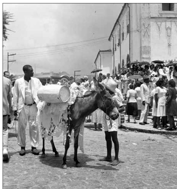
Aguadeiro na Festa do Bonfim – Foto: Pierre Verger, 1947.

ceição. Eram veículos de porte modesto, em cuja carroceria seguiam as baianas com suas quartinhas enfeitadas. Esses caminhões eram fretados por grupos de amigos, parentes e vizinhos, ligados ou não a uma casa de candomblé. O mais