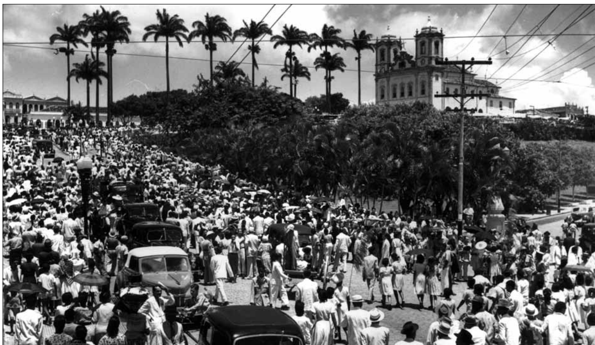
Igreja do Bonfim, 1950.

cipantes, quanto no significado religioso, especialmente entre os afro-descendentes e adeptos do Candomblé, e se tornou uma manifestação de fé tão importante que, muitas vezes, suplantou os atos católicos realizados dentro da igreja. Esse é também o momento de maior visibilidade das homenagens ao Senhor do Bonfim.