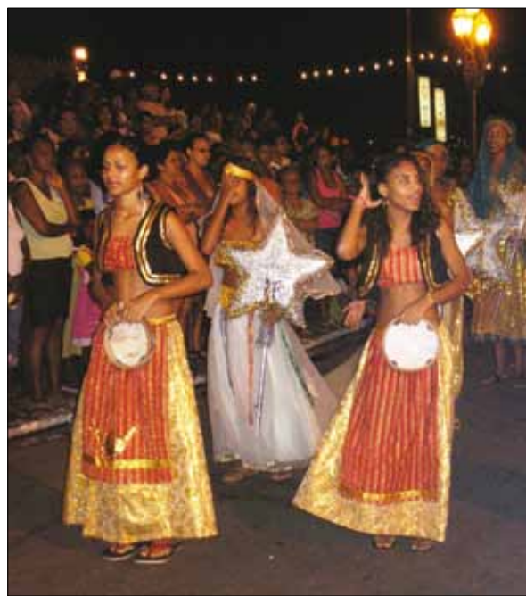
Ternos de Reis - Fotos: Edilece Couto, 2009.

eclesiásticas –, mas isto não significa que não seja uma festa católica. “É uma coisa do católico, pois no centro está o louvor ao Menino Jesus”. O fundamento da festa corresponde às narrativas bíblicas sobre a infância de Jesus, nos Evangelhos de Lucas e Mateus. Todas as alegorias são criadas a partir de reinterpretações desta tradição. Também participam dos ternos pessoas que seguem o catolicismo e o candomblé, não sendo considerado problemática essa interseção pelos dirigentes dos ternos, “contanto que, na hora do terno, seja uma coisa do Menino Jesus, porque são religiões diferentes”.