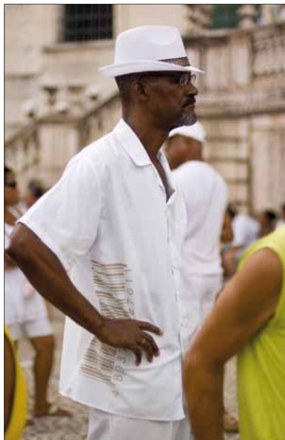
Festa do Bonfim – Foto: Marcelo Reis, 2010.

Há anos, os trios não saem mais no dia da Lavagem, e aqueles que querem se distrair no mês de janeiro têm outras ocasiões, como o Bonfim Light e a festa de Carlinhos Brown (que antes formava logo após o Gandhi), no mesmo dia, e dezenas de shows em que quase só se vêem pessoas mais claras, escolarizadas e com os bolsos cheios de fichas e cartões eletrônicos.