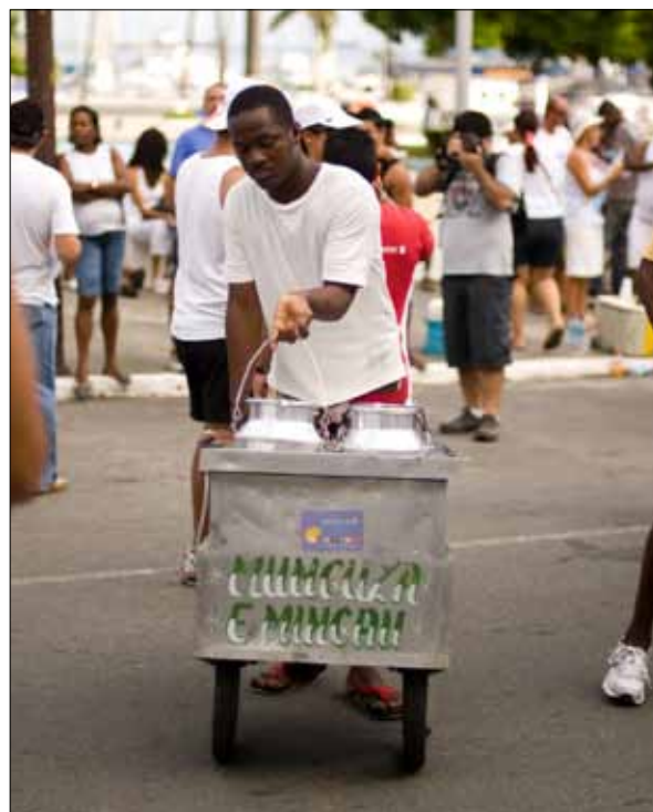
Vendedor de mingau – Foto: Marcelo Reis, 2010.