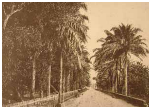
Av. Dendezeiros. FERREZ, Gilberto. Bahia: velhas fotografias.

Em 1798, a Devoção construiu a estrada (atual avenida) dos Dendezeiros, drenando o brejo que esta atravessava, com a utilização de uma espécie de palmeira (dendezeiros), capaz de secar terrenos alagadiços.