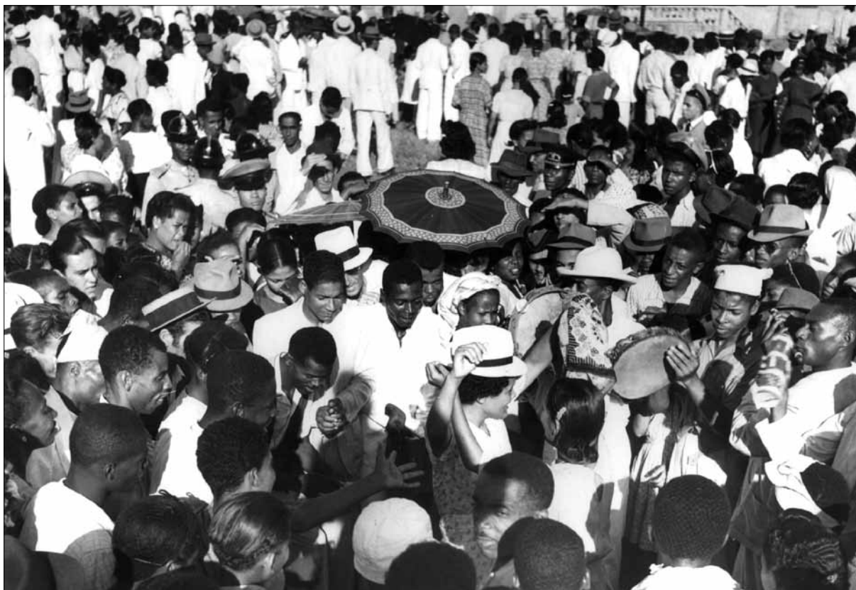
Festa do Bonfim – Foto: Voltaire Fraga, 1950.

Dois anos depois, em 1938, faria sucesso Na Baixa do Sapateiro , também pela voz da pequena notável . O Senhor do Bonfim é o fiador de um amor inesquecível e pode fazer voltar a sorrir alguém que perdeu de vista sua amada.