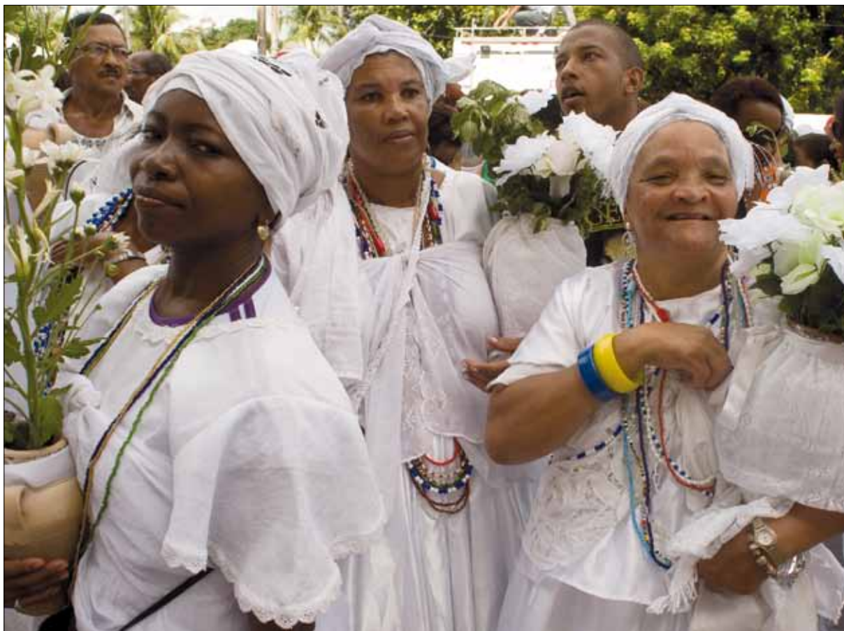
Baianas na Festa do Bonfim

O que parece mais interessante é ver como a Lavagem do Bonfim vem-se tornando, cada vez mais, uma festa de massas. Arrefeceu-se o caráter comunitário, diminuiu consideravelmente o número das pessoas com as cadeiras às portas, as famílias recebendo uma porção de amigos, parentes, conhecidos para comer feijoadada, os passeios das famílias pelas barracas. A Bahia de Jorge Amado, Dorival Caymmi, Carybé e Pierre Verger, em que a convivialidade baseada na proximidade e na interação constante pela conversa e pelo contato direto, deu lugar a uma cidade de três milhões de habitantes em que o conhecimento é muito mais mediatizado, inclusive os contatos humanos. O que temos agora é uma cidade que faz festas de massas. Nessas festas, os indivíduos e grupos descobrem ou inventam estratégias de se identificar, de não se perder.