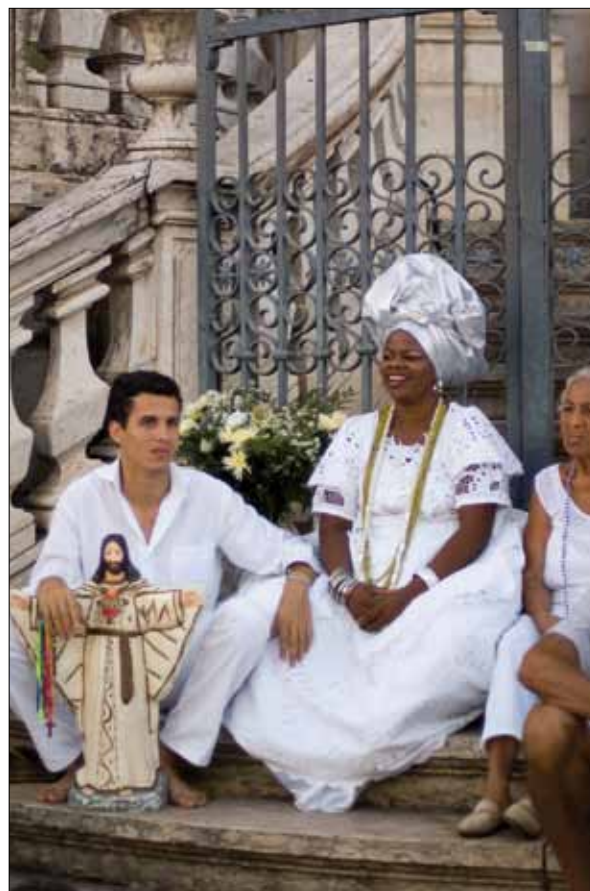
Devotos à espera do Cortejo – Foto: Marcelo Reis, 2010.

Tem torço de seda, tem Tem brincos de ouro, tem Corrente de ouro, tem Tem pano da Costa, tem Tem saia engomada, tem Sandália enfeitada, tem E tem graça como ninguém Como ela requebra bem