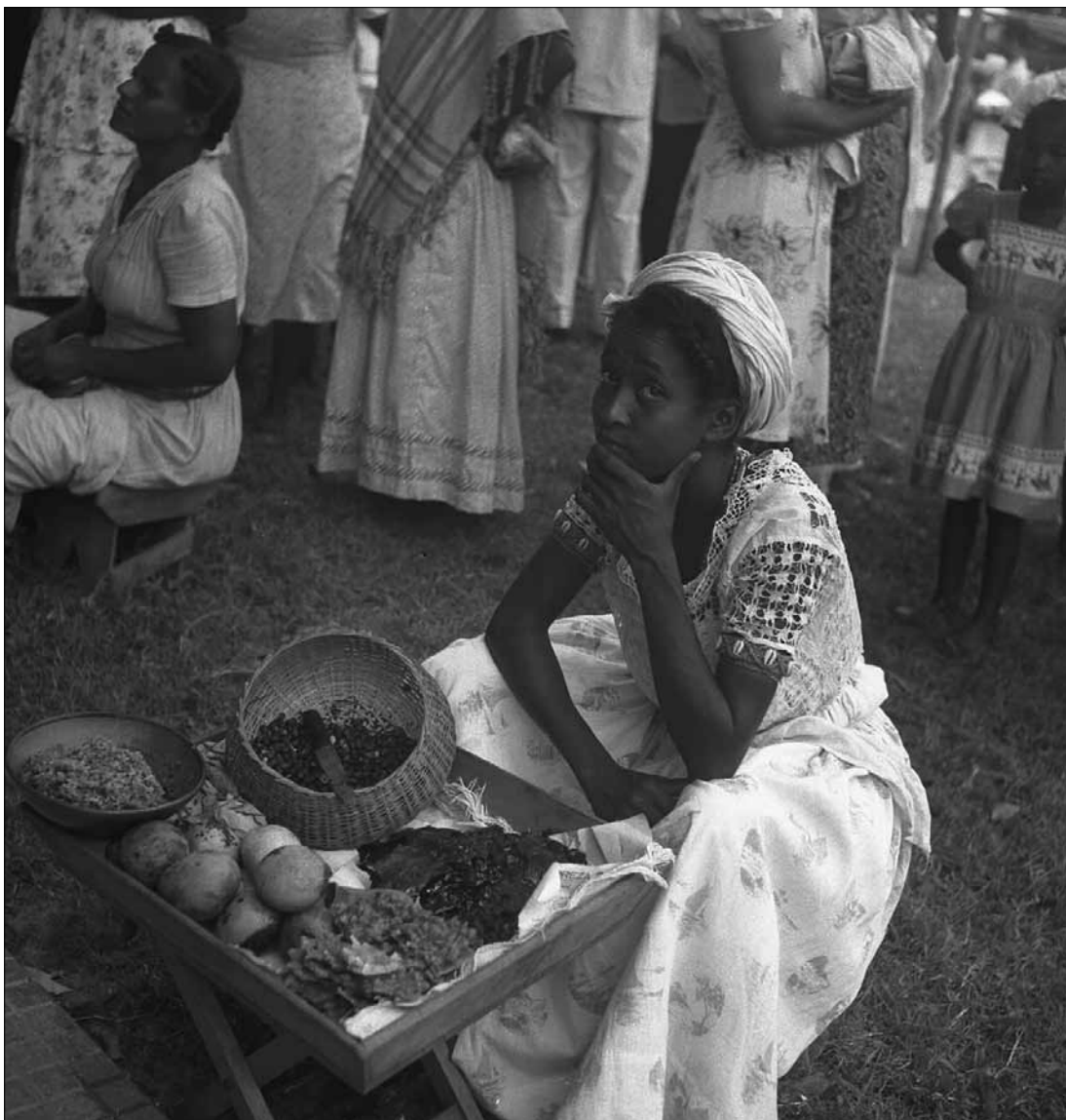
Baiana na Festa do Bonfim – Foto: Pierre Verger, 1947.

Inúmeros outros compositores e intérpretes contribuíram para construir a lenda do nome da Bahia no cancionário nacional. Aos efeitos deste dossiê, trata-se de sublinhar a presença da menção ao Bonfim neste contexto.