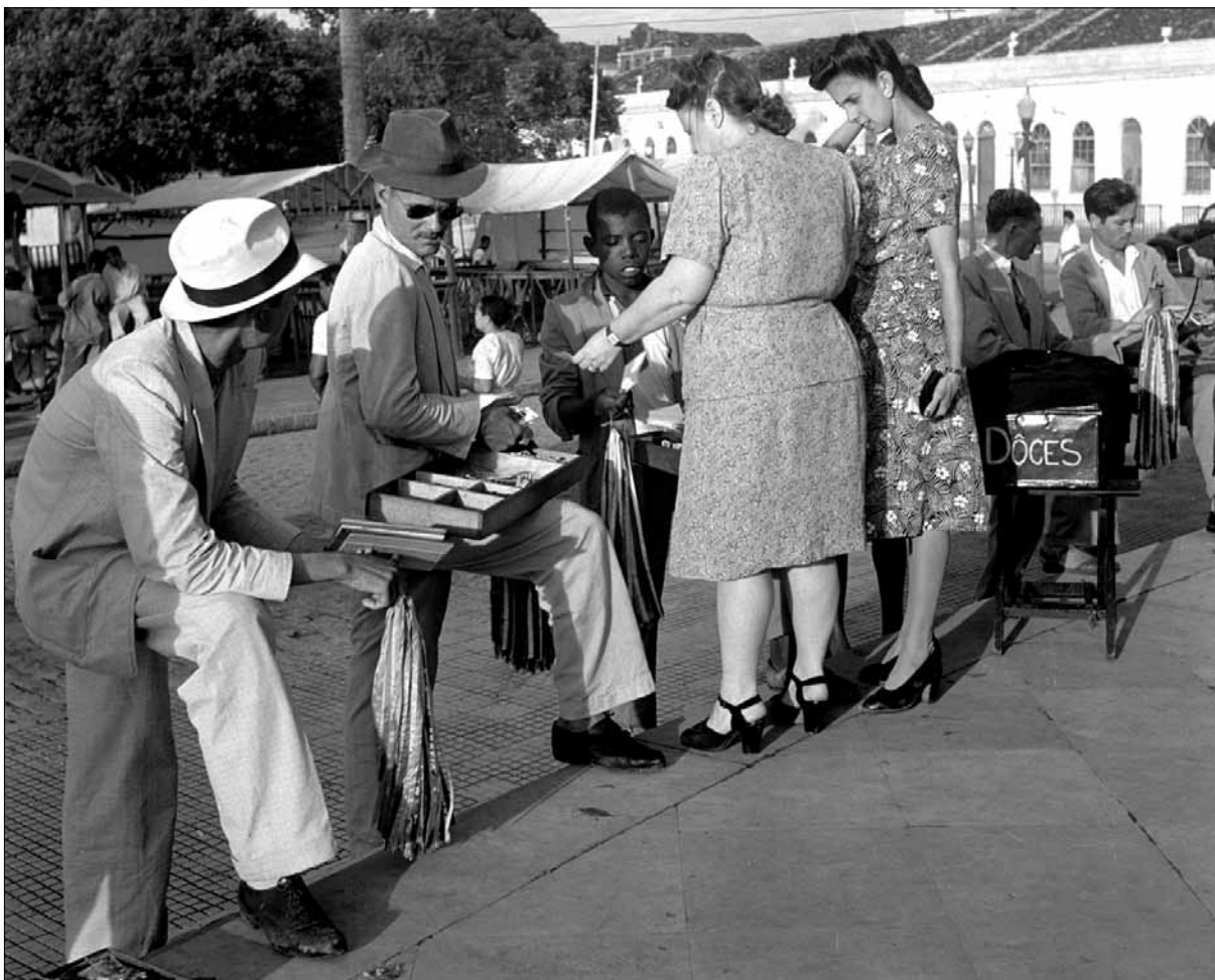
Vendedor de fitas do Bonfim – Foto: Pierre Verger, 1959.

marcador de livros, como também em bolsas e carteiras de cédulas, como proteção e relíquia. 30