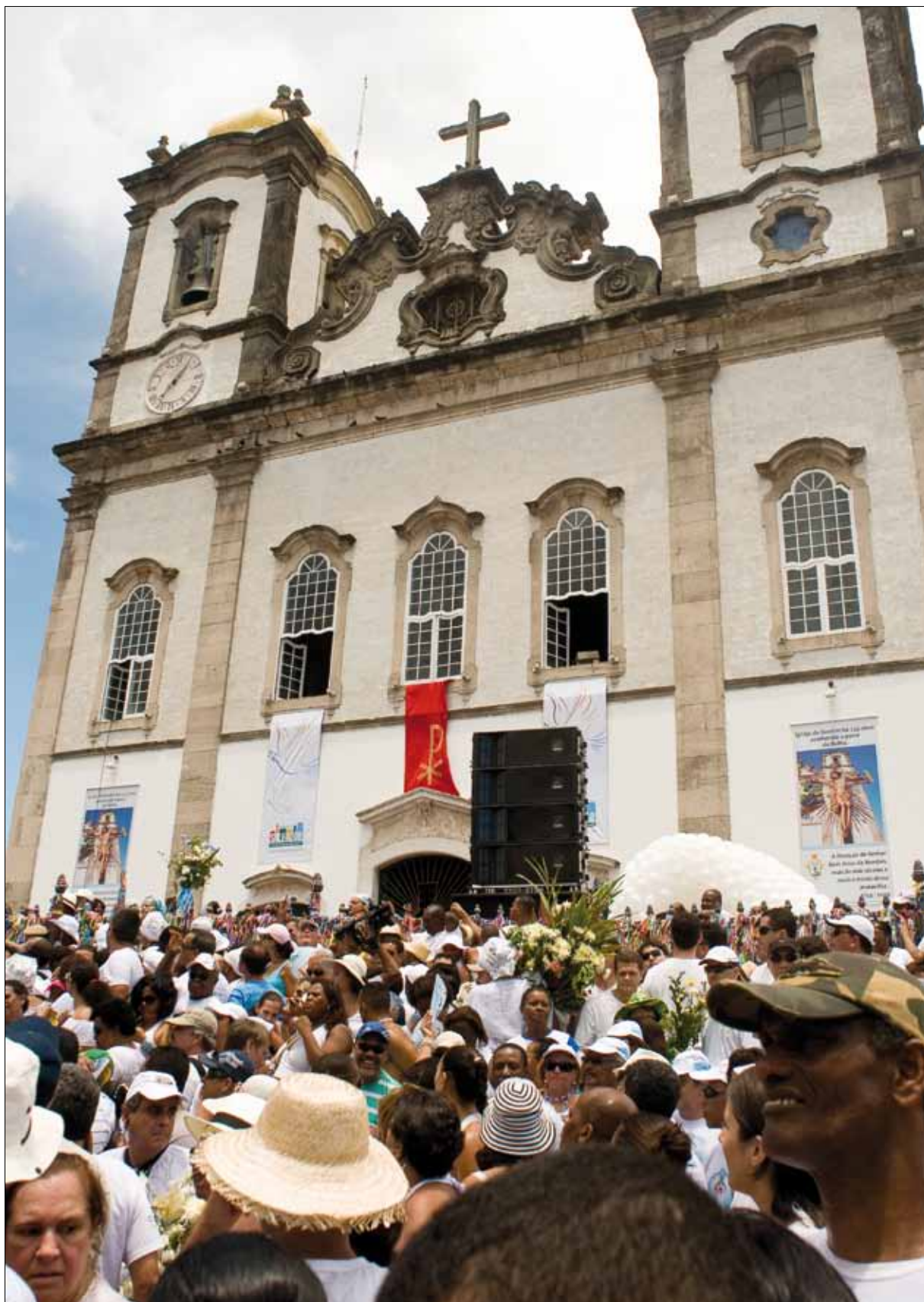
Igreja do Bonfim – Foto: Marcelo Reis, 2010.