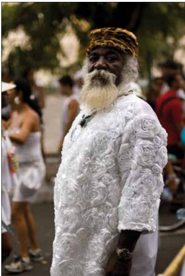
Festa do Bonfim – Foto: Marcelo Reis, 2010.