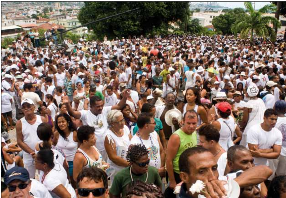
Cortejo do Bonfim – Foto: Marcelo Reis, 2010.

puxada por jegues, como era comum à época. Puxada por quatro cavalos brancos, a carruagem era conduzida por dois negros vestidos de sobrecasacas verdes e calções de veludo ornamentados de prata, polainas, gravatas e luvas. 46