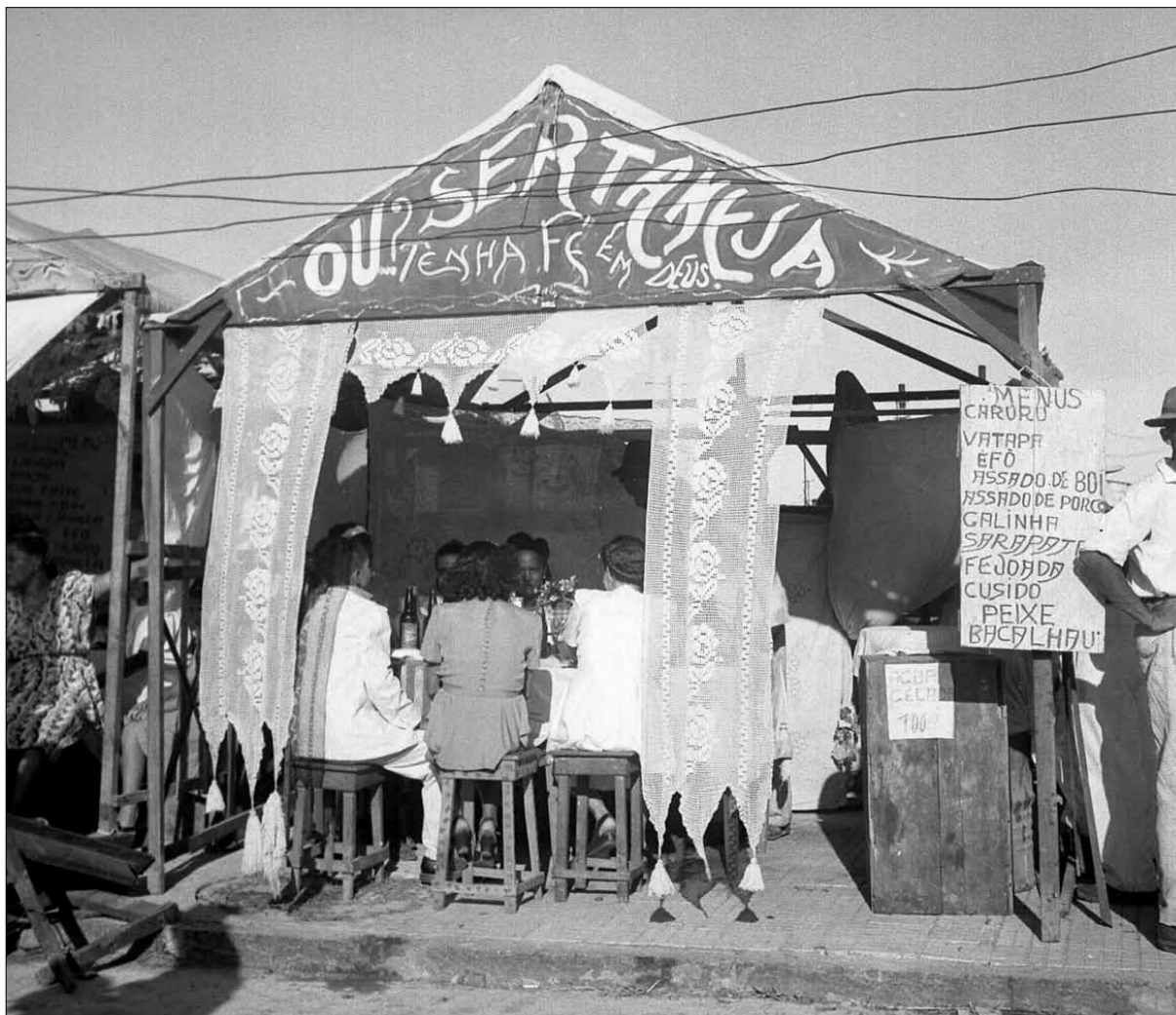
Barraca na Festa do Bonfim – Foto: Pierre Verger, 1947.

caminho, foram ficando pessoas que não aguentaram perfazer todo o trajeto, ou que não podem se demorar até tarde da noite. Pequenos grupos foram-se nuclearizando na subida da Água Brusca, em alguma casa de amigos próxima ao Largo de Roma, em um bar do Dendezeiros. As carroças e caminhões vão-se recolhendo.