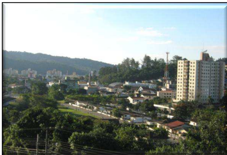
Vista parcial do bairro Garcia