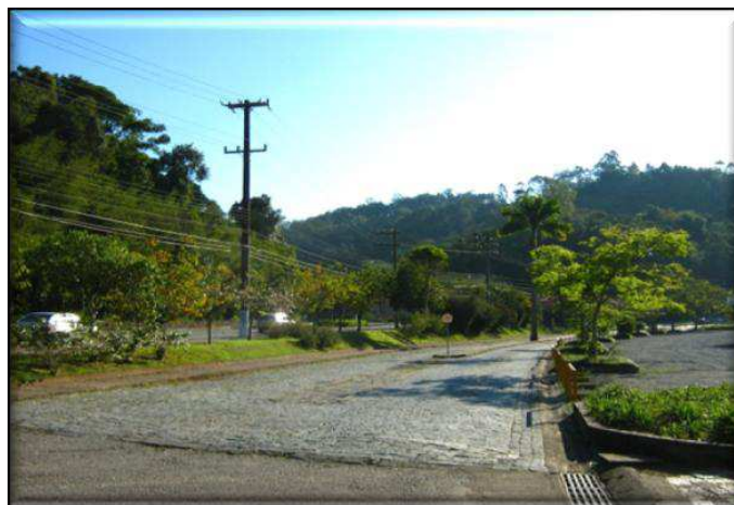
Vista parcial do Bairro Bom Retiro

Nas transversais e demais vias do bairro, a ocupação é predominantemente residencial, onde há edificações que expressam opulência decorrente do desenvolvimento econômico da região. O Bom Retiro possui ligação com o bairro da Velha, através da rua Bruno Hering ao Oeste e, ao Centro a Leste, pelas ruas Victor Hering e Hermann Hering - todas com intenso tráfego de veículos.