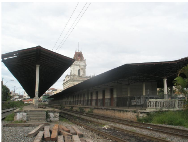
Foto 02 – Vista da estação com a plataforma de embarque. Data: 14/01/2009