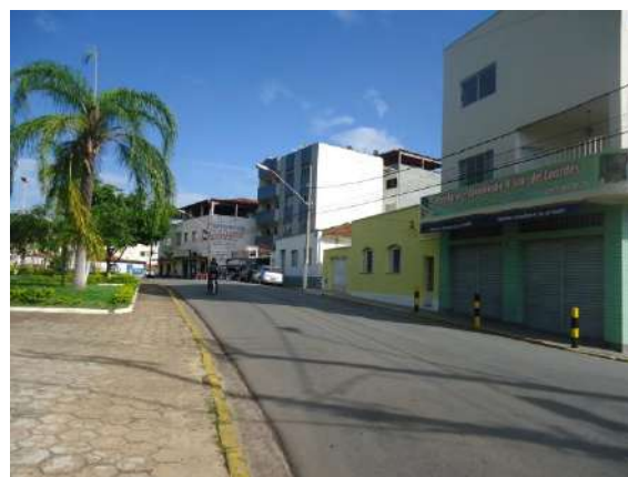
Pará de Minas