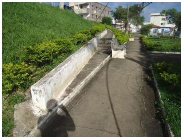
Pará de Minas Gruta de Nossa Senhora de Lourdes Rampa que conecta os dois níveis da Praça exibe dois conjuntos de degraus que impossibilitam a acessibilidade. (foto 22) 30/11/2018