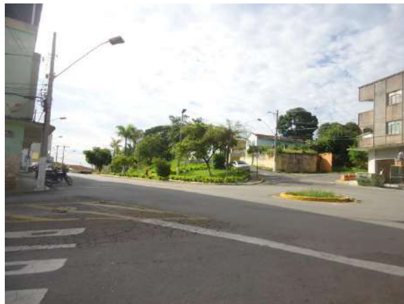
Pará de Minas Gruta de Nossa Senhora de Lourdes Variedade de volumetria na Rua Fernando Torquato. (foto 31)