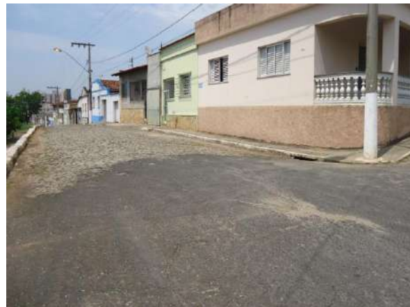
Pará de Minas