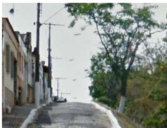
Pará de Minas Gruta de Nossa Senhora de Lourdes Via Francisco Valadares em pé de moleque exibindo vários remendos em asfalto. (foto 03)