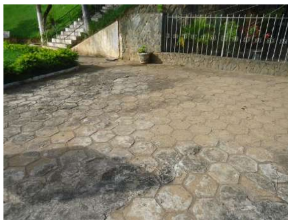
Pará de Minas

Gruta de Nossa Senhora de Lourdes Cimentados da Praça Francisco Valadares apresentam apenas algumas fissuras e pequeno acúmulo de terra. (foto 18)