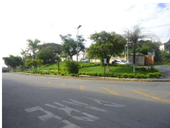
Pará de Minas Gruta de Nossa Senhora de Lourdes Camada asfáltica em frente à Gruta em bom estado de conservação. (foto 02)