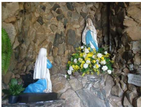
Pará de Minas Gruta de Nossa Senhora de Lourdes Nossa Senhora de Lourdes e Santa Bernadete Soubirous fonte da devoção e piedade dos fiéis pelo local. (foto 35)