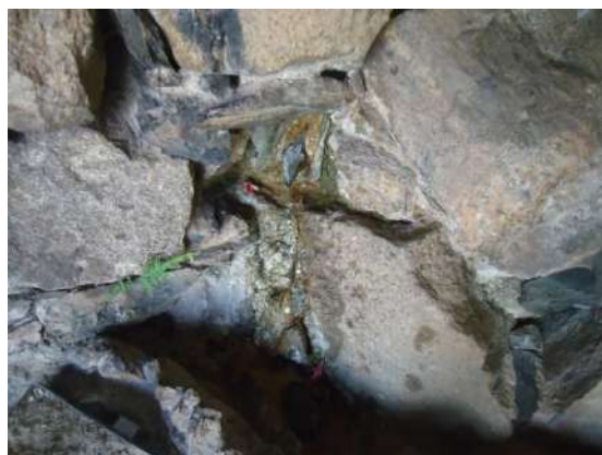
Pará de Minas