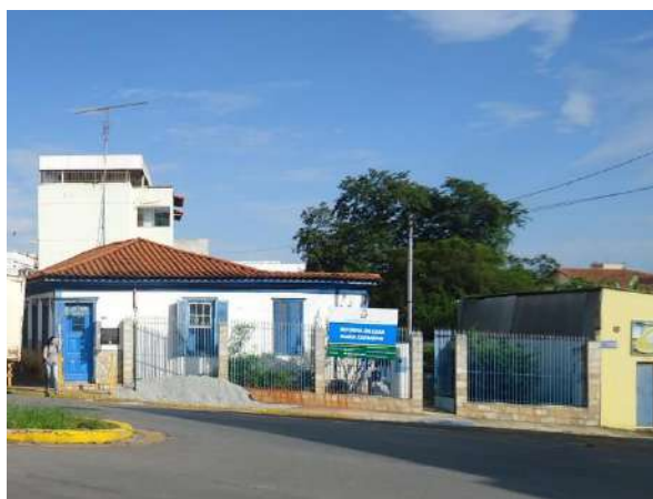
Pará de Minas Gruta de Nossa Senhora de Lourdes A Casa Maria Capanema (Bem tombado) em estilo colonial na Rua Joaquim Peregrino. (foto 32)