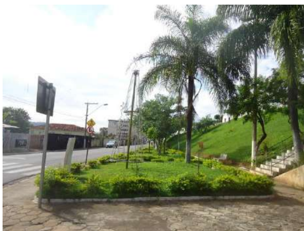
Pará de Minas Gruta de Nossa Senhora de Lourdes Área central da Praça Francisco Valadares exibindo áreas ajardinadas geometrizadas de influência francesa. (foto 36) Imagem: Álisson Margotti – 30/11/2018