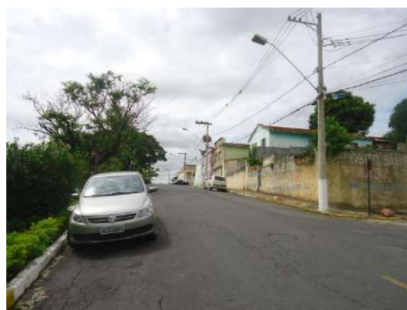
Pará de Minas Gruta de Nossa Senhora de Lourdes A via Fernando Otávio também não apresenta arborização fora do perímetro da Praça. (foto 13)