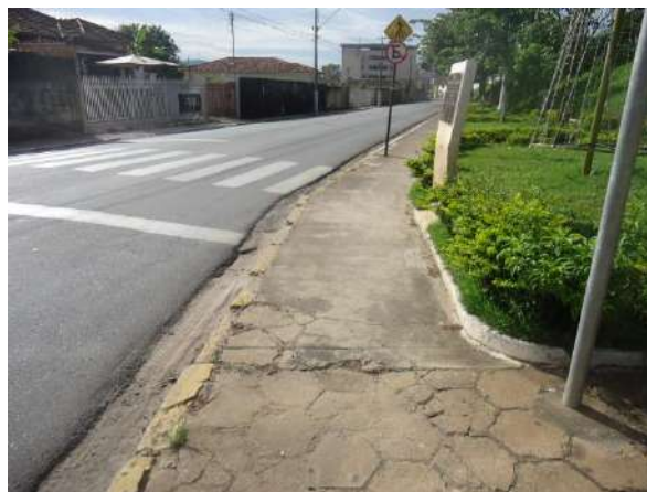
Pará de Minas Gruta de Nossa Senhora de Lourdes Sarjeta na via Praça Francisco Valadares em bom estado de conservação e sem sujidades. (foto 09)