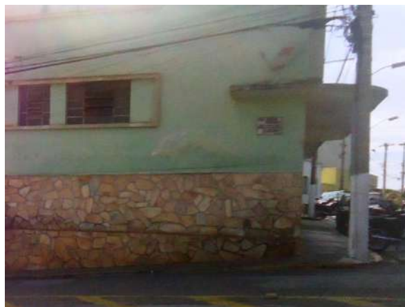
Pará de Minas Gruta de Nossa Senhora de Lourdes Placa de logradouro em bom estado de conservação na Praça Francisco Valadares. (foto 07)