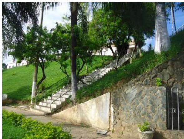
Pará de Minas Gruta de Nossa Senhora de Lourdes Escadaria que conecta a Rua Fernando Otávio com a via Praça Francisco Valadares em bom estado de conservação. (foto 20) Imagem: Álisson Margotti – 30/11/2018