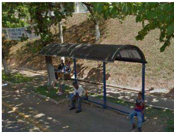
Pará de Minas Gruta de Nossa Senhora de Lourdes Parada de ônibus com abrigo em bom estado de conservação exibindo apenas desgaste da camada pictórica em seu assento. (foto 26)