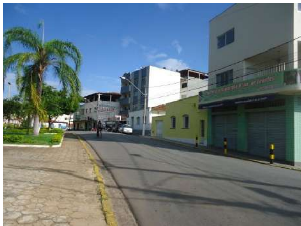
Pará de Minas Gruta de Nossa Senhora de Lourdes Placas e pinturas comerciais em frente à Gruta Nossa Senhora de Lourdes. (foto 27)