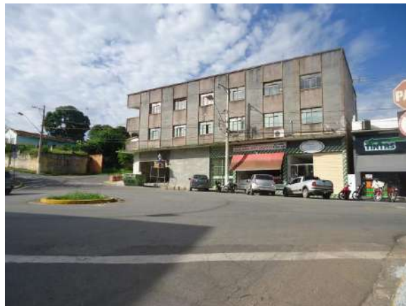
Pará de Minas Gruta de Nossa Senhora de Lourdes Placas comerciais de grandes dimensões no entorno imediato da Praça Francisco Valadares. (foto 28)