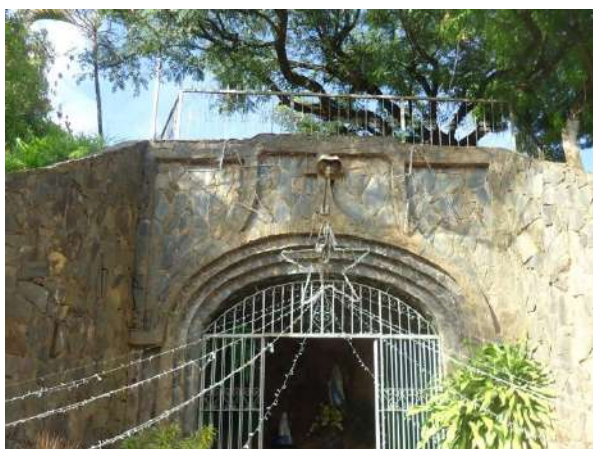
Pará de Minas Gruta de Nossa Senhora de Lourdes Portada ornamentada no único acesso à Gruta Nossa Senhora de Lourdes e guarda-corpo do terraço. (foto 40)