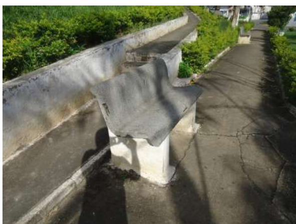
Pará de Minas