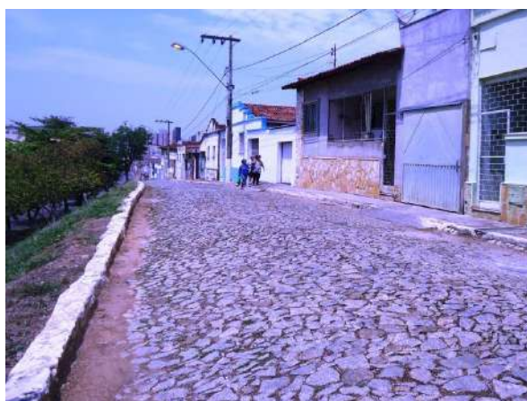
Pará de Minas Gruta de Nossa Senhora de Lourdes Aspecto da via Praça Francisco Valadares que apresenta Pequeno fluxo de veículos. (foto16)