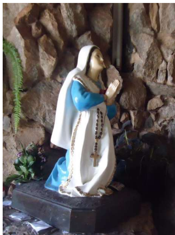
Pará de Minas Gruta de Nossa Senhora de Lourdes Santa Bernadete Soubirous presenciou as aparições de Maria em Lourdes na França. (foto 45)