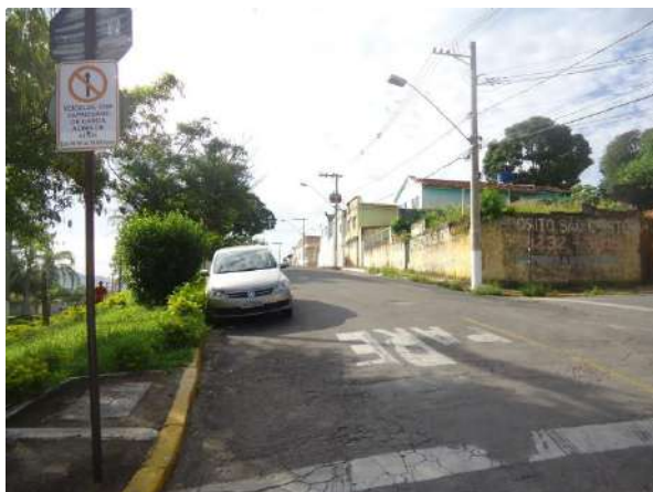
Pará de Minas Gruta de Nossa Senhora de Lourdes Placas de trânsito e informativas em bom estado de conservação na Praça Francisco Valadares. (foto 06)