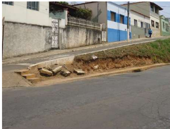
Pará de Minas Gruta de Nossa Senhora de Lourdes Via Praça Francisco Valadares exibindo via sem sarjetas ou boca de lobo. (foto 11)