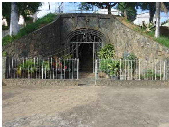
Pará de Minas Gruta de Nossa Senhora de Lourdes Grade que faz fechamento e cria pequeno hall aberto em frente à Gruta de Nossa Senhora de Lourdes. (foto 39)