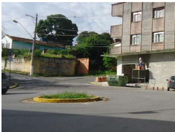
Pará de Minas Gruta de Nossa Senhora de Lourdes A única faixa de pedestre da Praça, na via Praça Francisco Valadares, não apresenta rampas de acessibilidade. (foto 21) Imagem: Álisson Margotti – 30/11/2018