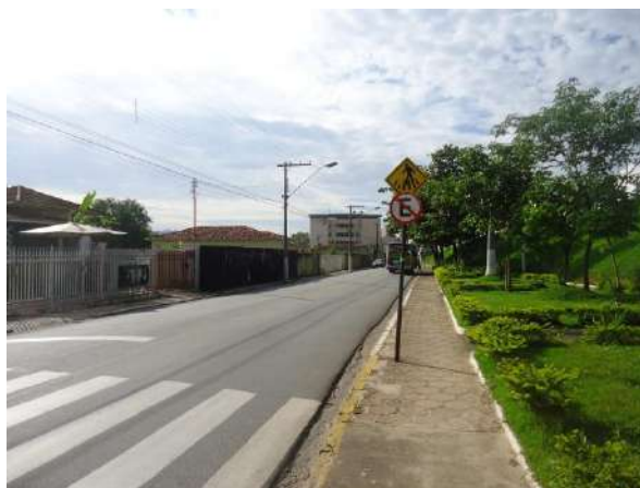
Pará de Minas Gruta de Nossa Senhora de Lourdes Fiação aparente em todo o entorno da Praça Francisco Valadares. (foto 29)