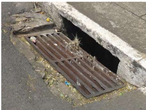
Pará de Minas Gruta de Nossa Senhora de Lourdes Boca de lobo na Rua Fernando Otávio em bom estado, mas exibindo acúmulo de folhas, terra e lixo. (foto 08)