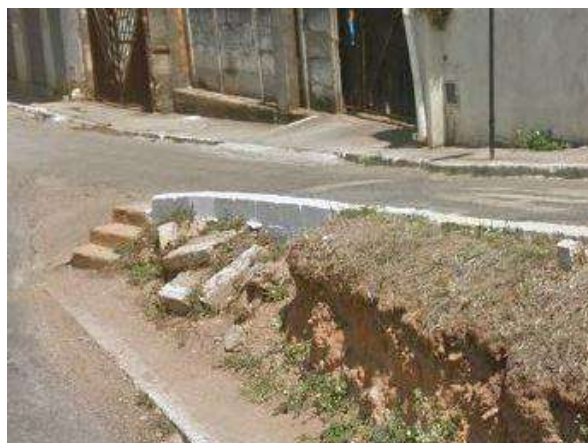
Pará de Minas Gruta de Nossa Senhora de Lourdes Extremo sul da Praça Francisco Valadares onde a cobertura necessita de intervenção. (foto 34)