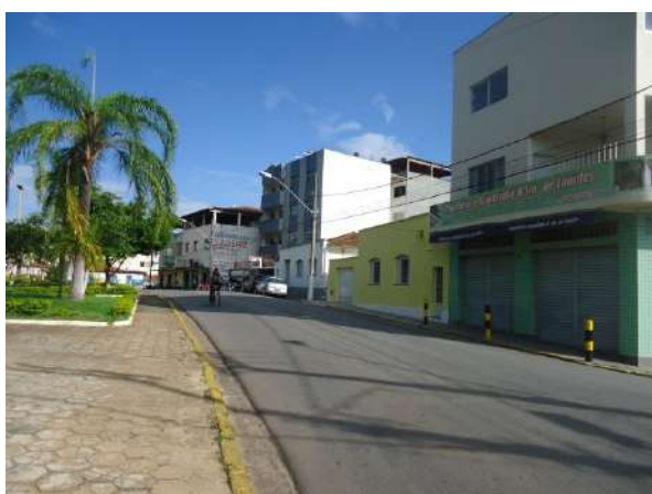
Pará de Minas Gruta de Nossa Senhora de Lourdes Via Praça Francisco Valadares não apresenta arborização fora do perímetro da Praça Francisco Valadares. (foto 12)