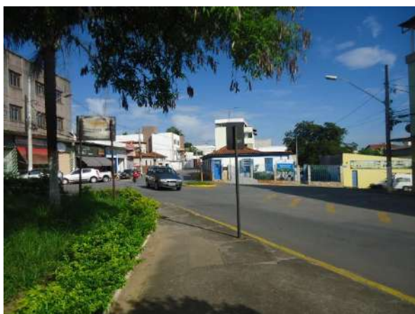
Pará de Minas

Gruta de Nossa Senhora de Lourdes Piso cimentado na Rua Fernando Otávio em bom estado, mas sem nenhuma rampa que ofereça acessibilidade. (foto 17)