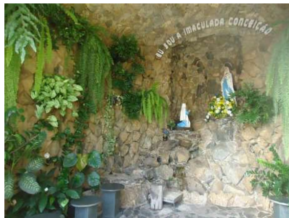
Pará de Minas Gruta de Nossa Senhora de Lourdes Imagem de Nossa Senhora de Lourdes, que dá nome à Gruta e de santa Bernadete Soubirous. (foto 43)