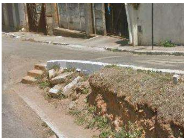
Pará de Minas Gruta de Nossa Senhora de Lourdes Extremo sul da Praça Francisco Valadares, desnível sem cobertura causa acúmulo de terra na sarjeta. (foto 10)