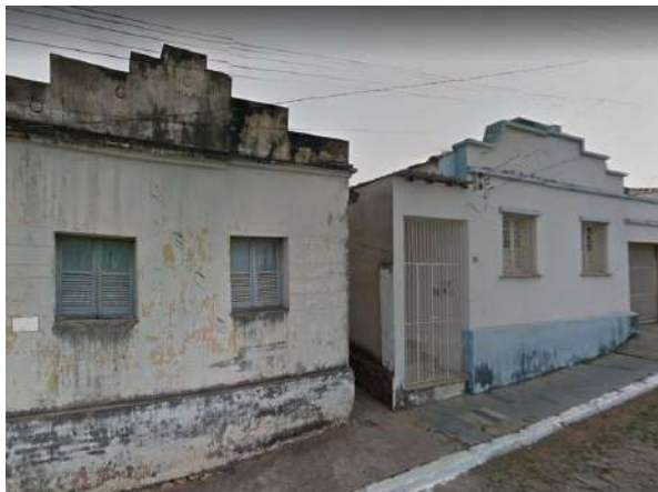
Pará de Minas Gruta de Nossa Senhora de Lourdes Edificações art-déco na testada dos lotes e com pouco ou nenhum afastamento lateral na via Pç. Francisco Valadares. (foto 30)