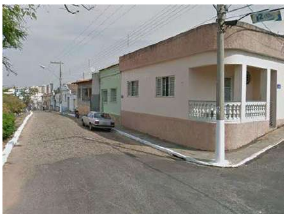
Pará de Minas