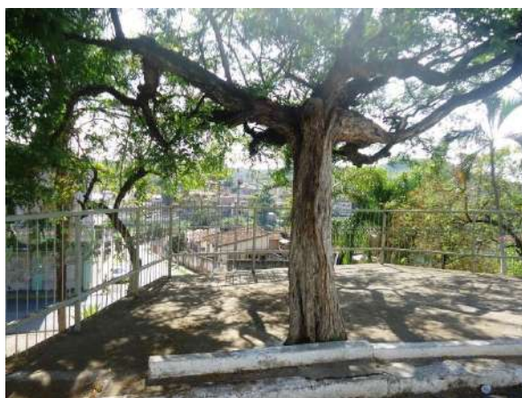
Pará de Minas