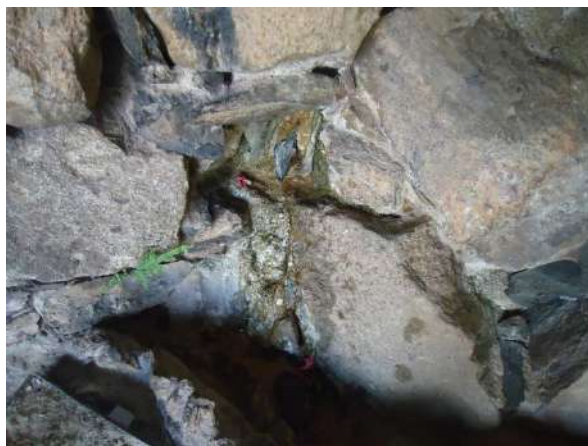
Pará de Minas Gruta de Nossa Senhora de Lourdes A quase extinta fonte no interior da Gruta. (foto 46)