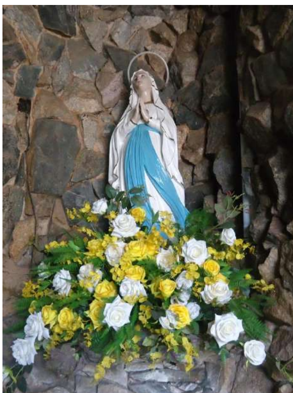
Pará de Minas Gruta de Nossa Senhora de Lourdes Imagem de Nossa Senhora de Lourdes retratando sua aparição na França em 1958. (foto 44)