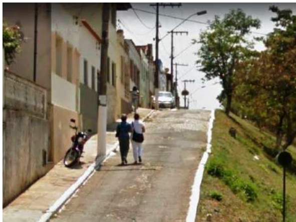
Pará de Minas