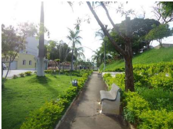
Pará de Minas Gruta de Nossa Senhora de Lourdes Gramíneas, arbustos e árvores de médio e grande porte conformam a cobertura vegetal da Praça Francisco Valadares. (foto 33)