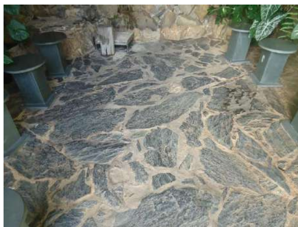
Pará de Minas Gruta de Nossa Senhora de Lourdes Piso interno em pedra bruta e bancos em ardósia no bem tombado. (foto 41)