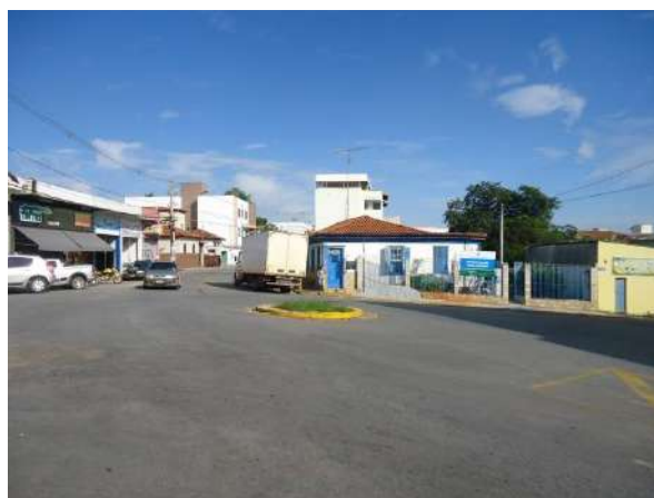
Pará de Minas Gruta de Nossa Senhora de Lourdes Trânsito geralmente intenso na Praça Francisco Valadares sentido Centro-bairro. (foto 15)