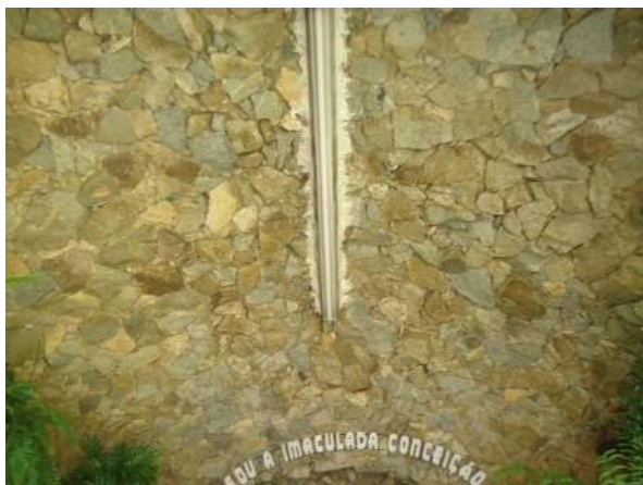
Pará de Minas Gruta de Nossa Senhora de Lourdes Teto da Gruta em pedra bruta e cimento. (foto 42)