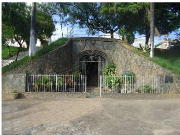
Pará de Minas Gruta de Nossa Senhora de Lourdes Fachada frontal da Gruta Nossa Senhora de Lourdes implantada em declive natural do terreno. (foto 38)