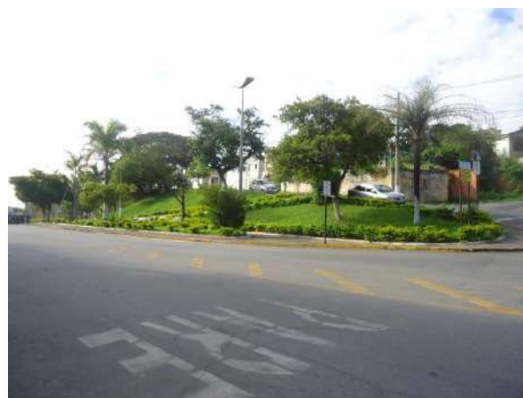
Pará de Minas Gruta de Nossa Senhora de Lourdes Área norte da Praça Francisco Valadares e seus jardins típicos do paisagismo francês. (foto 37) Imagem: Álisson Margotti – 30/11/2018