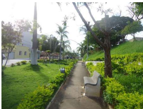
Pará de Minas Gruta de Nossa Senhora de Lourdes Praça Francisco Valadares exibindo bancos, postes e placas em bom estado de conservação. (foto 47)