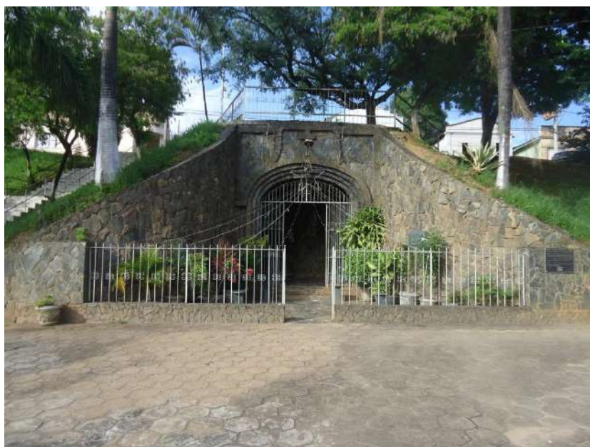
Pará de Minas Gruta de Nossa Senhora de Lourdes Fachada Frontal (foto 01)