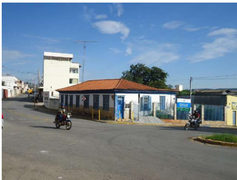
Pará de Minas Casa Maria Capanema Fachada Frontal e lateral Direita da edificação. (Foto 01)