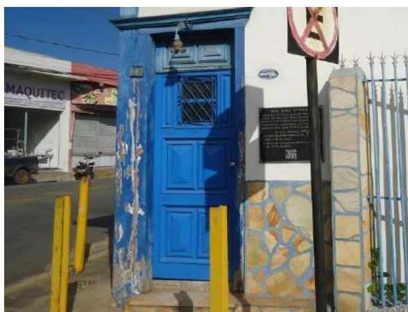
Pará de Minas Casa Maria Capanema Madeira apresentando desprendimento da camada pictórica, ressecamento e perda de material (Foto 13)