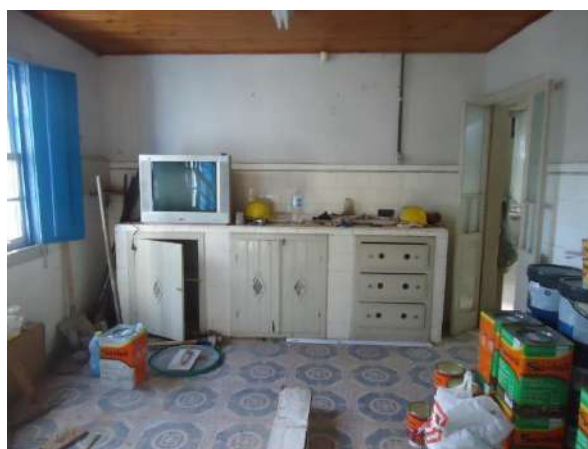
Pará de Minas Casa Maria Capanema

Cerâmicas nas paredes e bancadas da copa exibem bom estado de conservação mas necessita de limpeza.