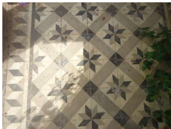
Pará de Minas Casa Maria Capanema Detalhe do ladrilho do alpendre na lateral esquerda e que dá acesso ao interior do bem em bom estado. (foto 39)