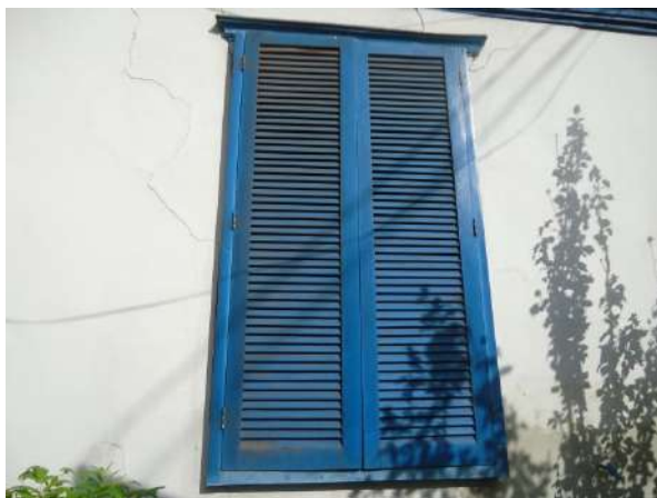
Pará de Minas Casa Maria Capanema Janela italiana em guilhotina em madeira e vidro e grade em metal exibe ressecamento e perda de material. (foto 33)