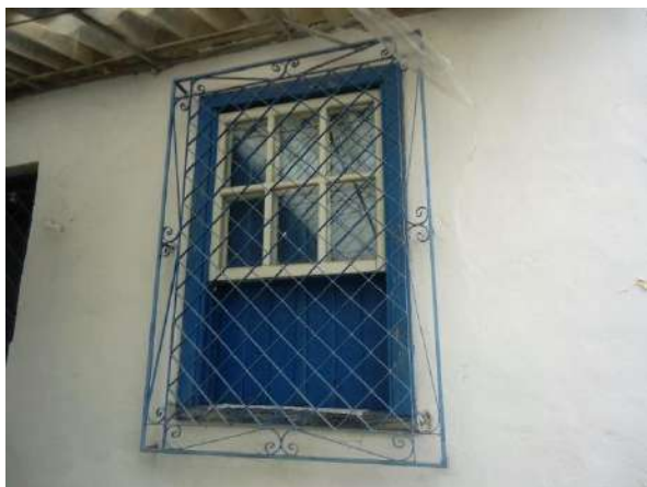
Pará de Minas Casa Maria Capanema Janela guilhotina em madeira e vidro e grade em metal em bom estado nos fundos da edificação. (foto 31)