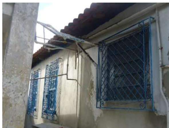
Pará de Minas Casa Maria Capanema Janelas em basculante em metal e vidro e grade na fachada lateral esquerda e a menor na posterior. (foto 32)