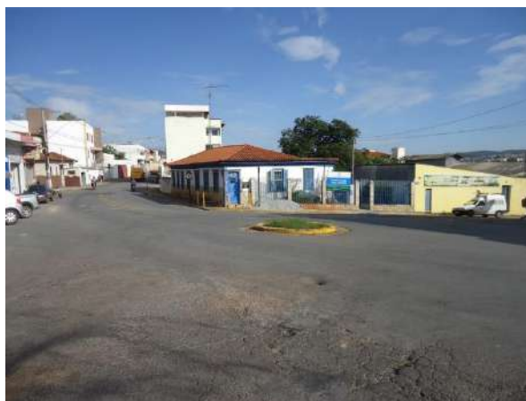
Pará de Minas Casa Maria Capanema A movimentada via Rua Melo Guimarães principal acesso à região norte de pará de Minas. (foto 56)