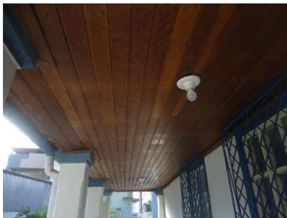
Pará de Minas Casa Maria Capanema Forro da varanda apresentando desprendimento, umidade e áreas ressecadas.