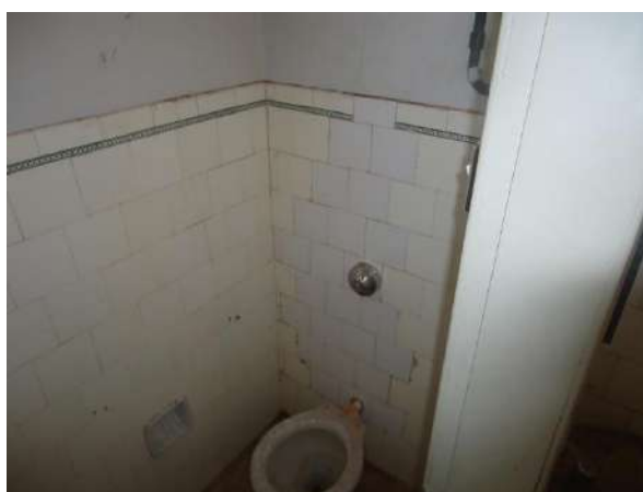
Pará de Minas Casa Maria Capanema Instalação hidráulica necessitando de reparos. (foto 54)