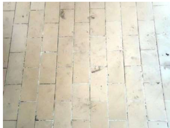
Pará de Minas