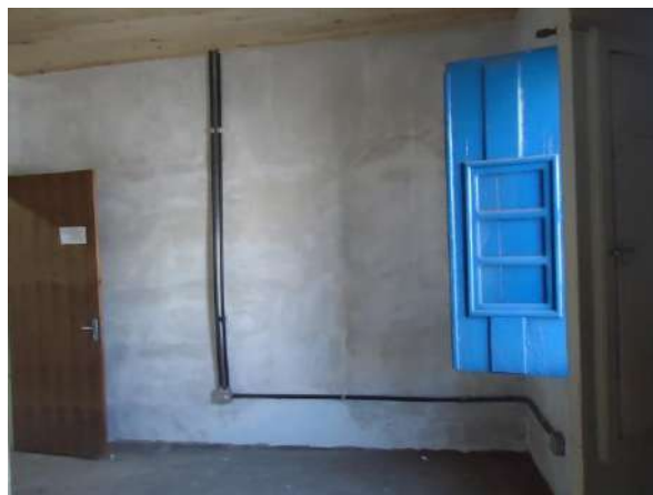
Pará de Minas Casa Maria Capanema

Pintura à base de água na parte superior das paredes internas da edificação em bom estado de conservação.