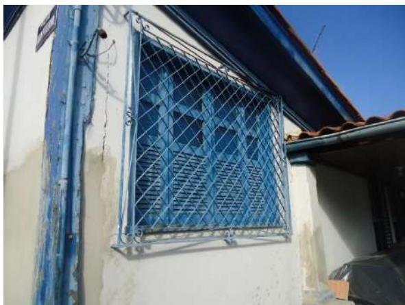
Pará de Minas Casa Maria Capanema

Janela francesa em madeira e vidro na lateral esquerda apresenta ressecamentos e desgastes da pintura. (foto 29)