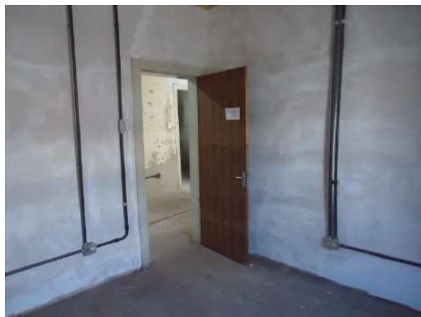
Pará de Minas Casa Maria Capanema Instalação irregular de muitos fios em uma mesma canaleta é um ator de risco para a antiga edificação. (foto 52)