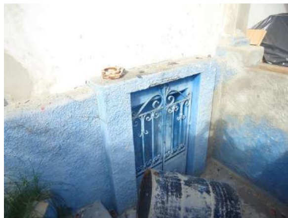
Pará de Minas