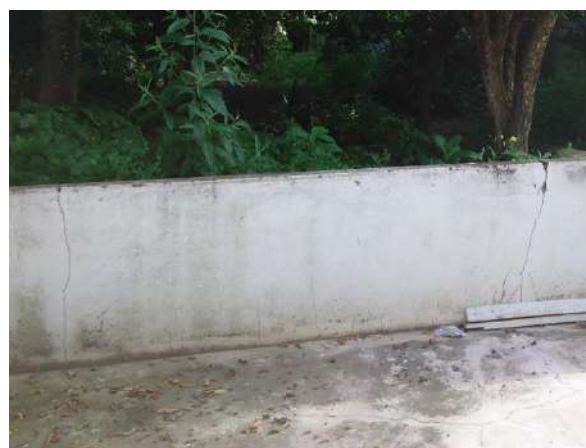
Pará de Minas Casa Maria Capanema Guarda corpo que divide a área cimentada da área de terra apresenta algumas fissuras.