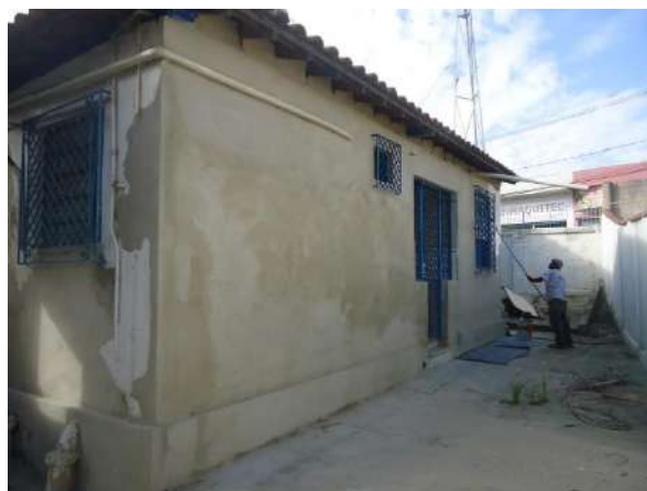
Pará de Minas Casa Maria Capanema Fachada posterior da Casa Maria Capanema (foto 05)