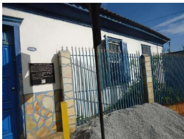
Pará de Minas Casa Maria Capanema

Gradil em bom estado de conservação, necessita de renovação da camada pictórica.