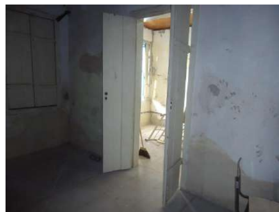
Pará de Minas Casa Maria Capanema

Protegida das ações das intempéries estas portas em madeira exibem bom estado de conservação.