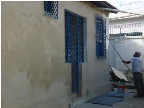
Pará de Minas Casa Maria Capanema

Ferragens em bom estado de conservação em fechamentos da fachada posterior do bem. (foto 27)