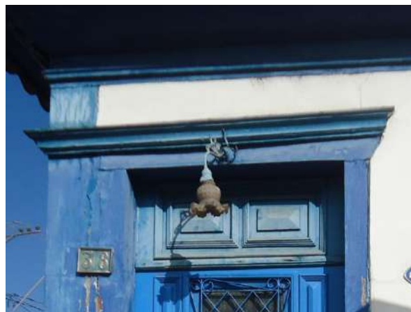
Pará de Minas Casa Maria Capanema Sobreverga em madeira exibe ressecamento e desgaste da camada pictórica. (foto 34)