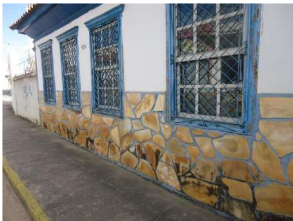
Pará de Minas Casa Maria Capanema

Pintura à óleo na fachada frontal da edificação exibe desgaste e desprendimento da camada pictórica.