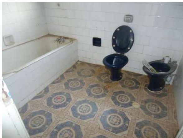
Pará de Minas Casa Maria Capanema Mesmo as peças mais antigas do sistema hidráulico ainda apresentam bom estado de conservação. (foto 53)