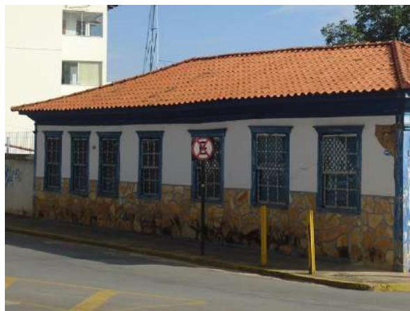
Pará de Minas Casa Maria Capanema Fachada lateral direita da Casa Maria Capanema (foto 03)