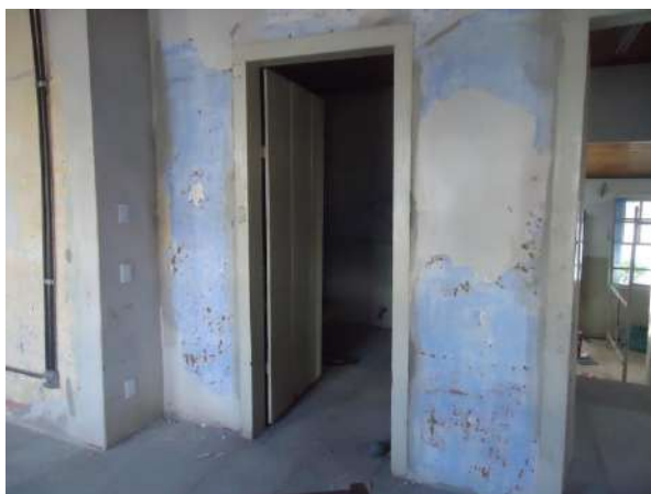
Pará de Minas Casa Maria Capanema Reboco interno apresentando algumas trincas em sua superfície. (foto 14)