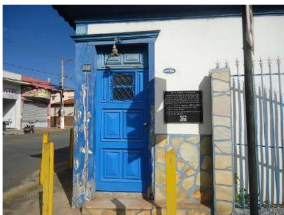
Pará de Minas Casa Maria Capanema

Porta em madeira na fachada frontal exibindo bom estado, já foi restaurada.