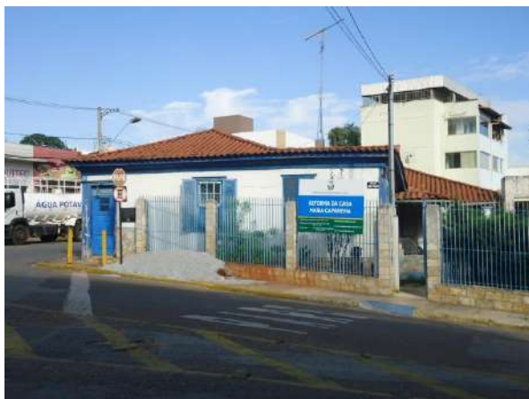
Pará de Minas Casa Maria Capanema Fachada Frontal da edificação. (foto 02)