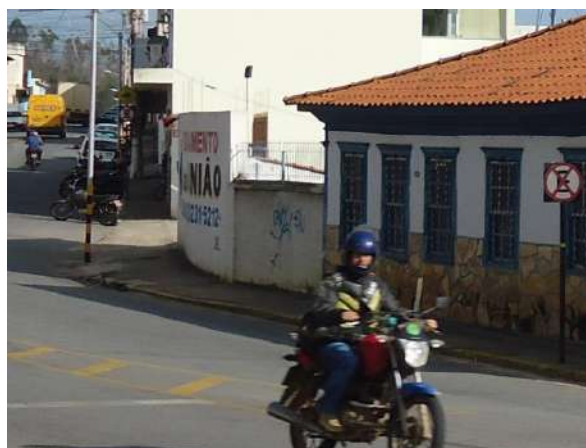
Pará de Minas Casa Maria Capanema

O muro apresenta boas condições físicas, mas exhibe sujidades generalizadas e pichação.