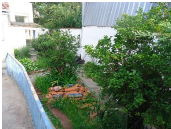
Pará de Minas