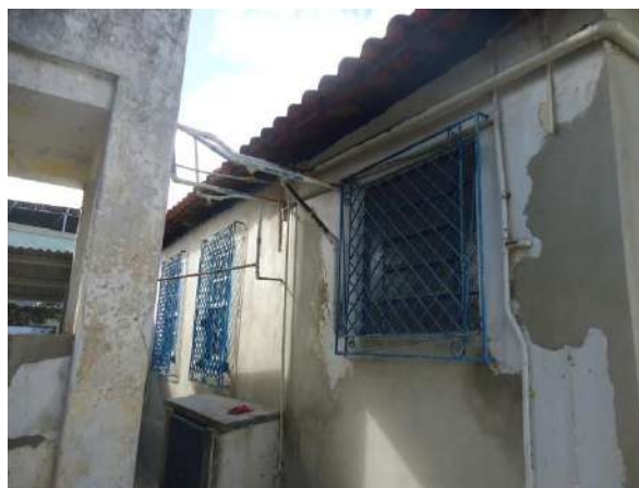
Pará de Minas Casa Maria Capanema Caiação na área externa da edificação apresenta desgastes, sujidades e manchas de umidade. (foto 15)