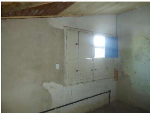
Pará de Minas Casa Maria Capanema Paredes em tijolos autoportantes apresentando intervenções. (foto 06)