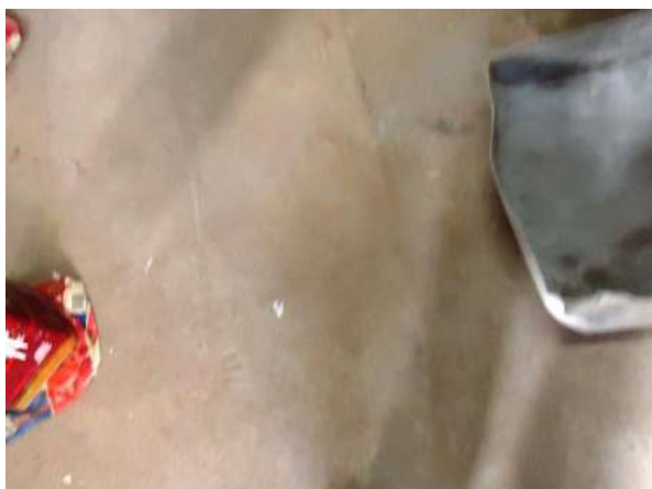
Pará de Minas Casa Maria Capanema Detalhe de área de laje de piso onde será assentado piso de madeira. (foto 40)