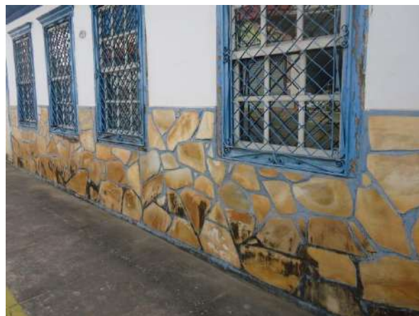
Pará de Minas Casa Maria Capanema Barrado em pedra ouro preto na fachada frontal do bem em estado de conservação mas necessita de limpeza. (foto 21)