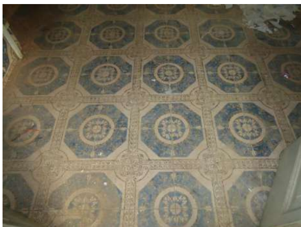
Pará de Minas Casa Maria Capanema Ladrilho comum a copa, cozinha e banheiro em bom estado de conservação. (foto 38)