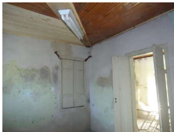
Pará de Minas Casa Maria Capanema Forro com área refeita necessitando apenas de verniz para sua finalização. (foto 44)