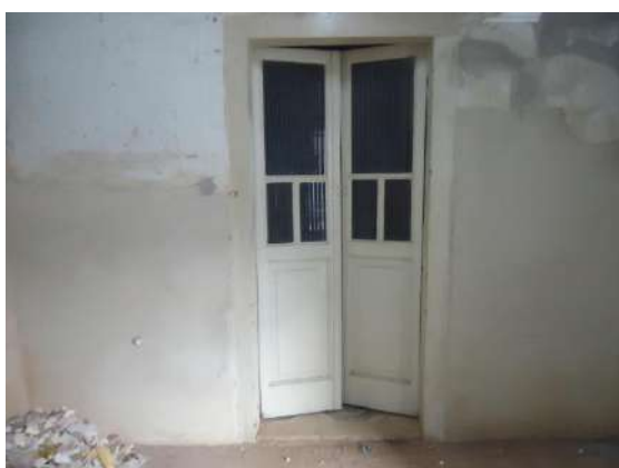
Pará de Minas Casa Maria Capanema

Porta em madeira e vidro entre a recepção e o arquivo apresenta bom estado de conservação.