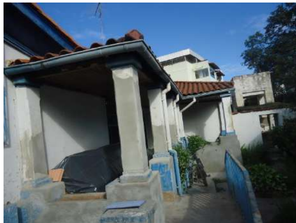
Pará de Minas Casa Maria Capanema Alvenarias do alpendre exibindo áreas em restauração, ainda não finalizadas. (foto 12)