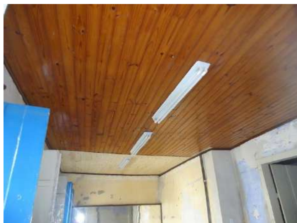
Pará de Minas Casa Maria Capanema Detalhe de área do assoalho em melhor estado de conservação exhibe área onde foi refeito. (foto 43)