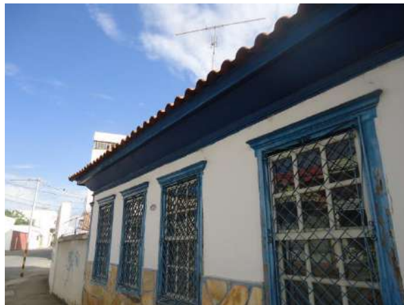
Pará de Minas Casa Maria Capanema

Janelas guilhotina em madeira e vidro e grade em metal necessitando de nova camada pictórica. (foto 28)