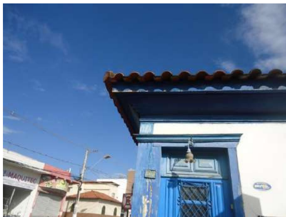
Pará de Minas Casa Maria Capanema

Cimalhas apresentando ressecamento, deslocamento e perda de material, ainda não restaurada.