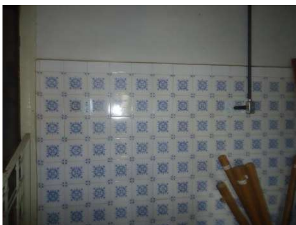
Pará de Minas Casa Maria Capanema

Cerâmicas em uma das salas do bem tomabdo em bom estado de conservação.