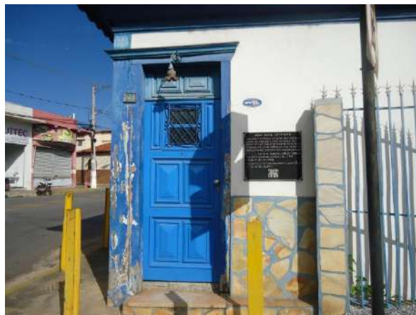
Pará de Minas Casa Maria Capanema Detalhe de pilar de madeira exibindo ressecamento ainda não restaurado (foto 07)