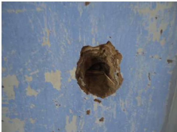
Pará de Minas Casa Maria Capanema Detalhe das camadas da estrutura original da edificação. (foto 11)