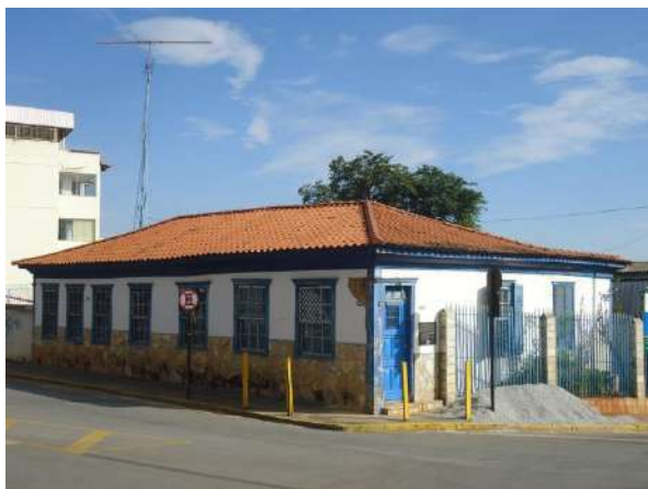
Pará de Minas Casa Maria Capanema

A estrutura e a cobertura estão em bom estado apesar de apresentarem algumas telhas quebradas.