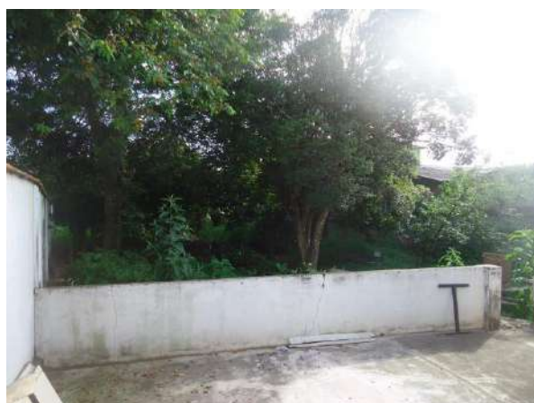
Pará de Minas Casa Maria Capanema Quintal em terra batida nos fundos da edificação.