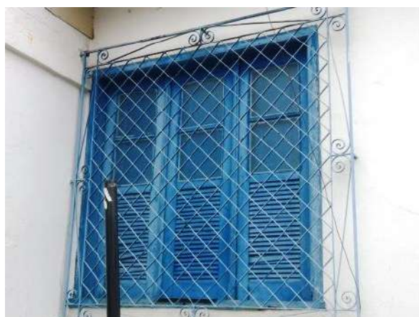
Pará de Minas Casa Maria Capanema

Janela francesa em madeira e vidro na fachada posterior e grade em metal necessitando de nova pintura. (foto 30)