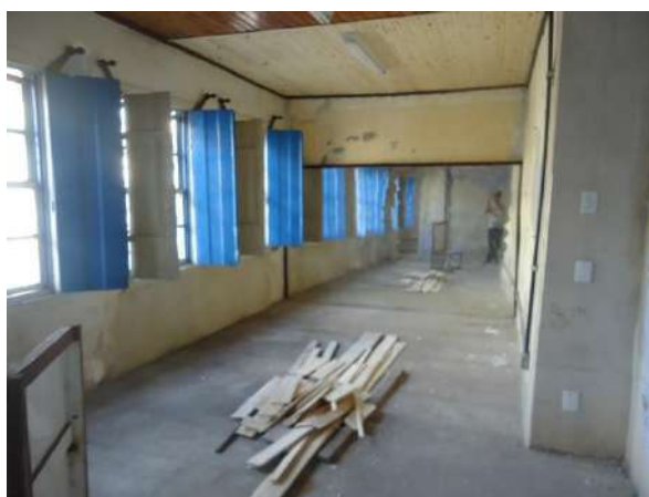
Pará de Minas Casa Maria Capanema Parede revestida com espelhos exibe bom estado de conservação mas algumas peças estão trincadas. (Foto 22)