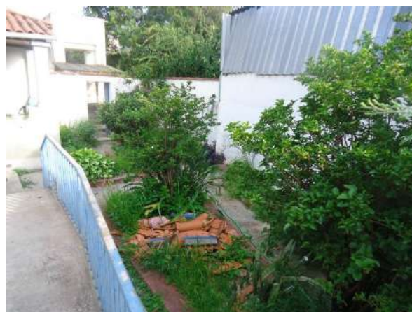
Pará de Minas Casa Maria Capanema Jardim de leve influência francesa na fachada lateral do bem tombado, necessita de cuidados. (foto 47)