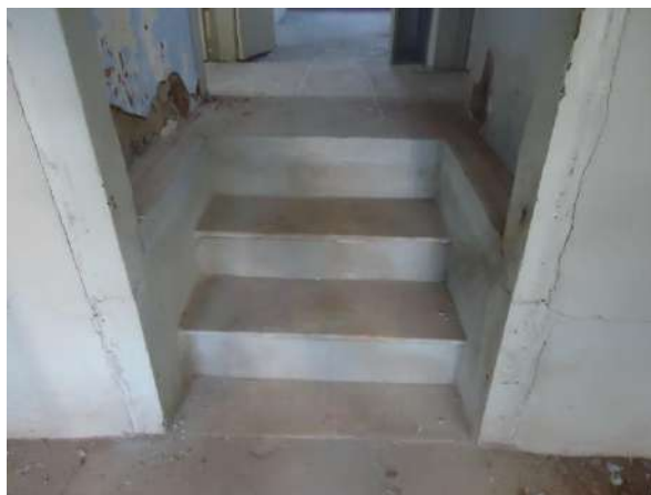
Pará de Minas Casa Maria Capanema Uma das escadas internas na Casa Maria Capanema novamente estabilizada e com seus pisos reinstalados. (Foto 42)