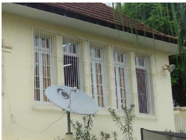
Pará de Minas Escola Estadual Governador Valadares Janelas em madeira e vidro das salas de aula nas laterais e fundos do bem estão bem conservadas. (foto 25)