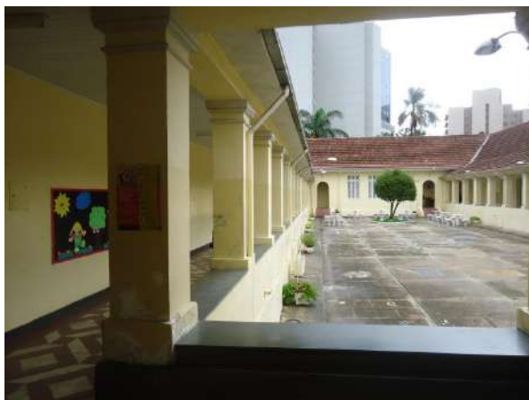
Pará de Minas Escola Estadual Governador Valadares Pilares e vigas das varanda internas apresentam bom estado de conservação. (foto 05)