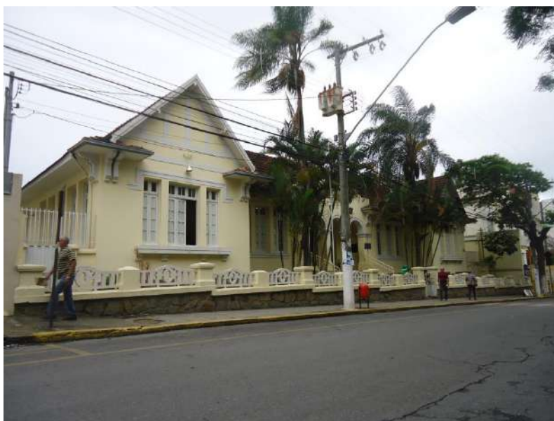
Pará de Minas Escola Estadual Governador Valadares Fachada Frontal (foto 01) Imagem: Álison Margotti – 06/11/2018