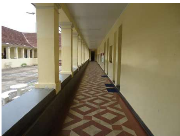
Pará de Minas Escola Estadual Governador Valadares Pilares e vigas dos claustros apresentam bom estado de conservação. (foto 07)