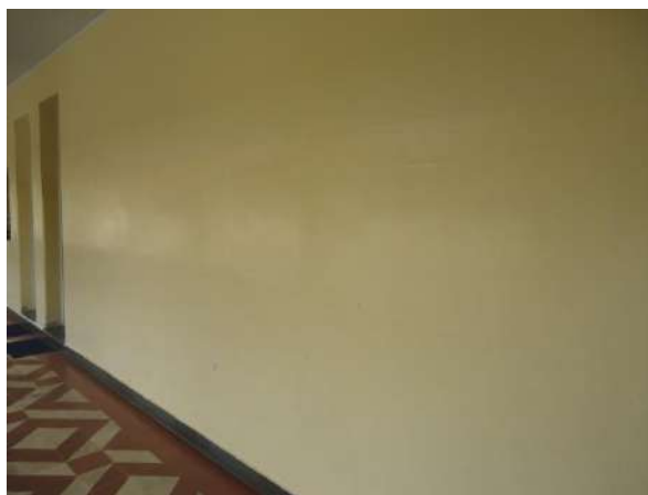
Pará de Minas Escola Estadual Governador Valadares As alvenarias se encontram em bom estado de conservação.