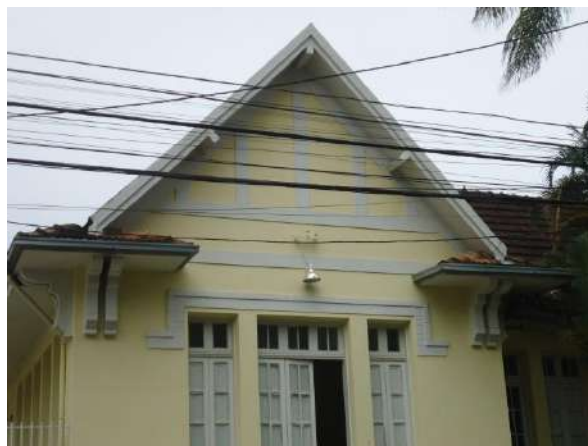
Pará de Minas Escola Estadual Governador Valadares Beiral e cachorros bem conservados na fachada frontal do bem.