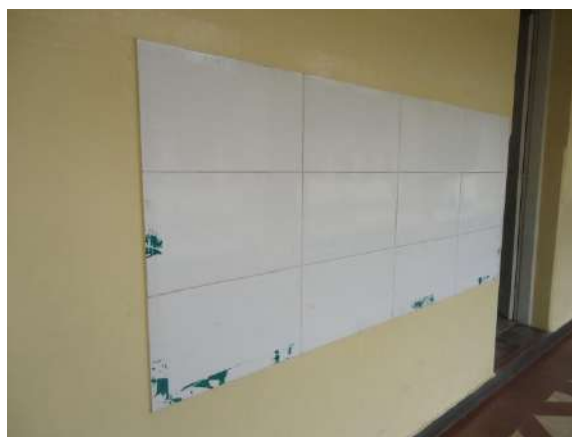
Pará de Minas Escola Estadual Governador Valadares Cerâmica nas paredes dos corredores, utilizadas para fixação de cartazes, exibindo bom estado. (foto 16) Imagem: Álisson Margotti – 06/11/2018