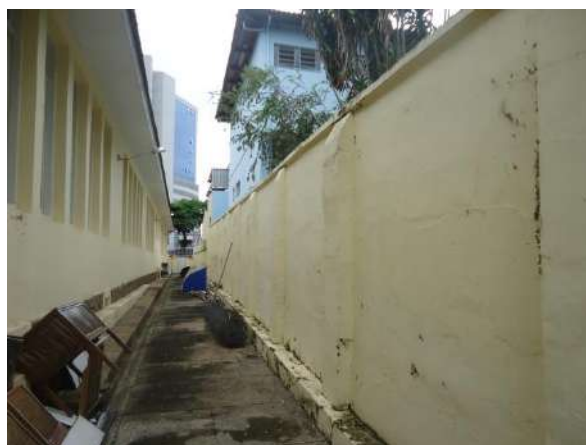
Pará de Minas Escola Estadual Governador Valadares Muro e quintal lateral direito, o piso está tricado e há acúmulo de materiais no mesmo. (foto 48)