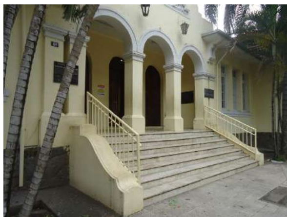
Pará de Minas Escola Estadual Governador Valadares Pilares e arcos da fachada frontal exibem boa conservação. (foto 08)