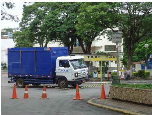
Pará de Minas Escola Estadual Governador Valadares Rua Delfim Moreira, vista para sentido NE, vista para a Praça Afonso Pena. (foto 50)