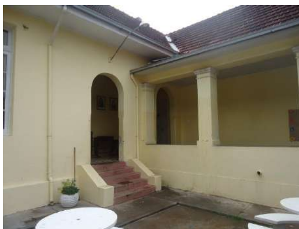
Pará de Minas Escola Estadual Governador Valadares Elementos da cobertura bem conservados, apenas algumas manchas de umidade. (foto 11)