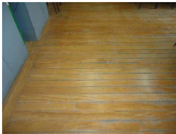
Pará de Minas Escola Estadual Governador Valadares Tacos comuns a todas as salas de aula do bem se apresentam bastante desgastados. (foto 31)