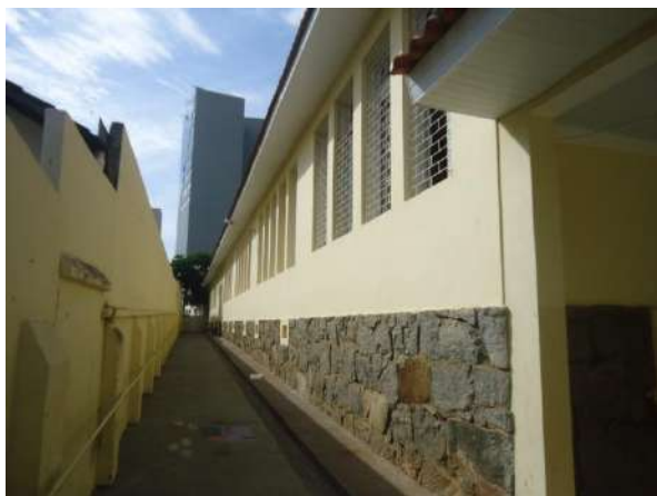
Pará de Minas Escola Estadual Governador Valadares Fachada lateral esquerda. (foto 02) Imagem: Álisson Margotti – 06/11/2018