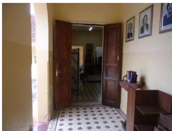
Pará de Minas Escola Estadual Governador Valadares Portas entre o hall de entrada e os claustros bem conservadas. (foto 22)