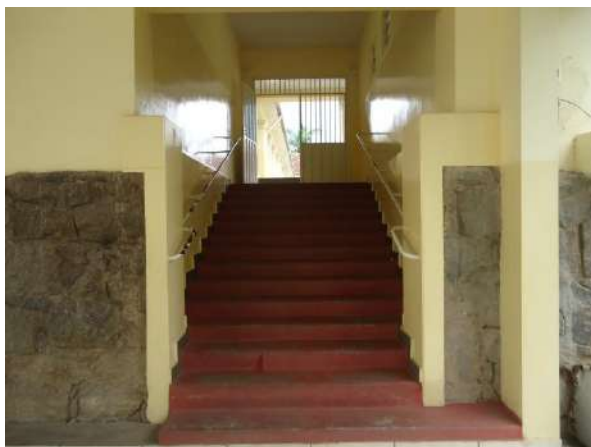
Pará de Minas Escola Estadual Governador Valadares Piso cimentado vermelho na escada entre a varanda interna e o refeitório bem conservada. (foto 30)