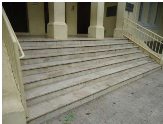
Pará de Minas Escola Estadual Governador Valadares O mármore que reveste a escadaria principal exibe trincas e desgaste. (foto 18) 06/11/2018