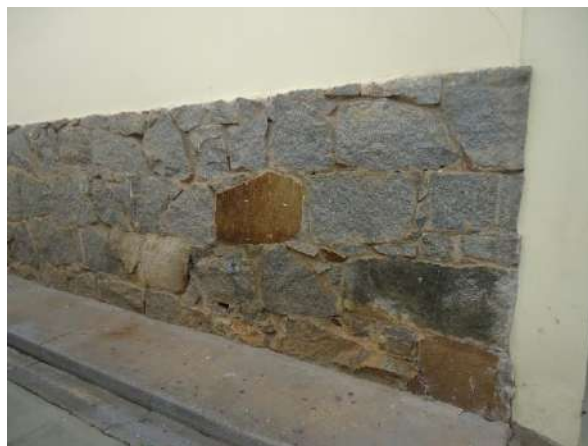
Pará de Minas Escola Estadual Governador Valadares Barrado em pedras brutas nas paredes laterais e fundos do bem tombado. (foto 20) Imagem: Álisson Margotti – 06/11/2018