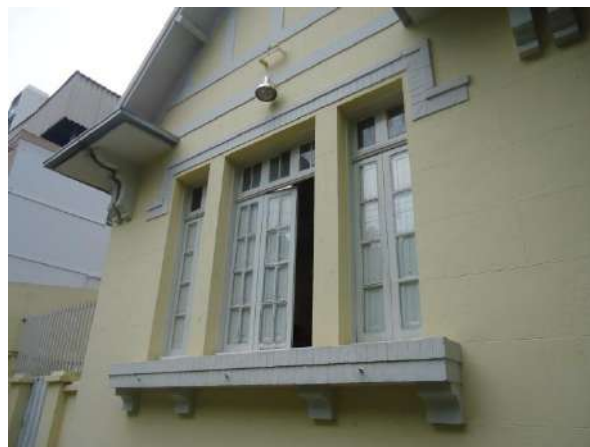
Pará de Minas Escola Estadual Governador Valadares Janelas da fachada frontal em madeira, enquadramento em massa e ornamentos em estuque bem conservados. (foto 24)