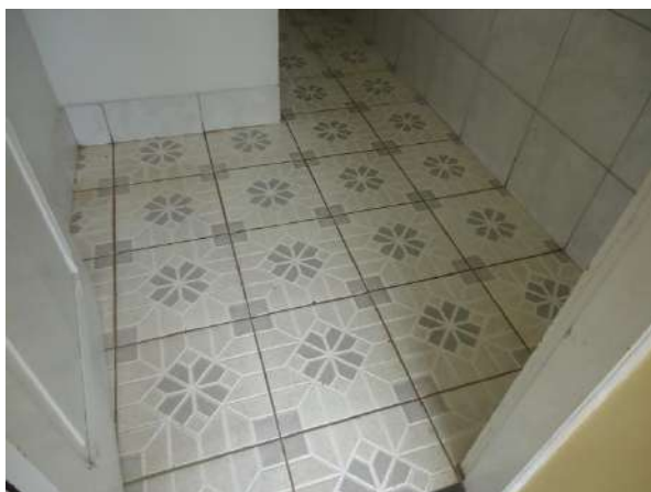
Pará de Minas Escola Estadual Governador Valadares Cerâmica dos banheiros apresenta bom estado de conservação. (foto 32)