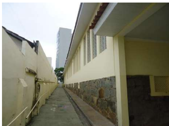
Pará de Minas Escola Estadual Governador Valadares Muro e quintal lateral esquerdo da edificação apresentando bom estado de conservação. (foto 47)