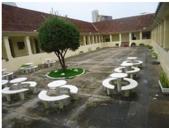
Pará de Minas Escola Estadual Governador Valadares Pátio conformado pelos claustros, apenas o piso cimentado exibe algumas trincas e manchas de umidade. (foto 46)