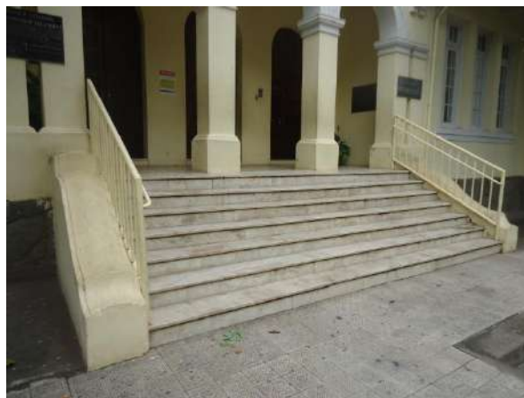
Pará de Minas Escola Estadual Governador Valadares Escada que dá acesso ao bem em bom estado mas exibe algumas trincas no mármore. (foto 43)