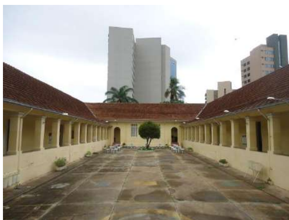
Pará de Minas Escola Estadual Governador Valadares Vista do pátio interno, ao fundo grande edifício comercial a 75m do bem tombado. (foto 49)