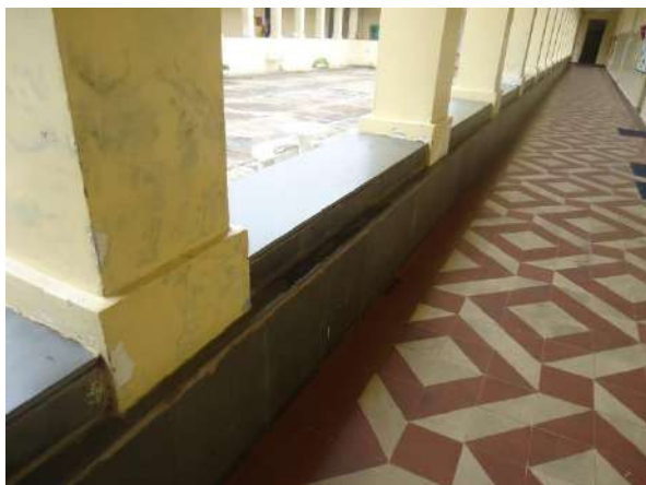
Pará de Minas Escola Estadual Governador Valadares Ladrilho hidráulico dos corredores da varanda interna apresentam desgaste e escurecimento. (foto 34)