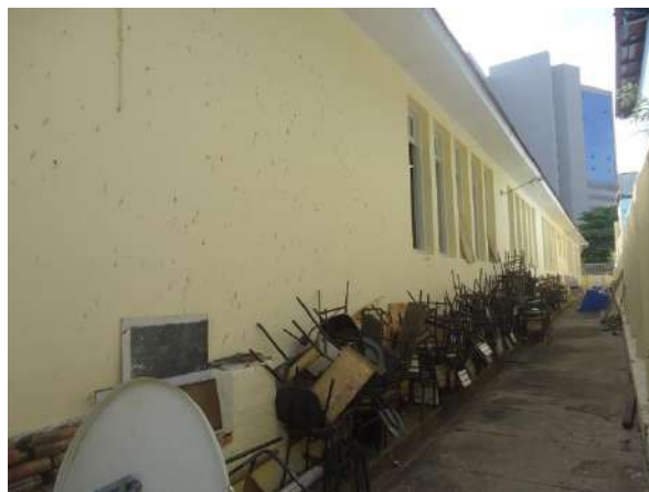
Pará de Minas Escola Estadual Governador Valadares Fachada lateral direita. (foto 03) 06/11/2018