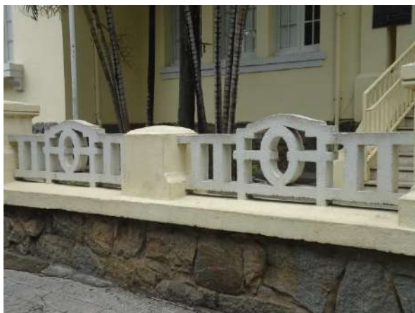
Pará de Minas Escola Estadual Governador Valadares Muro e gradil da fachada frontal do bem estão bem conservados.