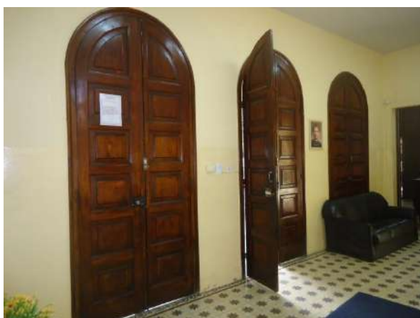
Pará de Minas Escola Estadual Governador Valadares Portas do acesso principal do bem apresentam bom estado de conservação. (foto 21) Imagem: Álisson Margotti – 06/11/2018