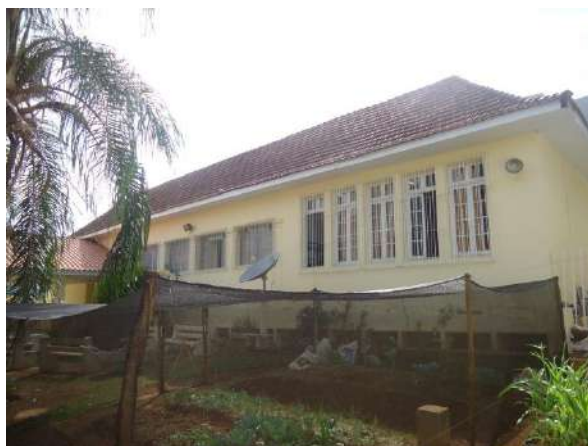
Pará de Minas Escola Estadual Governador Valadares Fachada Posterior (foto 04) Imagem: Álisson Margotti – 06/11/2018