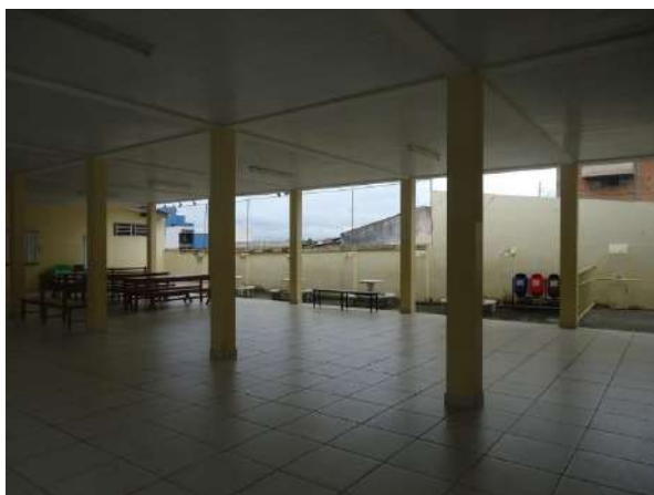
Pará de Minas Escola Estadual Governador Valadares Forro em PVC do refeitório em bom estado de conservação. (foto 40) Imagem: Álisson Margotti – 06/11/2018