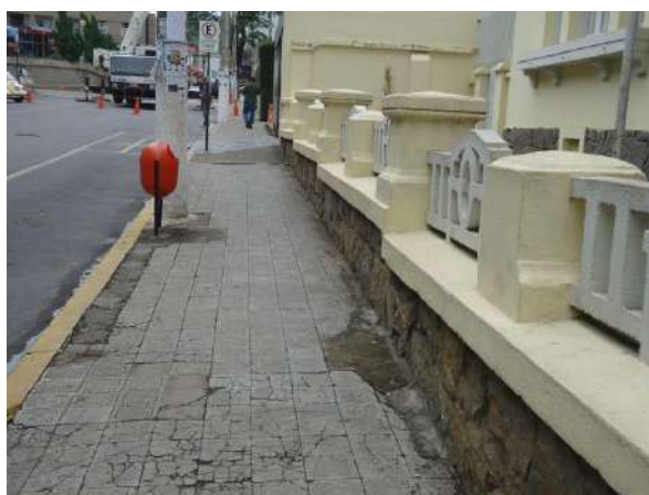
Pará de Minas Escola Estadual Governador Valadares Passeios em frente à edificação apresentam sujidades e remendos.