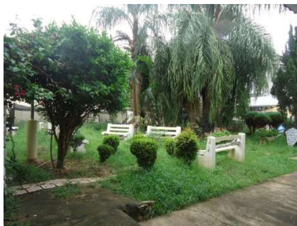
Pará de Minas Escola Estadual Governador Valadares Jardim para descanso e horta bem cuidados, nos fundos do bem, junto ao refeitório. (foto 45)