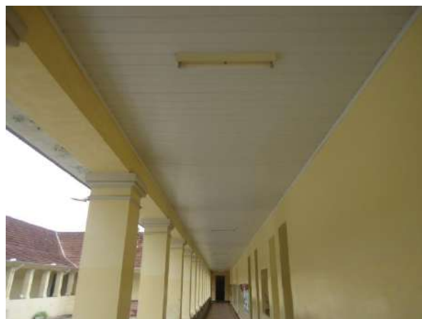
Pará de Minas Escola Estadual Governador Valadares Forro em PVC dos claustros laterais bem conservado. (foto 41) Imagem: Álisson Margotti – 06/11/2018