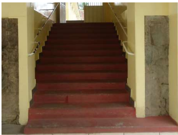
Pará de Minas Escola Estadual Governador Valadares Vista da escada que dá acesso ao refeitório apresenta desgaste do cimento vermelho. (foto 44)