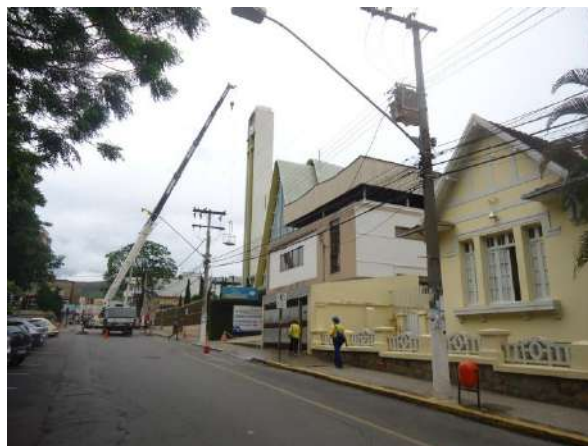
Pará de Minas Escola Estadual Governador Valadares Rua Delfim Moreira, vista para sentido SO, vista para Matriz de Nossa Senhora da Piedade. (foto 51)