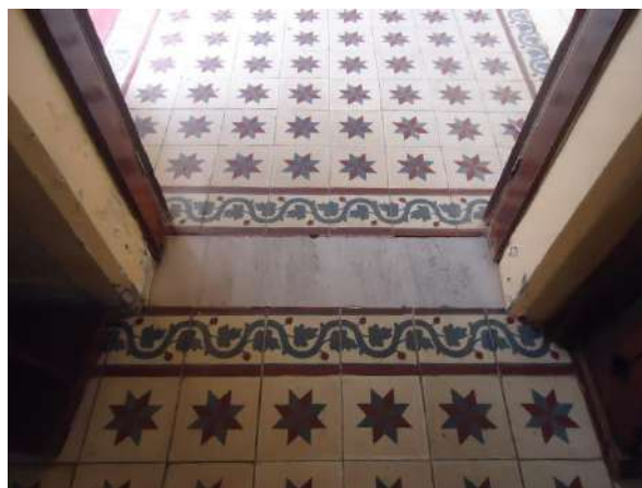
Pará de Minas Escola Estadual Governador Valadares Detalhe do ladrilho hidráulico do hall de entrada apresenta leve desgaste e algum escurecimento. (foto 33)