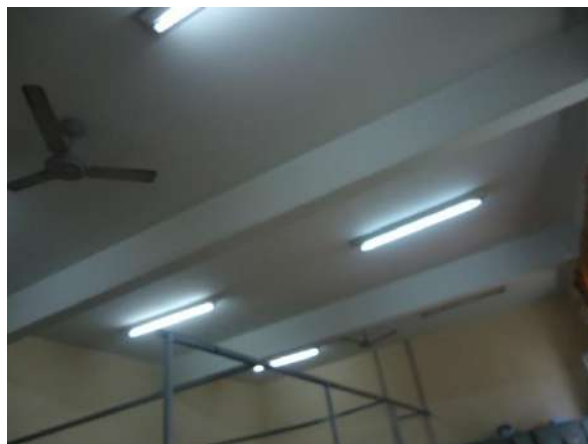
Pará de Minas Escola Estadual Governador Valadares As instalações elétricas foram reparadas na restauração e reforma do bem em 2016.