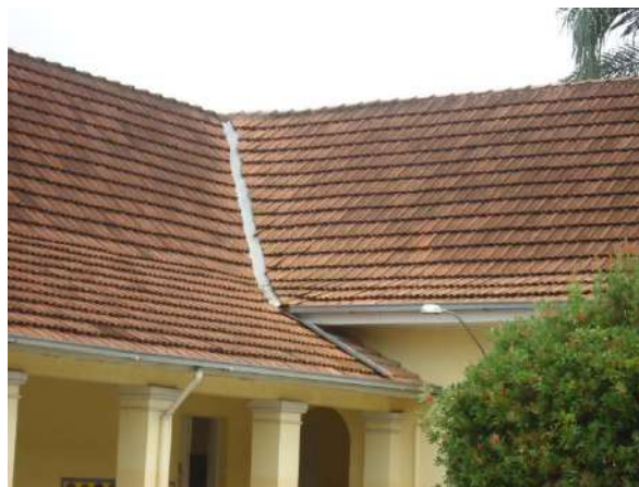
Pará de Minas Escola Estadual Governador Valadares Condutores de águas pluviais e guarda-pó bem conservados. (foto 10)