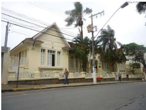
Pará de Minas Escola Estadual Governador Valadares Os elementos artísticos da fachada frontal apresentam bom estado de conservação. (foto 19) Imagem: Álisson Margotti – 06/11/2018