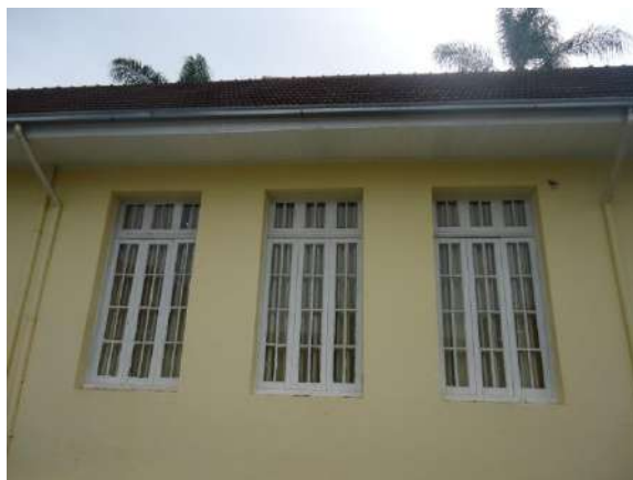
Pará de Minas Escola Estadual Governador Valadares Janela em madeira e vidro, enquadramento em massa nas laterais do bem exibem bom estado de conservação.