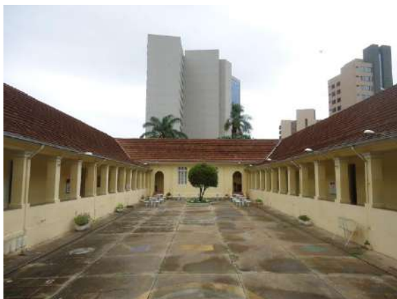
Pará de Minas Escola Estadual Governador Valadares Piso cimentado do pátio interno exibe trincas e manchas de umidade.