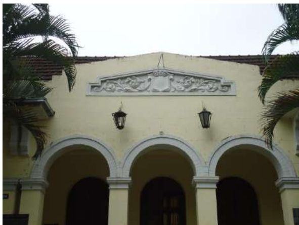
Pará de Minas Escola Estadual Governador Valadares Frontão com ornamentos em estuque em bom estado de conservação.