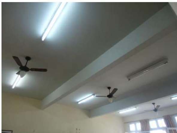
Pará de Minas Escola Estadual Governador Valadares Laje de uma sala de aula exibindo bom estado de conservação. (foto 38) 06/11/2018