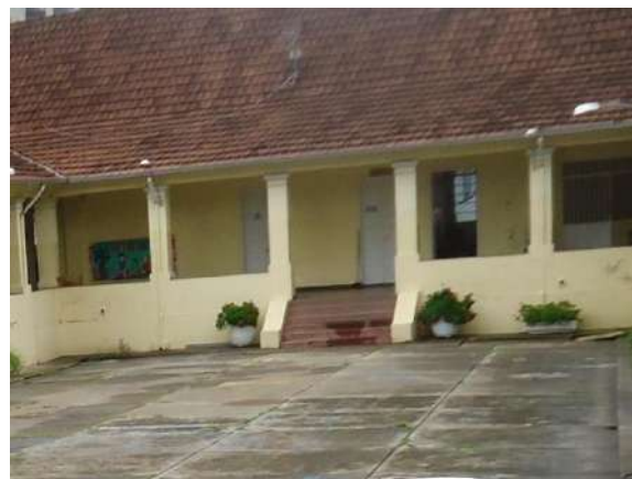
Pará de Minas Escola Estadual Governador Valadares Cimento vermelho na escada entre o pátio e a varanda interna apresenta desgaste.