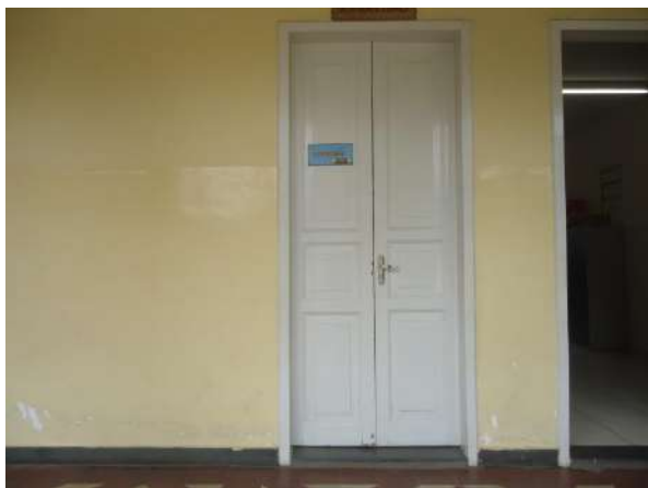
Pará de Minas Escola Estadual Governador Valadares Portas comuns às salas de aula bem conservdas mas apresentam ressecamentos e fissuras. (foto 23)