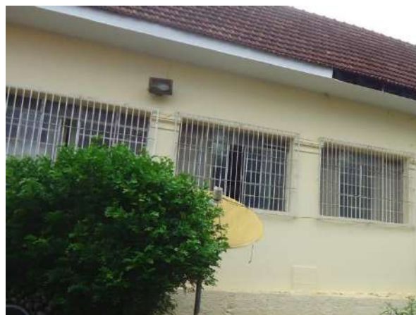
Pará de Minas Escola Estadual Governador Valadares Janelas em metal e vidro, enquadramneto em massa e grades nos fundos do bem em bom estado. (foto 26)