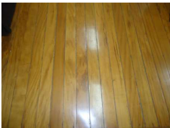
Pará de Minas Escola Estadual Governador Valadares Piso em madeira da diretoria apresentando bom estado de conservação. (foto 36)