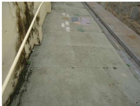
Pará de Minas Escola Estadual Governador Valadares Rampa de acessibilidade, muro, gradil e portão da fachada frontalem bom estado de conservação.