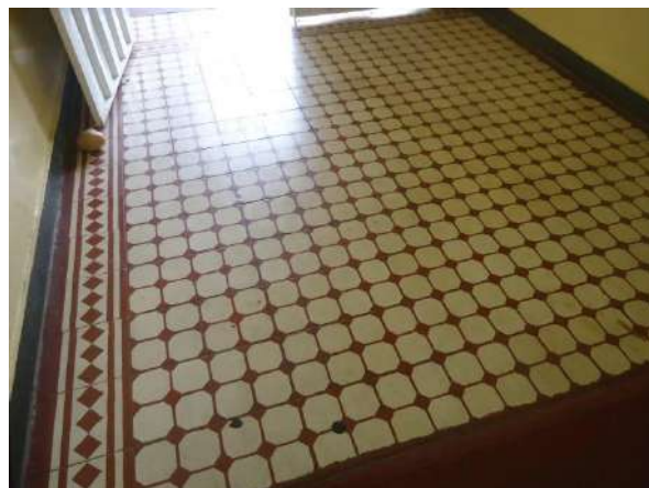
Pará de Minas Escola Estadual Governador Valadares Detalhe do ladrilho hidráulico do alto da escada entre a varanda interna e o refeitório desgastado e manchado. (foto 35)