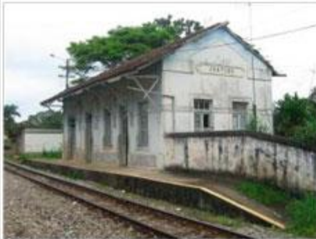
Foto 01 - Vista da estação. 17/03/10