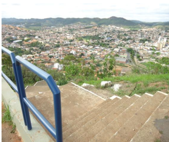
Pará de Minas-Cristo Redentor Vista do entorno (foto 17) Imagem: Isabel Garcia-01/11/2013