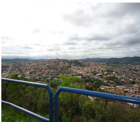
Pará de Minas-Cristo Redentor Vista do entorno (foto 19)