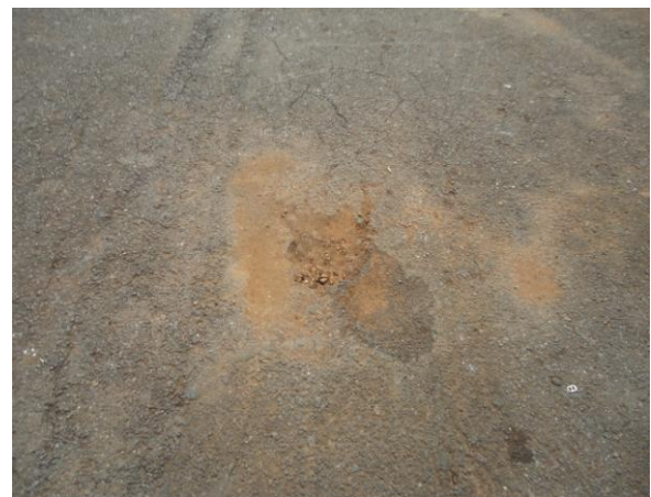
Pará de Minas-Cristo Redentor Buraco na pavimentação (foto 13) Imagem: Isabel Garcia-01/11/2013