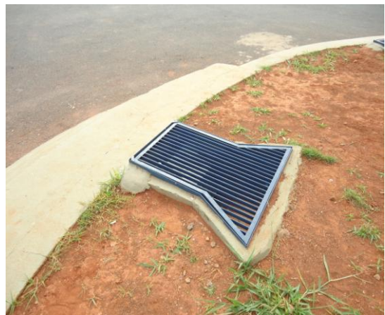
Pará de Minas-Cristo Redentor Iluminação embutida no piso (foto 16) Imagem: Isabel Garcia-01/11/2013