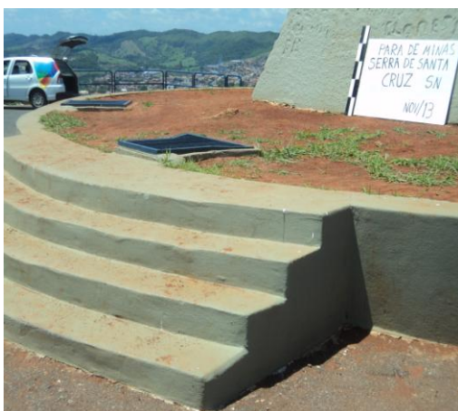
Pará de Minas-Cristo Redentor Escada (foto 08) Imagem: Isabel Garcia-01/11/2013