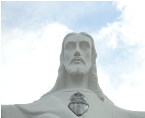
Pará de Minas-Cristo Redentor Rosto (foto 02) Imagem: Isabel Garcia-01/11/2013