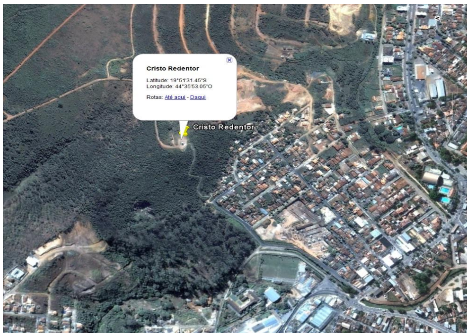
Coordenadas Geográficas Cristo Redentor.