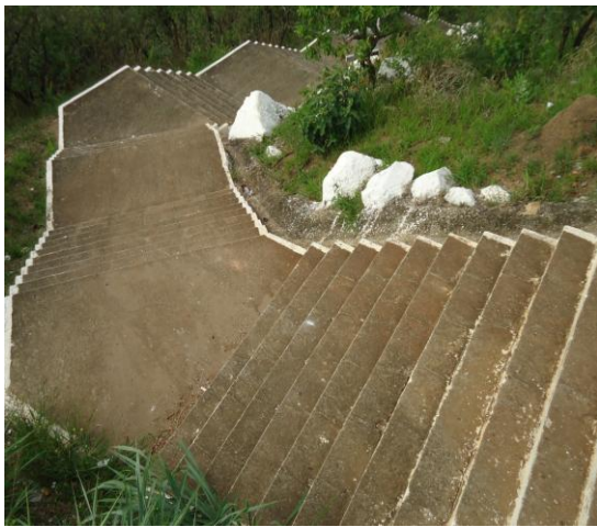
Pará de Minas-Cristo Redentor Acesso por escada (foto 10) Imagem: Isabel Garcia-01/11/2013