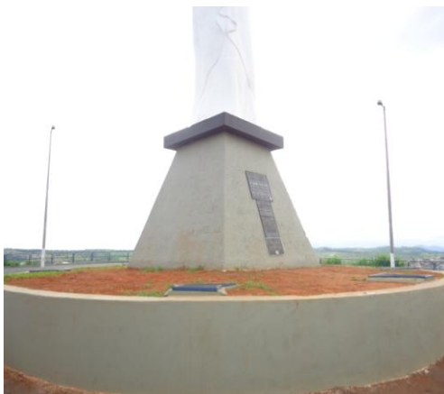
Pará de Minas-Cristo Redentor Base e jardim (foto 06) Imagem: Isabel Garcia-01/11/2013