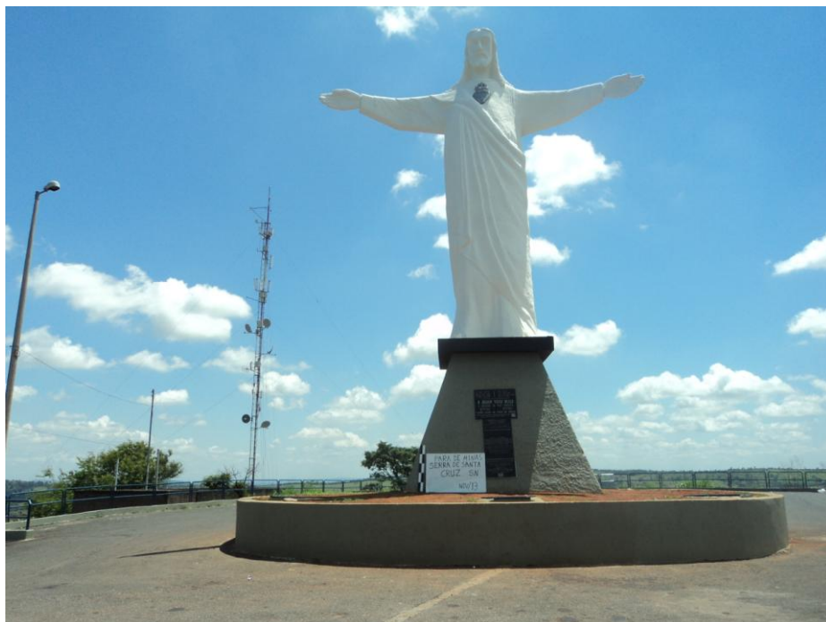
Pará de Minas - Cristo Redentor Vista frontal (foto 01) Imagem: Isabel Garcia-01/11/2013

EM CASO POSITIVO: LEI FEDERAL LEI ESTADUAL OUTRA