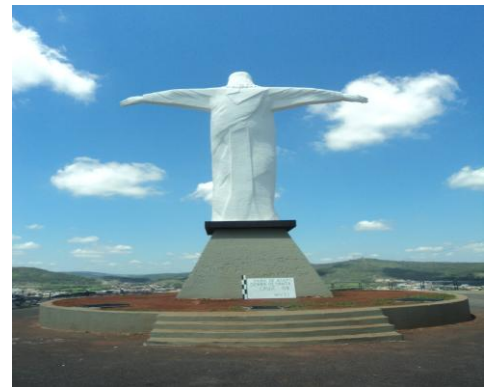
Pará de Minas-Cristo Redentor Vista posterior (foto 05) Imagem: Isabel Garcia-01/11/2013