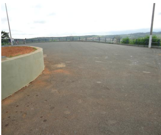
Pará de Minas-Cristo Redentor Pavimentação asfáltica ao redor (foto 12) Imagem: Isabel Garcia-01/11/2013