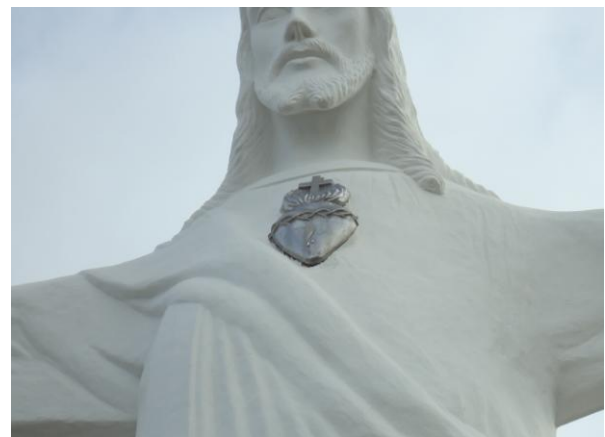
Pará de Minas-Cristo Redentor Coração metálico (foto 07) Imagem: Isabel Garcia-01/11/2013