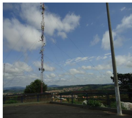
Pará de Minas-Cristo Redentor Vista do entorno (foto 20) Imagem: Isabel Garcia-01/11/2013