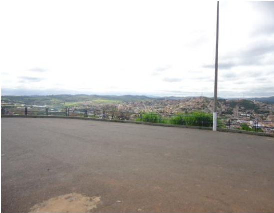
Pará de Minas-Cristo Redentor Vista do entorno (foto 21) Imagem: Isabel Garcia-01/11/2013