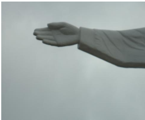
Pará de Minas-Cristo Redentor Mão direita (foto 04) Imagem: Isabel Garcia-01/11/2013