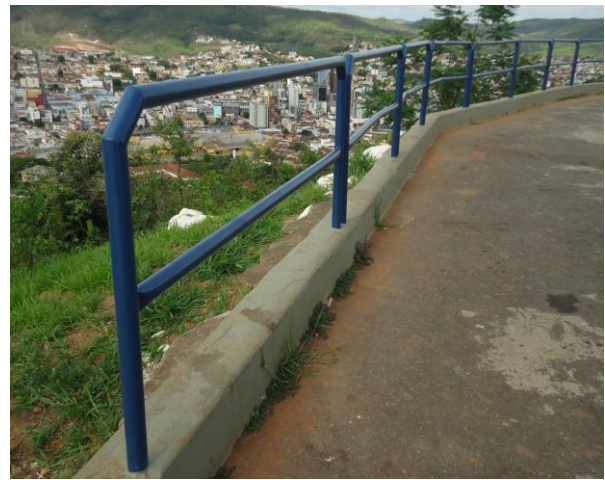
Pará de Minas-Cristo Redentor Guarda-corpo (foto 11)