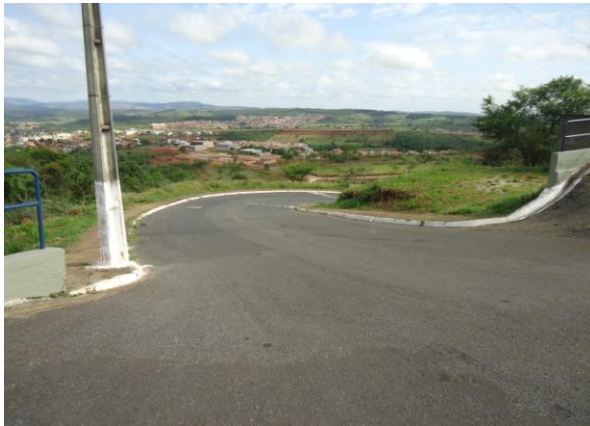
Pará de Minas-Cristo Redentor Acesso de veículos (foto 14) Imagem: Isabel Garcia-01/11/2013