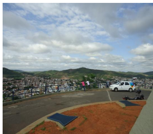
Pará de Minas-Cristo Redentor Vista do entorno (foto 18) Imagem: Isabel Garcia-01/11/2013