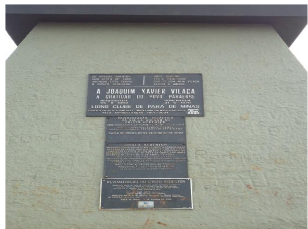
Pará de Minas-Cristo Redentor Placas (foto 09) Imagem: Isabel Garcia-01/11/2013