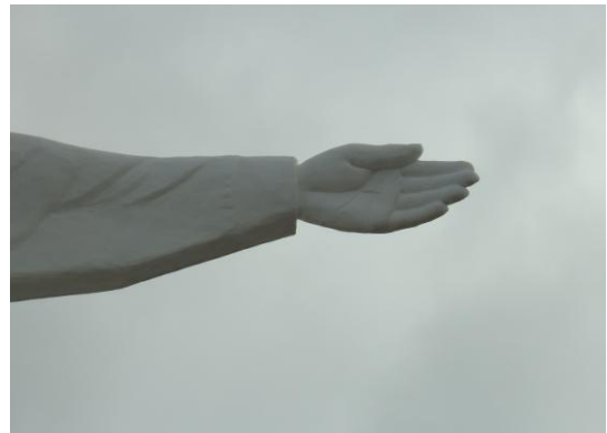
Pará de Minas-Cristo Redentor Mão esquerda (foto 03) Imagem: Isabel Garcia-01/11/2013