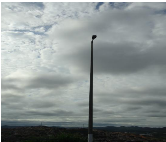
Pará de Minas-Cristo Redentor Poste de iluminação (foto 15)01/11/2013