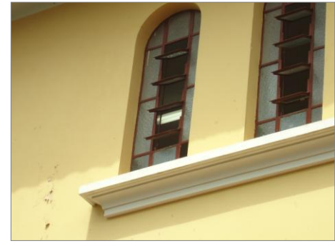
Pará de Minas – E.E. Fernando Otávio Janelas metálicas (foto 17) Imagem: Isabel Garcia-01/11/2013