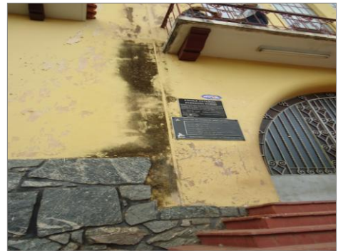
Pará de Minas – E.E. Fernando Otávio Manchas de umidade (foto 11)