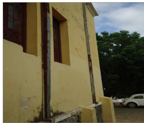
Pará de Minas – E.E. Fernando Otávio Condutores de água pluvial (foto 09)