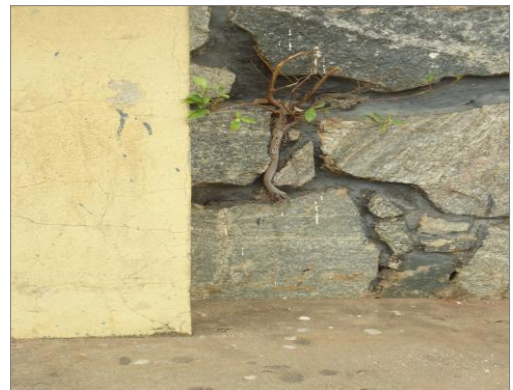
Pará de Minas – E. E. Fernando Otávio Arbusto no baldrame (foto 03)01/11/2013