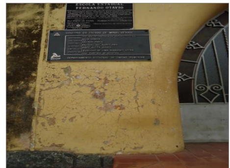
Pará de Minas – E.E. Fernando Otávio Manchas de umidade e descolamento da pintura(foto 13) Imagem: Isabel Garcia-01/11/2013