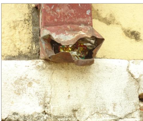
Pará de Minas – E.E. Fernando Otávio Saída do condutor (foto 08) Imagem: Isabel Garcia-01/11/2013