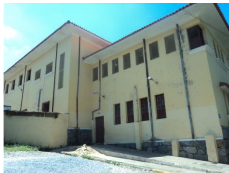
Pará de Minas-E.E. Fernando Otávio Iluminação externa (foto 02) Imagem: Isabel Garcia-01/11/2013