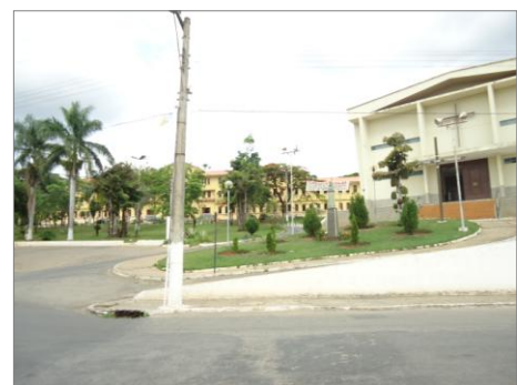
Pará de Minas – E.E. Fernando Otávio Vista da Rua Manoel de Souza ao lado da igreja São Francisco (foto 27) Imagem: Isabel Garcia-01/11/2013