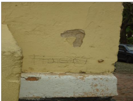
Pará de Minas-E.E. Fernando Otávio Reboco solto (foto 12) Imagem: Isabel Garcia-01/11/2013