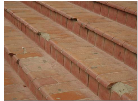
Pará de Minas – E.E.