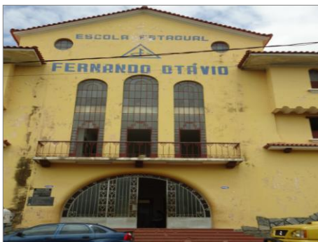
Pará de Minas – E.E. Fernando Otávio Portas metálicas (foto 16)01/11/2013