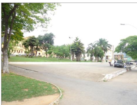
Pará de Minas-E.E. Fernando Otávio Vista da Praça Frei Concórdio(foto 26) Imagem: Isabel Garcia-01/11/2013