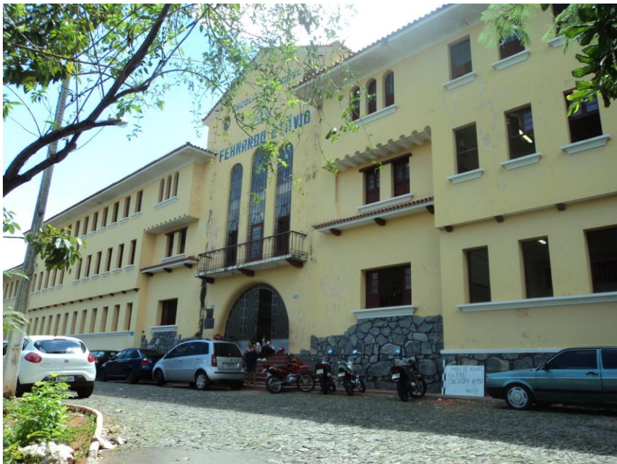
Pará de Minas-Escola Estadual Fernando Otávio Fachada frontal (foto 01)