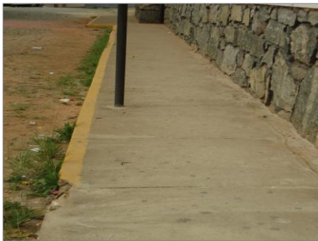
Pará de Minas – E.E. Fernando Otávio Calçada (foto 22) Imagem: Isabel Garcia-01/11/2013