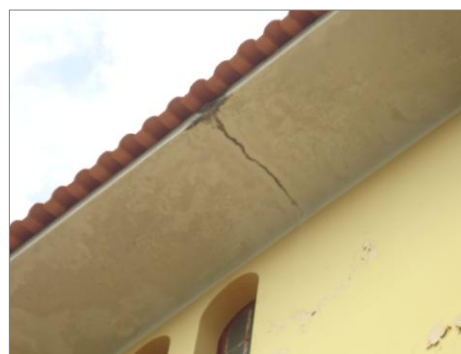
Pará de Minas – E.E. Fernando Otávio Trinca no beiral (foto 07) Imagem: Isabel Garcia-01/11/2013