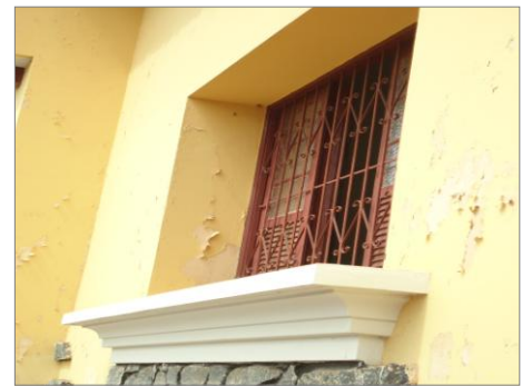
Pará de Minas – E.E. Fernando Otávio Enquadramento e grade (foto 15) Imagem: Isabel Garcia-01/11/2013