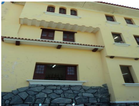
Pará de Minas – E.E. Fernando Otávio Janelas de madeira (foto 14) Imagem: Isabel Garcia-01/11/2013