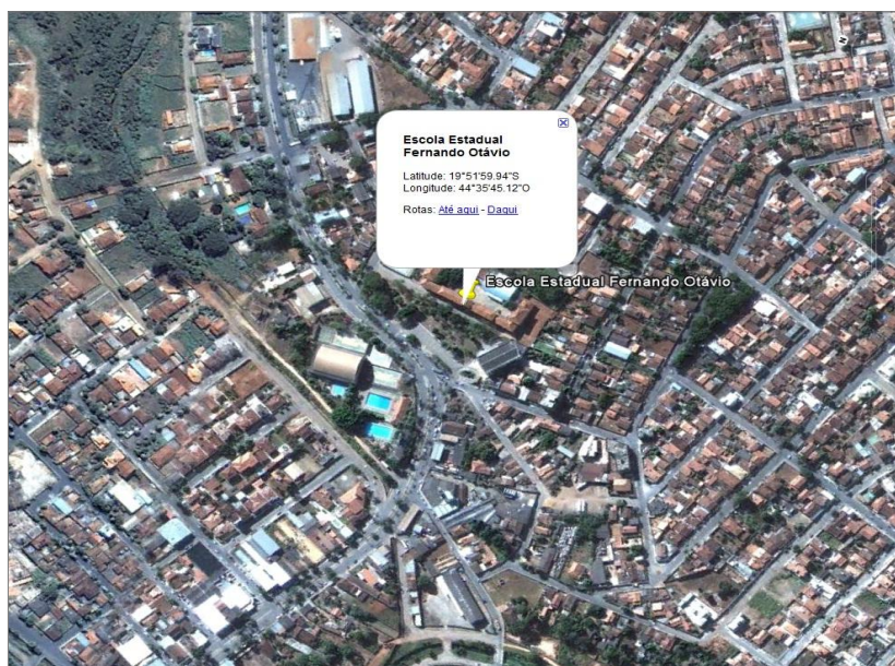
Coordenadas Geográficas Escola Estadual Fernando Otávio.

A edificação foi construída pelo Governo do Estado de Minas Gerais em 1943 para abrigar o ensino de padres franciscanos. Desde 1967, quando a Ordem Franciscana determinou seu fechamento, o prédio passou a ser denominado Escola Estadual Fernando Otávio. Embora seja frequentada diariamente por jovens estudantes, são poucos os danos recorrentes deste uso constante, eles se restringem aos revestimentos e acabamentos. Os principais problemas identificados têm como causa principal a ação da água por meio de infiltrações em diversos pontos da edificação.