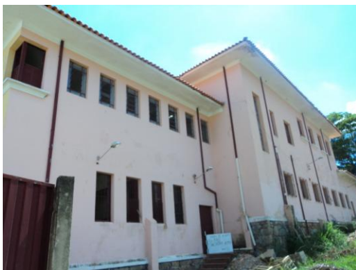
Pará de Minas – E. E. Fernando Otávio Fachada lateral direita (foto 04) Imagem: Isabel Garcia-01/11/2013