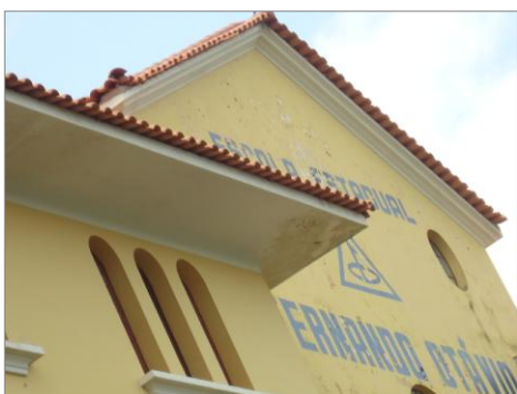
Pará de Minas – E.E. Fernando Otávio Telhas novas (foto 06) Imagem: Isabel Garcia-01/11/2013