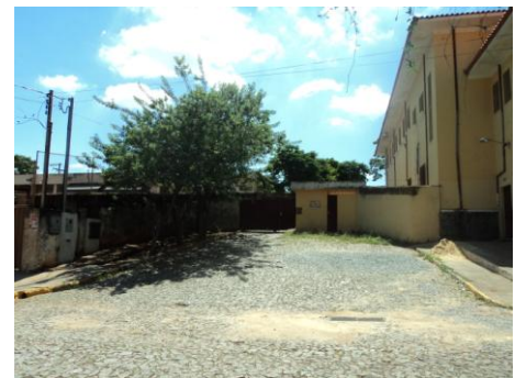
Pará de Minas – E.E. Fernando Otávio Muro (foto 21)