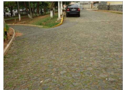
Pará de Minas – E.E. Fernando Otávio Pavimentação poliédrica e jardim (foto 23)