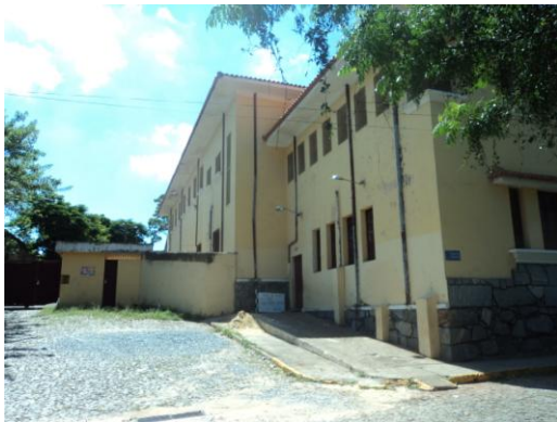
Pará de Minas – E. E. Fernando Otávio Fachada lateral esquerda (foto 02) Imagem: Isabel Garcia-01/11/2013