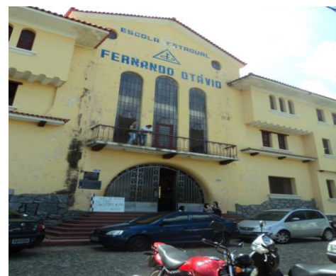
Pará de Minas – E. E. Fernando Otávio Fachada frontal (foto 05) Imagem: Isabel Garcia-01/11/2013