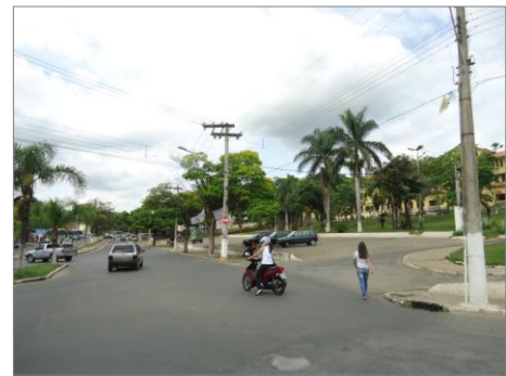
Pará de Minas – E.E. Fernando Otávio Vista da Avenida Presidente Vargas (foto 25) Imagem: Isabel Garcia-01/11/2013