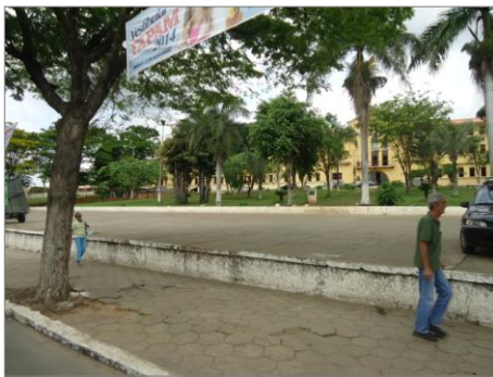
Pará de Minas – E.E. Fernando Otávio Vista da Avenida Presidente Vargas (foto 24) Imagem: Isabel Garcia-01/11/2013