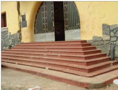
Pará de Minas – E.E. Fernando Otávio Escada (foto 18)