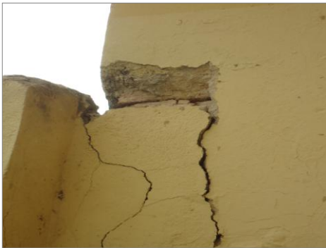
Pará de Minas – E.E. Fernando Otávio Trincas e tijolos aparentes (foto 10) Imagem: Isabel Garcia-01/11/2013