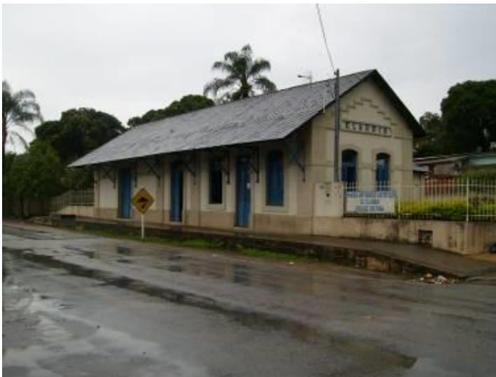
Foto 02 – Vista frontal e fachada lateral esquerda. Data: 27/10/09.