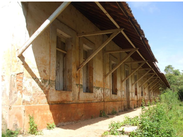
Foto 02 – Vista da fachada, com a cobertura sobre a plataforma de embarque. Data: 20/02/09