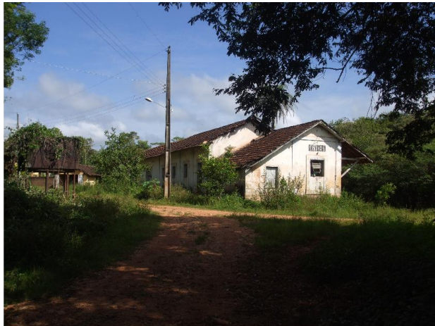
Foto 01 – Vista da estação. À esquerda, caixa d'água. Data: 20/02/09