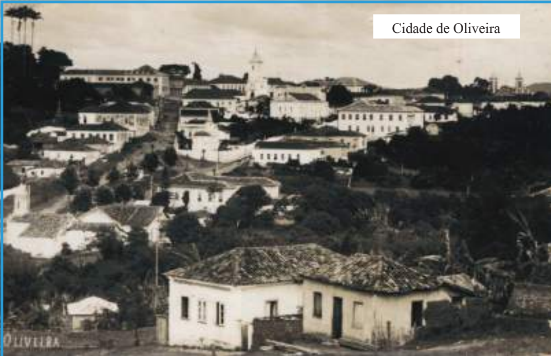
Cidade de Oliveira