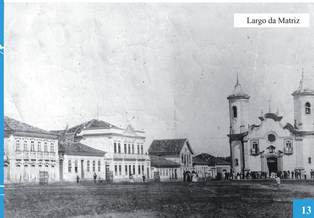
Largo da Matriz

Bens culturais intangíveis ou imateriais – aqueles relacionados às habilidades, aos saberes, às práticas culturais, às crenças e às expressões de comportamento como: literatura, música, danças e ritos.