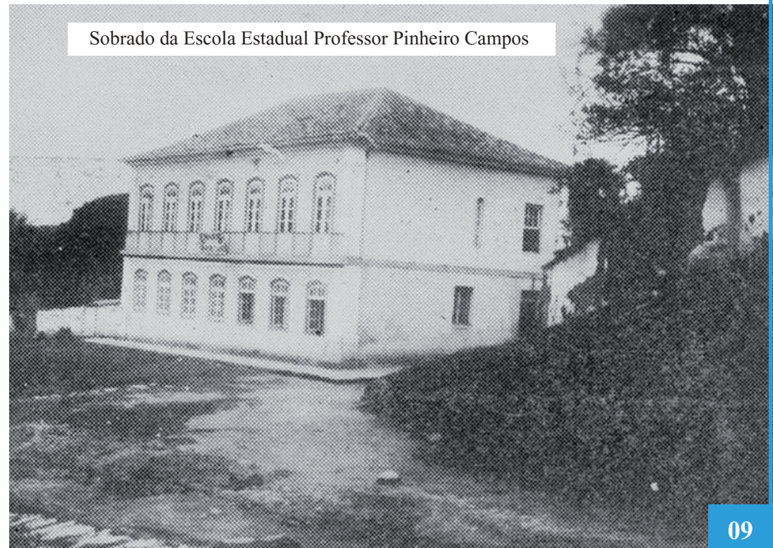
Sobrado da Escola Estadual Professor Pinheiro Campos

De forma geral, cultura é um conjunto de atividades e a forma de agir de um grupo humano; seus costumes, crenças e objetos materiais, pelos quais o homem se adequa às condições da sua existência. É um processo que desenvolve um grupo social, uma nação ou uma comunidade, através do trabalho coletivo pelo aprimoramento de seus valores.