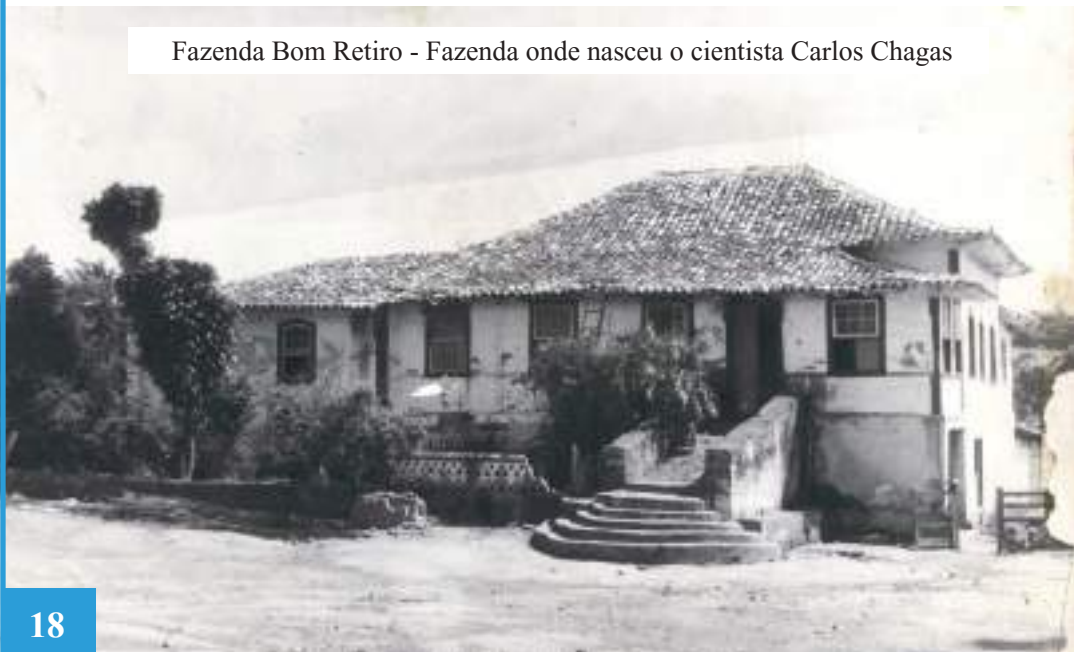
Fazenda Bom Retiro - Fazenda onde nasceu o cientista Carlos Chagas

DECRETO Nº 3.551, DE 4 DE AGOSTO DE 2000 – Institui o Registro de Bens Culturais de Natureza Imaterial que constituem patrimônio cultural brasileiro, cria o Programa Nacional do Patrimônio Imaterial e dá outras providências.