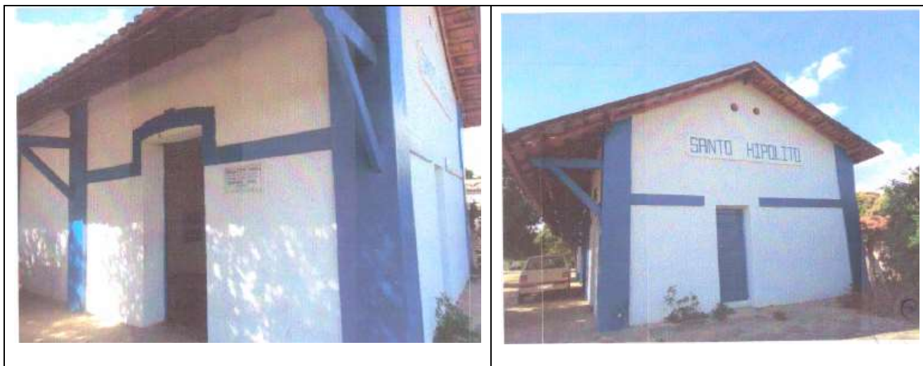
Figuras 06 e 07 – À esquerda, fachada principal. À direita, fachada lateral direita com detalhe para a presença de umidade na parte inferior da alvenaria.