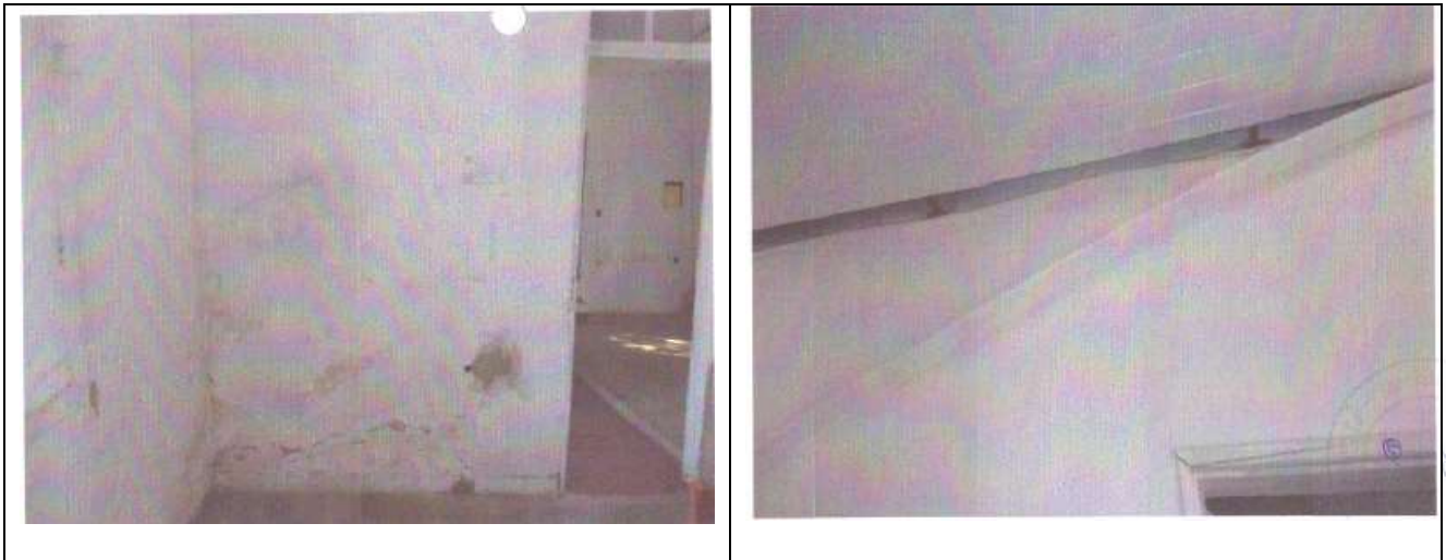
Figuras 10 e 11 – À esquerda, detalhe para a presença de umidade e sujidades na alvenaria. À direita, forro em PVC danificado.