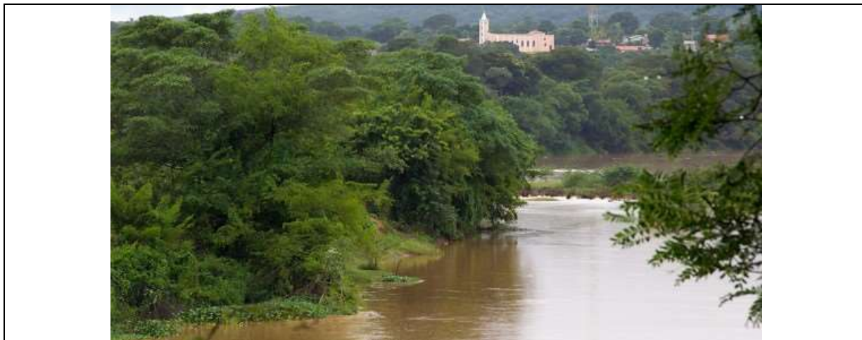
Figura 01 – Vista da cidade de Santo Hipólito a partir do Rio das Velhas.