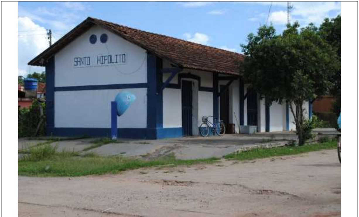
Figura 03 – Prédio da Antiga Estação Ferroviária de Santo Hipólito em 2012.