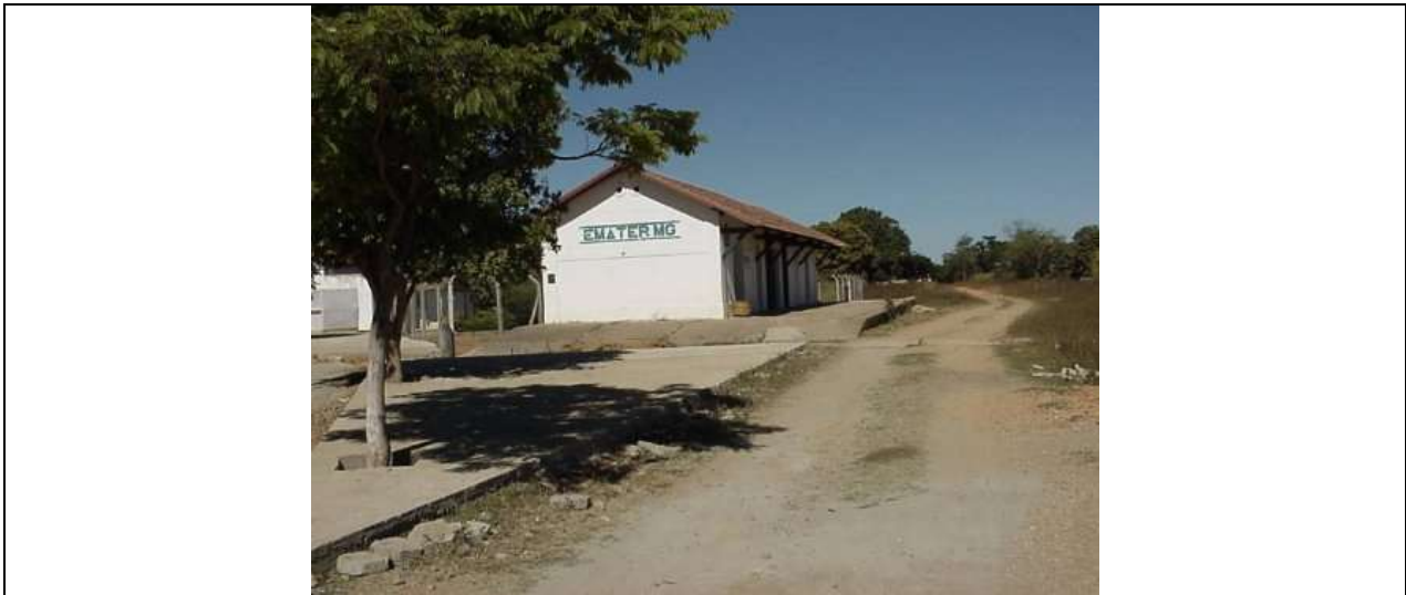
Figura 02 – A estação de Santo Hipólito em 2010.