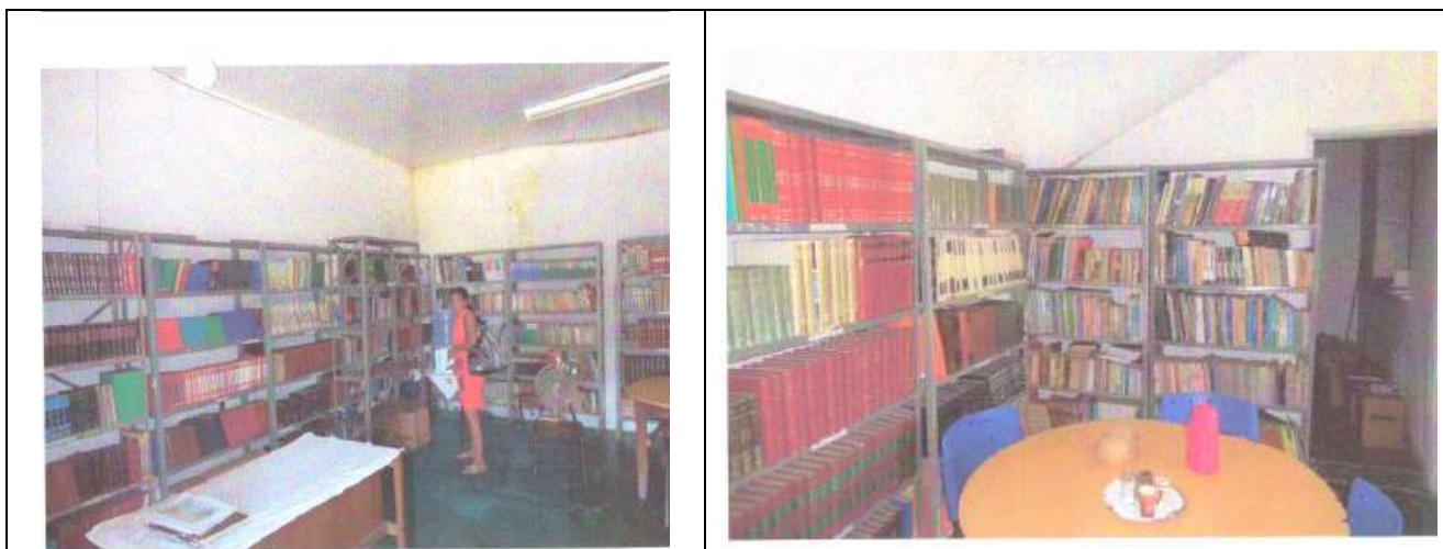
Figuras 08 e 09 – Detalhe do Acervo da Biblioteca Municipal de Santo Hipólito, que atualmente funciona na edificação.