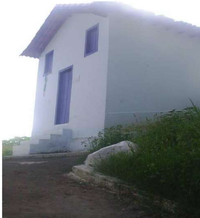
Vista da fachada principal e lateral esquerda da Capela