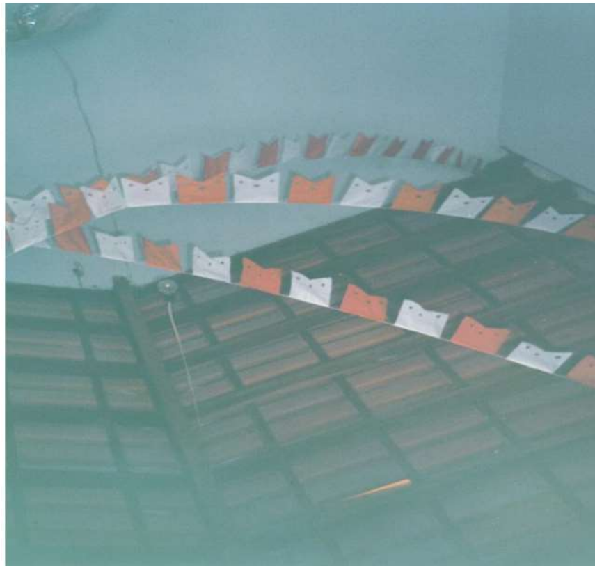
Vista do interior: telhado.