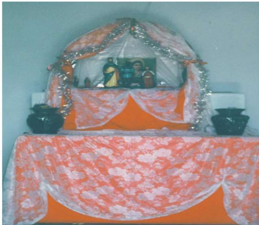
Interior da Capela: altar.