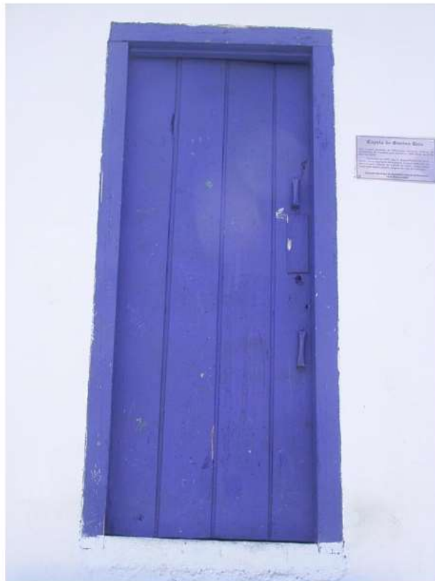
Porta da Capela