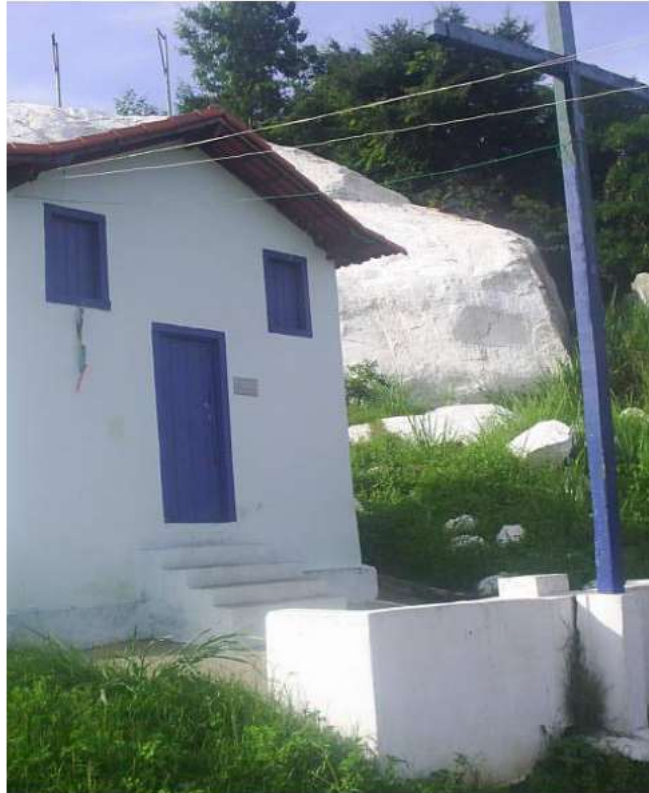
Vista da fachada principal