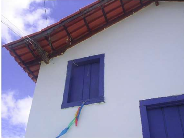
Vista parcial da fachada principal enfocando telhado e janela