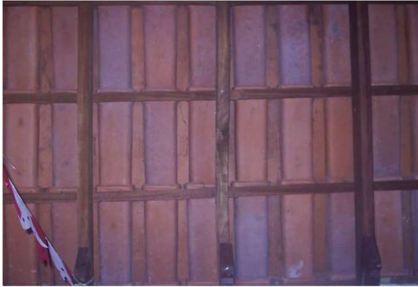
Vista do interior da Capela: telhado.