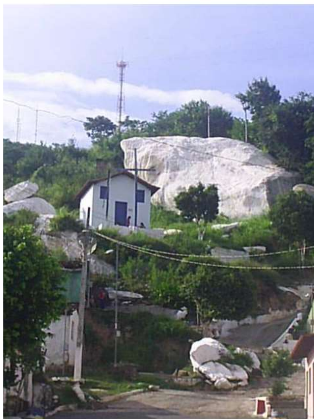
Vista do entorno da Capela