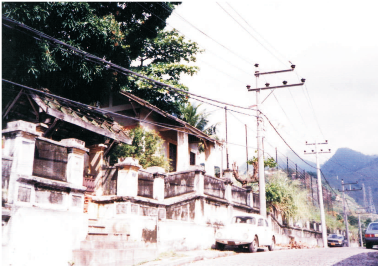
Reservatório Francisco Sá, maio/ 1991.