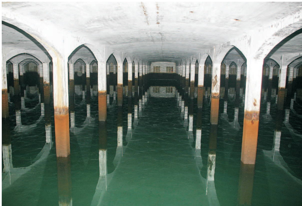
Reservatório Monteiro de Barros. 08/2006.