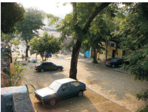
Rua Pernambuco, principal acesso. 11/2009.