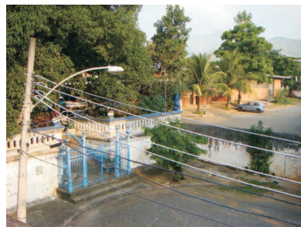
Rua Pernambuco, principal acesso. 11/2009.