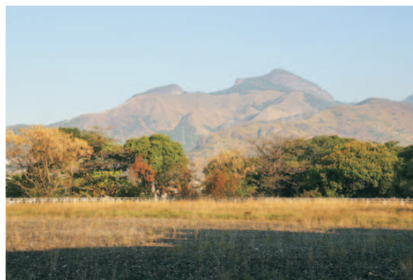
Vista a partir do topo do reservatório. 08/2006.