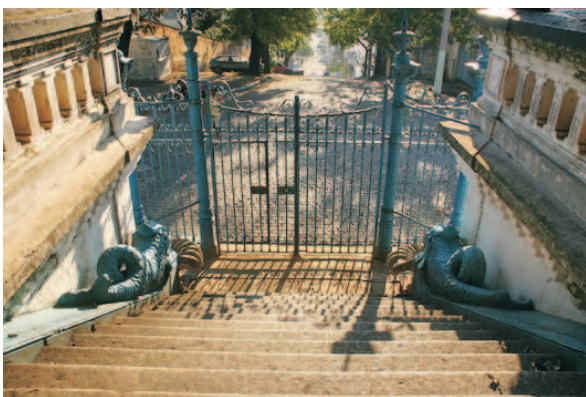
Rua Pernambuco, principal acesso. 08/2006.

Na entrada do reservatório há uma escadaria ornada com esculturas de golfinhos e sapos, ladeada por murada com balaustrada, onde também há golfinhos. O reservatório se encontra num amplo terreno em trecho elevado, de onde se descortina ampla vista do bairro e adjacências. Originalmente havia apenas o reservatório, a casa de manobras acoplada ao mesmo, a elevatória e um pequeno coreto. O terreno é plano, muito arborizado, com predominância de mangueiras. Ao longo do tempo, algumas diretorias da Cedae passaram a implantar seus serviços no terreno, resultando na construção de novas edificações. Além disso, parte dos serviços ocupa áreas ao ar livre, fora das edificações, como o armazenamento de areia, brita, e cilindros de cloro. As novas edificações são muito contrastantes com as originais e sua implantação no terreno parece não ter seguido qualquer plano, ocorrendo ao sabor das necessidades. O resultado é que muitas vezes elas prejudicam a visibilidade dos bens tombados.