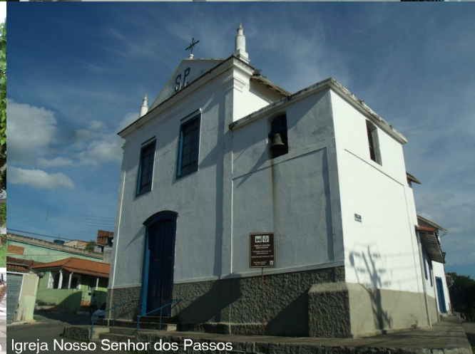
Igreja Nosso Senhor dos Passos