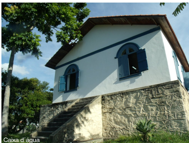
Caixa d' água