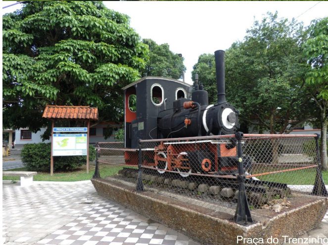
Praça do Trenzinho