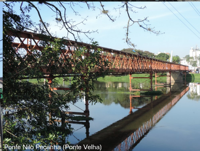
Ponte Nilo Peçanha (Ponte Velha)