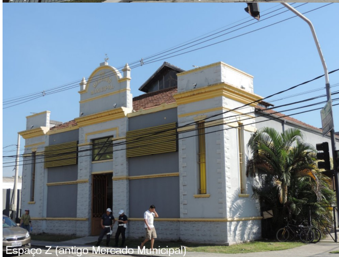
Espaço Z (antigo Mercado Municipal)