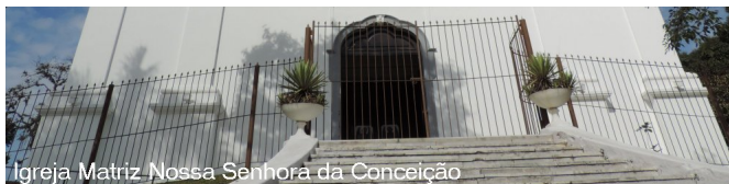
Igreja Matriz Nossa Senhora da Conceição