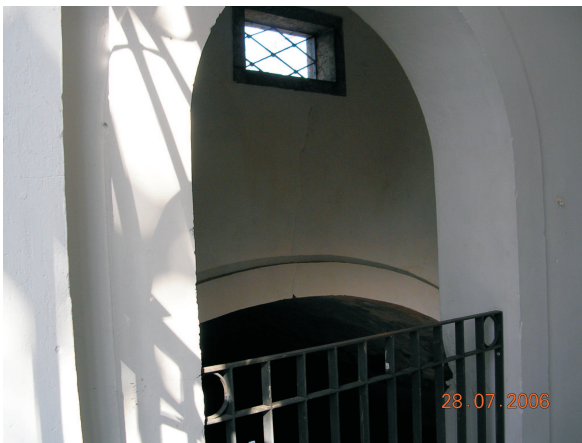
Interior do reservatório