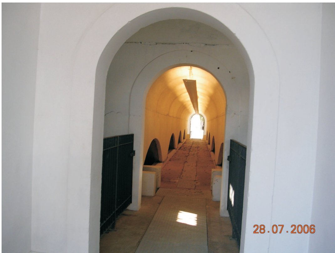
Galeria no interior do reservatório