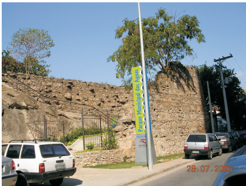
Parque Municipal da Águas