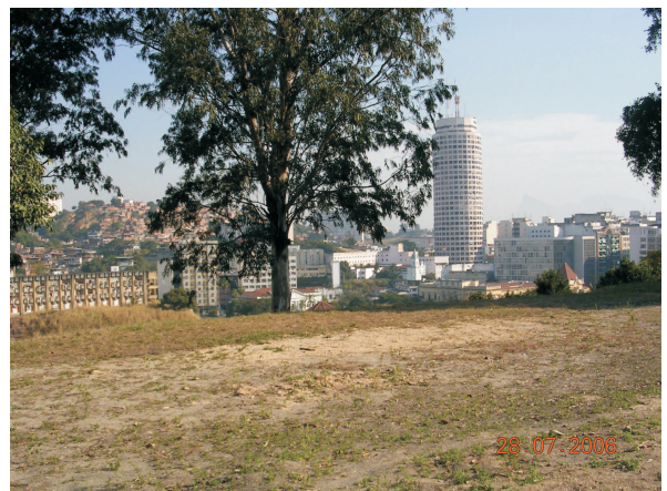
Vista do Parque