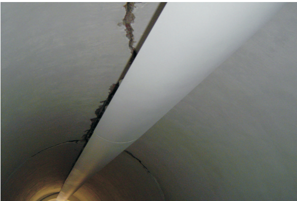
Rachadura na cobertura do reservatório