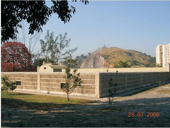
Exterior do reservatório