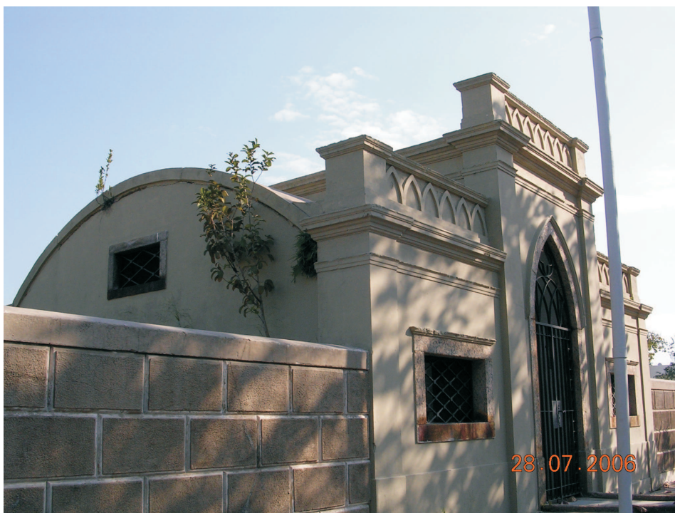
Reservatório da Correção. 07/2006