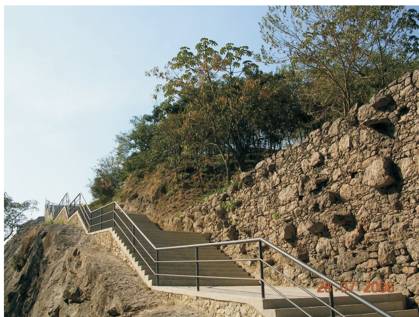
Parque Municipal da Águas