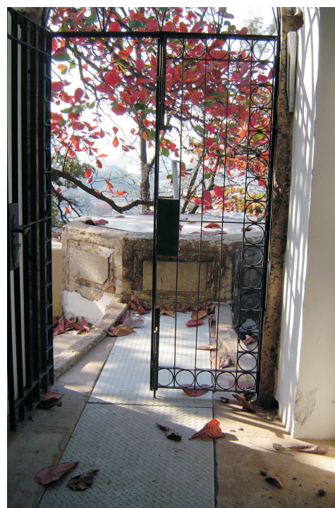
Porta do reservatório