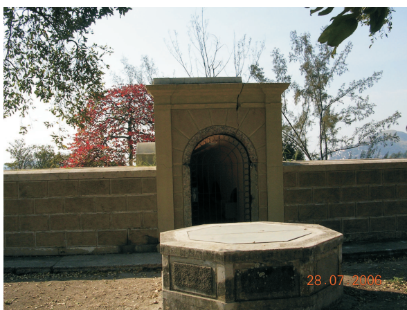
Exterior do reservatório