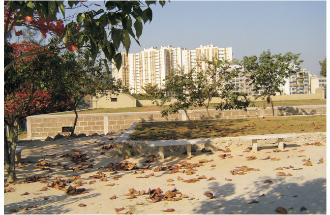
Exterior do reservatório