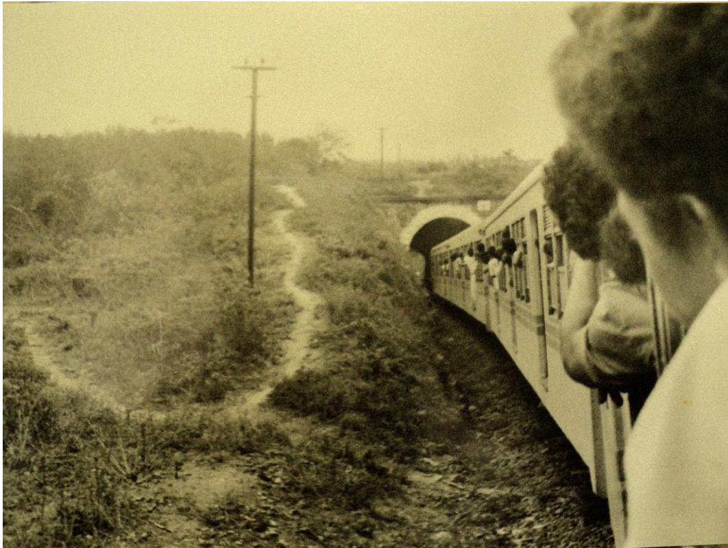
Imagem 03: Trem passando sob túnel em Pernambuco.

Esse conjunto de elementos pode ser caracterizado considerando o tipo de bens que o compõem, seja o material rodante, os pátios, o acervo edificado, os equipamentos de sinalização e comunicação e o acervo documental. O primeiro pelas máquinas, locomotivas, vagões, estradas de ferro, pontes, pontilhões, túneis, sinais e todos os instrumentos e equipamentos relacionados à operação do sistema; o segundo, pelos bens imóveis constituídos pelas estações ferroviárias, nas suas mais diversas dimensões, casas dos agentes, armazéns, castelos, caixas d'água, oficinas, escolas, centro recreativos, vilas e similares. Neste caso, se enquadram também os bens móveis e integrados, por se constituírem parte da tipologia arquitetônica da edificação, como as mãos francesas, os lambrequins, escadas, vitrais e algumas esquadrias diferenciadas, ou por se constituírem elementos ferroviários de sinalização e de comunicação, e ainda elementos integrantes da superestrutura e infraestrutura ferroviária.