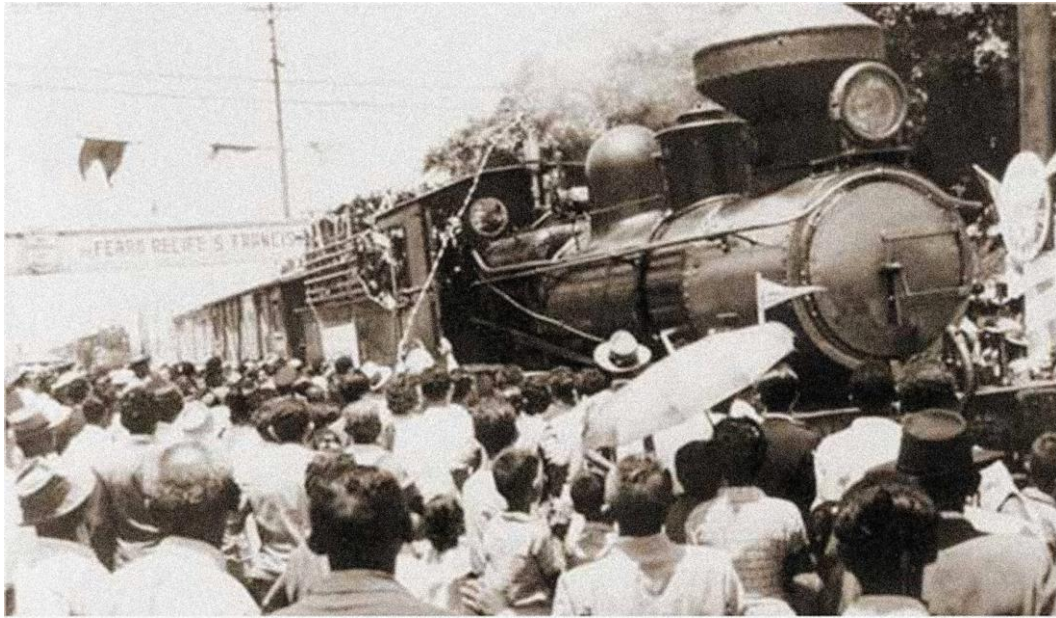
Imagem 05: Trem partindo do pátio das Cinco Pontas com faixa comemorativa onde está escritório da “Estrada de Ferro Recife S. Francisco”.

Com base nesse estudo, pode-se compreender que a memória ferroviária consiste então em todos os suportes e fontes de informações sobre o contexto ferroviário brasileiro, sobretudo os de ordem documental-bibliográfica, iconográfica, histórica (incluindo fontes de história oral e ruínas de testemunhos), arquitetônico-urbanística (tanto no plano interno a cada complexo ferroviário – organização espacial, quanto em relação à implantação na paisagem da cidade) e sociológica (relações de produção, de trabalho, de vizinhança – micro e macrossocial – de parentesco).