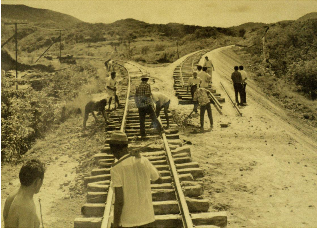
Imagem 04: Trecho em construção da Rede Ferroviária em Pernambuco.

A constituição e manutenção de uma memória coletiva, a partir da conjunção daquilo que foi contado, resultam em novas maneiras de apreensão e compreensão daquilo que não mais ali está :