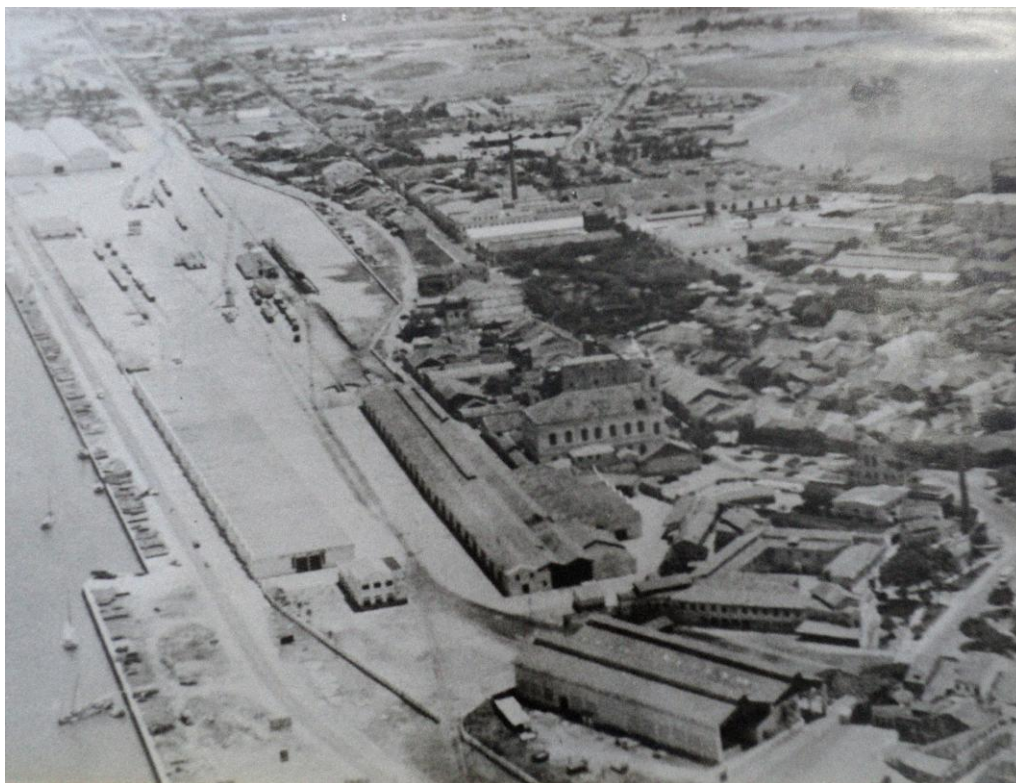
Imagem 02: Vista panorâmica do Pátio Ferroviário das Cinco Pontas, Recife / PE.

Pode-se afirmar existir uma tipologia de pátios ferroviários, que compreende as edificações e estruturas acima expostas, de acordo com a demanda de carga e de passageiros da região. Dos pátios ferroviários originais das primeiras ferrovias do Brasil, o das Cinco Pontas é o que se encontra atualmente mais íntegro e ainda mantém a ligação como o porto do Recife, apesar das modificações ocorridas ao longo dos anos. Ele constitui com o porto uma paisagem cultural característica das cidades, sobretudo litorâneas, onde se implantou esse modo de produção.