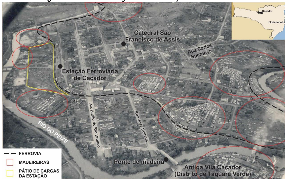
Figura 2: Vista aérea da região central de Caçador na década e 1950.