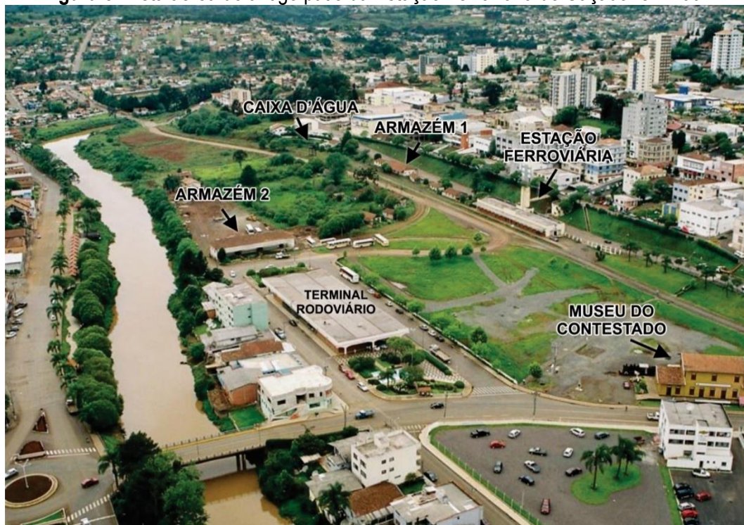
Figura 5: Vista aérea do antigo pátio da Estação Ferroviária de Caçador em 2004.