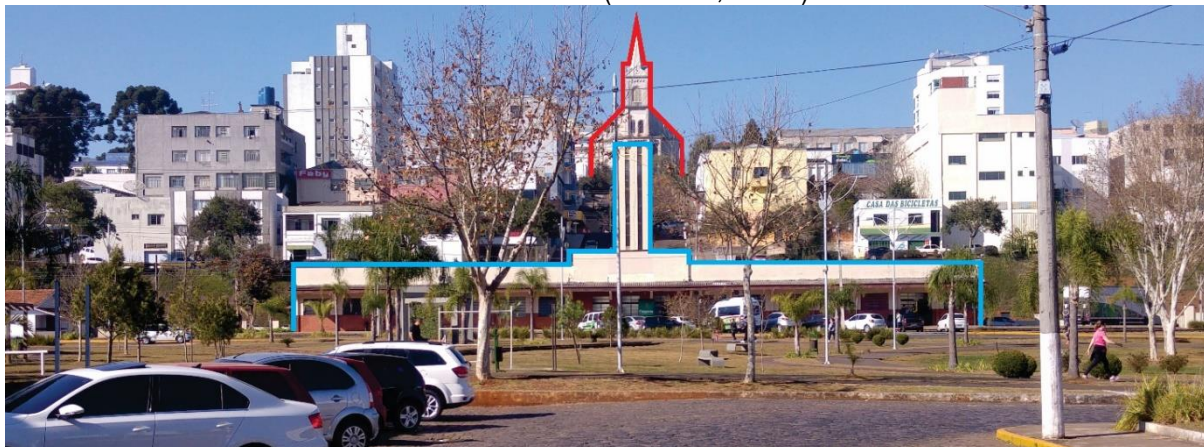
Figura 3: Vista do eixo formado pela Estação Ferroviária de Caçador (embaixo) e a Catedral São Francisco de Assis (na colina, acima).