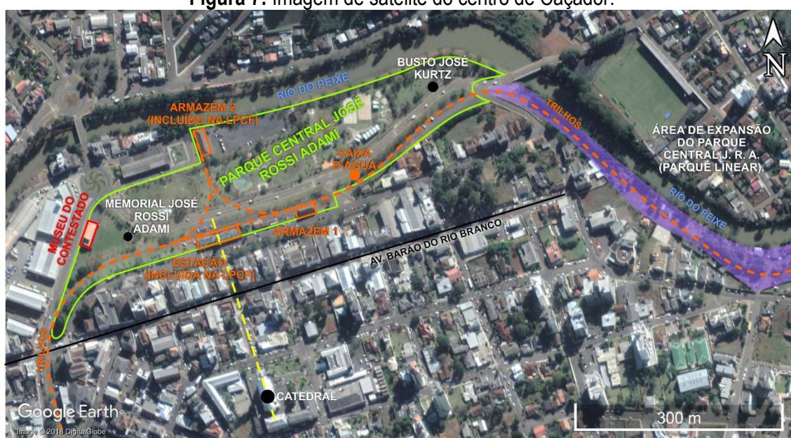
Figura 7: Imagem de satélite do centro de Caçador.

A figura 7 mostra uma imagem de satélite, atual, da área do parque e seu entorno. Nela estão localizados a ferrovia e os elementos do patrimônio ferroviário, entre outros.