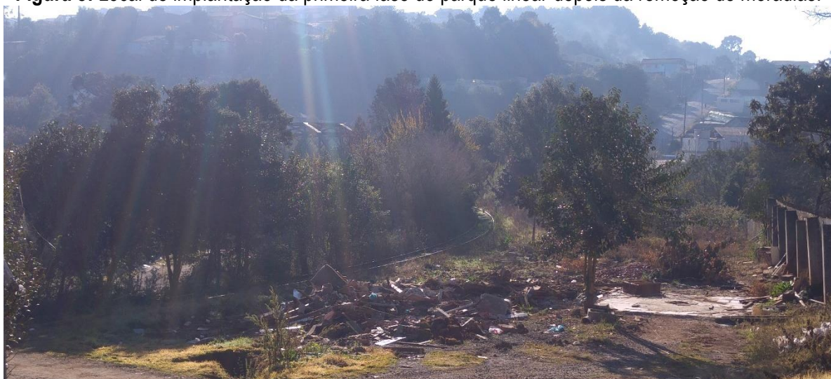
Figura 8: Local de implantação da primeira fase do parque linear depois da remoção de moradias.