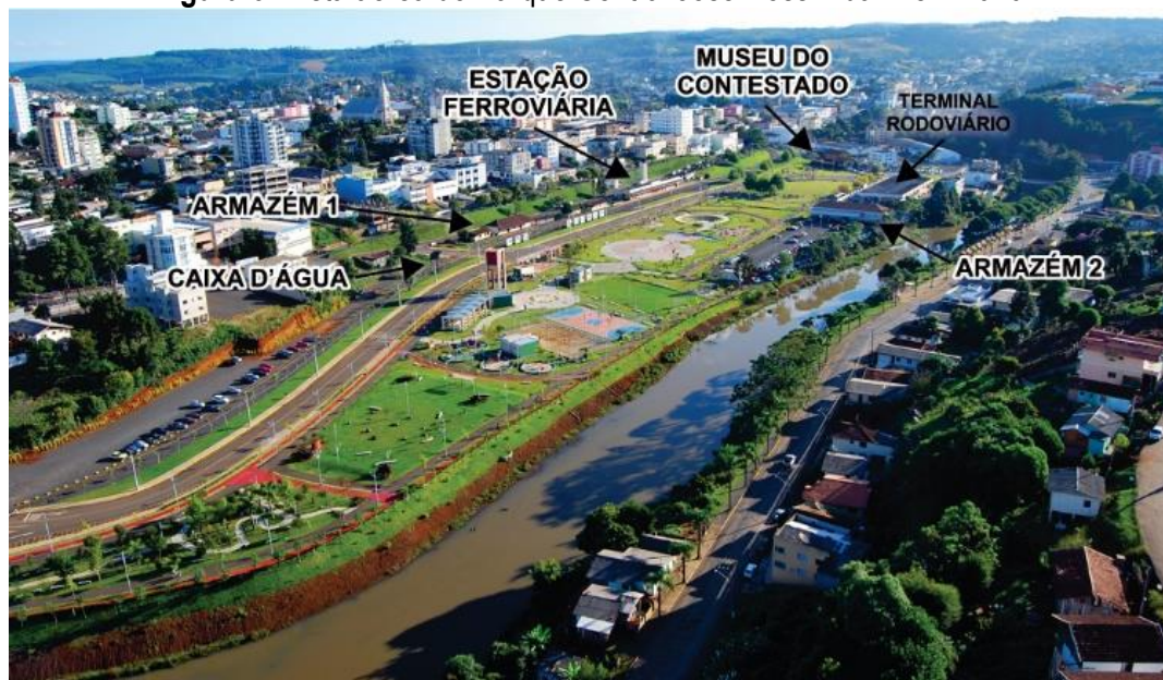
Figura 6: Vista aérea do Parque Central José Rossi Adami em 2010.