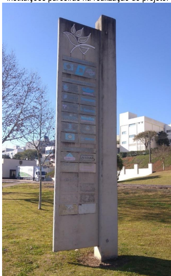
Figura 4: Totem erigido no parque para indicar as empresas e instituições parceiras na realização do projeto.