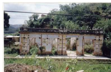
1998-Foto Ralph M. Giesbrecht