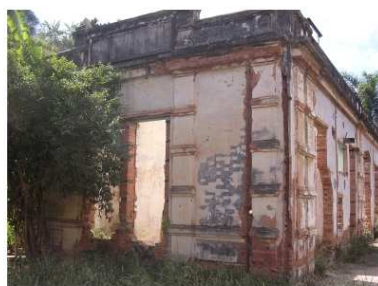
fachada para a via férrea