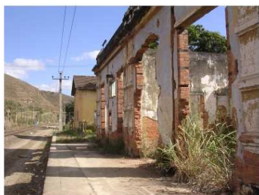
fachada para a via férrea