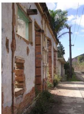
fachada para a via férrea