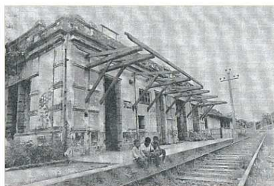
A estação já em ruínas, em 1989.