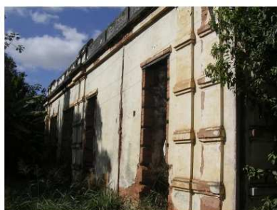
fachada para a rua