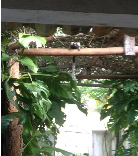
Imagem 1: Entrada da Casa Grande