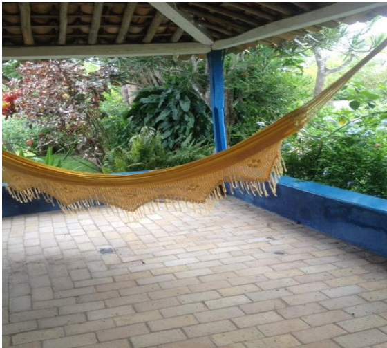
Imagem 5: Lateral da Casa