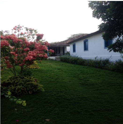
Imagem 3: Lateral da Casa Grande