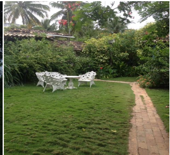
Imagem 4: Jardim em Volta da Casa