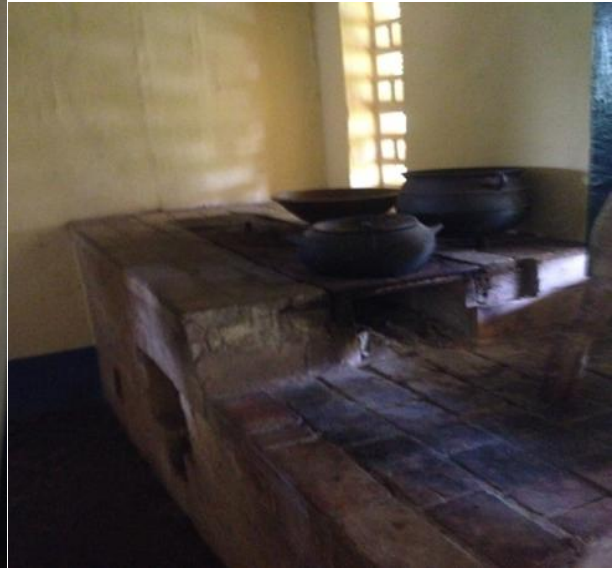
Imagem14: Fogão de lenha.