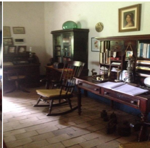
Imagem 8: Sala com Móveis Antigos