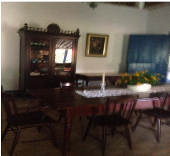
Imagem 7: Sala de Jantar