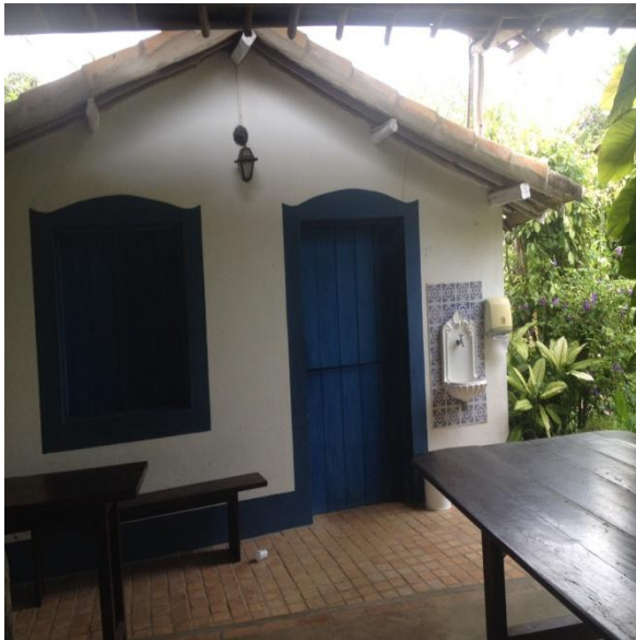
Imagem 15: Cozinha Externa