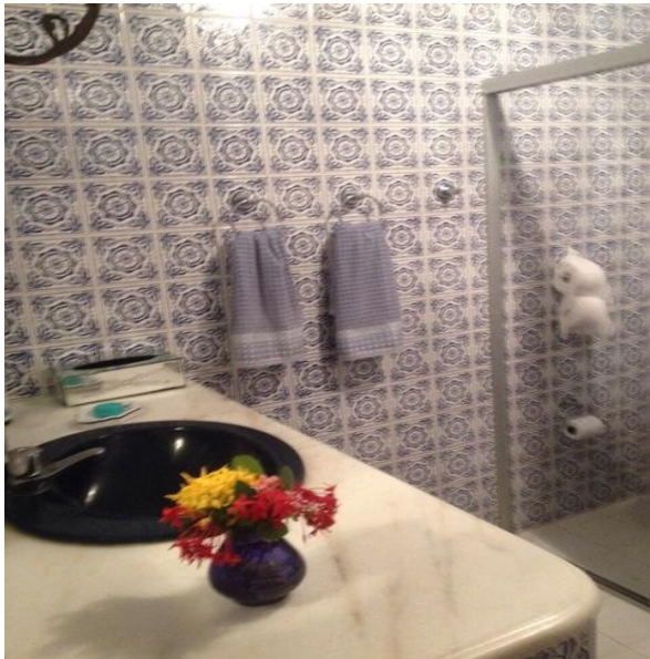
Imagem 9: Banheiro com Azulejos portugueses