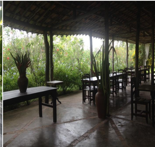
Imagem 16: Área de refeições Externa