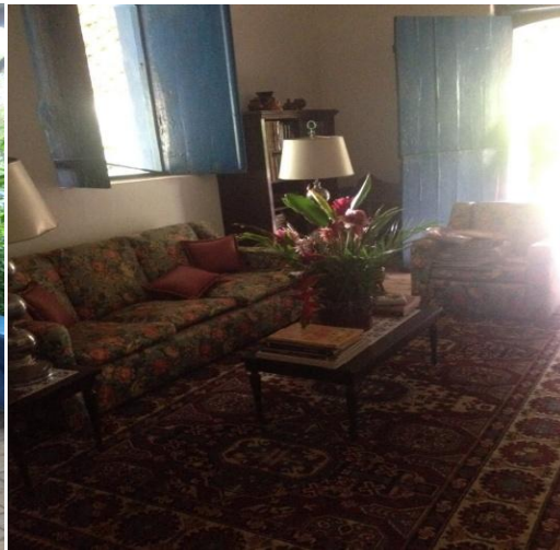
Imagem 6: Uma das salas da casa