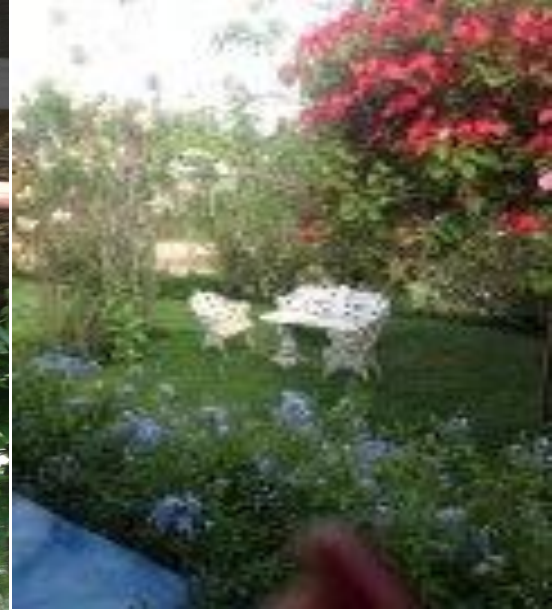
Imagem 2: Jardim da Fazenda