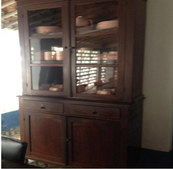
Imagem 13: Armário da Cozinha Interna