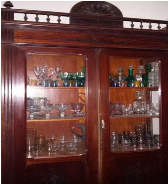
Imagem 11: Cristaleira do século XIX