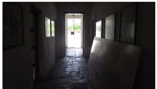
Foto 5- Visão interna do corredor principal 2014