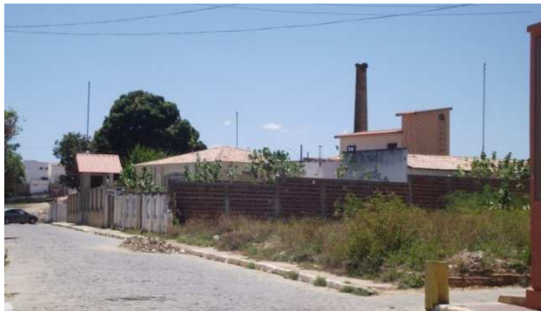
Foto 25- Patrimônio não tombado, resquícios da Brasil Oiticica 2014

Na mesma rua além das residências já citadas encontrava-se também a fábrica da Brasil Oiticica, que como já mencionamos no primeiro capítulo foi de grande importância para o desenvolvimento econômico da região a partir da década de 1930. Essa importante indústria foi durante algum tempo um celeiro de obras e reduto de vários trabalhadores da região. Mas apesar da sua importância histórica, isso não foi o suficiente para que a sua existência fosse de fato assegurada pelos órgãos preservacionistas.