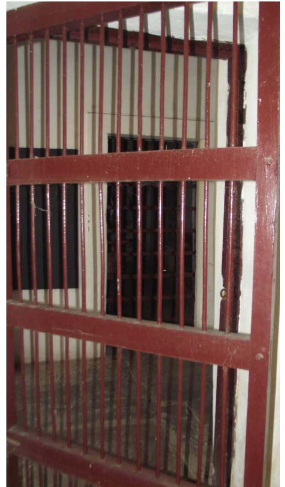
Foto 6- Porta de cela masculina 2014 Foto 7- Porta de cela feminina 2014

Seguindo o mesmo padrão de segurança encontram-se as janelas, que por sua vez, são guarnecidas por grades de ferro maciço. Porém, da mesma forma que ocorre com as grades nas portas das celas, as grades das janelas aumentam ou diminuem a segurança de acordo com função de cada ambiente. Nas janelas das “celas femininas” e também nas janelas frontais, com exceção da janela na primeira cela, localizada ao lado direito da entrada principal e que é fechada por uma porta de madeira maciça, nesses ambientes apenas uma grade de ferro maciço, guarda o local. Já nas “celas masculinas” e nos outros ambientes, existem grades duplas de ferro maciço que reforça ao máximo a segurança desses locais.