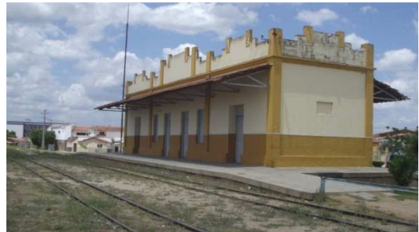
Foto 26- SAOB e Colégio 8 de julho 2014 (Acervo pessoal) Foto 27- Estação Ferroviária 2014 (Acervo pessoal)

Diferente disso, a chaminé da Brasil oitica só se torna um elemento digno de receber os olhares dos órgãos preservacionistas quando a sociedade por meio de manifestação tenta fazer intervenções para impedir a sua derrubada. Este fato culminaria mais tarde no reconhecimento do IPHAEP para com a chaminé, agora como parte importante da história de Pombal e por esse motivo, digna de ser preservada.