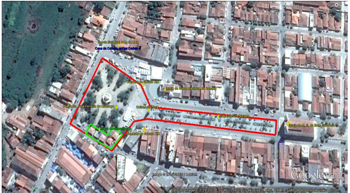
Mapa 5- Praças do centro da cidade de Pombal após nova configuração 2014

Porém, para que isso fosse possível, algumas mudanças foram realizadas pela administração municipal. Com a participação do IPHAEP, fiscalizando e orientando os trabalhos, foram realizadas algumas mudanças que levaram a reformas dos objetos históricos e a nova reconfiguração das praças do centro histórico da cidade.