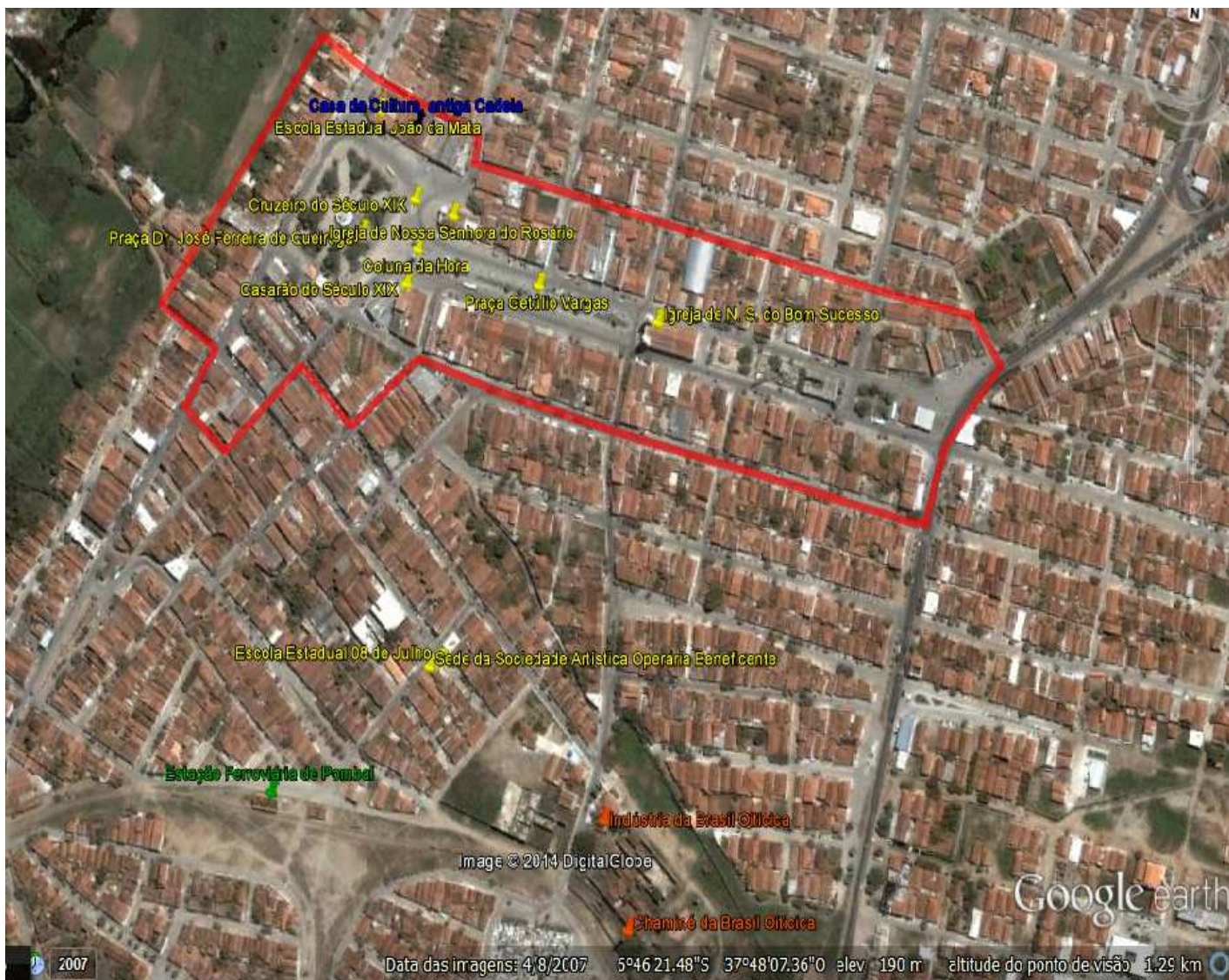
Mapa 3- Delimitação detalhada do centro histórico de Pombal-PB, 2014.