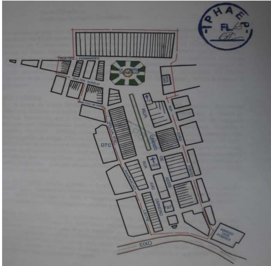
Mapa 2- Delimitação do Centro Histórico de Pombal-PB (IPHAEP, 0030/2001, fl. 63).

Como podemos perceber a proposta para delimitar o centro histórico inicial de Pombal, existente desde a década de 80 acabou influenciando na escolha e na delimitação do centro histórico da cidade. Porém, a inclusão de objetos citados anteriormente e não incluídos naquele momento, mas também importantes para a história pombalense ampliaria em algumas ruas o espaço delimitado. Nesta área não estariam incluídos apenas os prédios do centro histórico inicial, mas, outros elementos de representatividade da sociedade pombalense deixados de fora naquele momento.