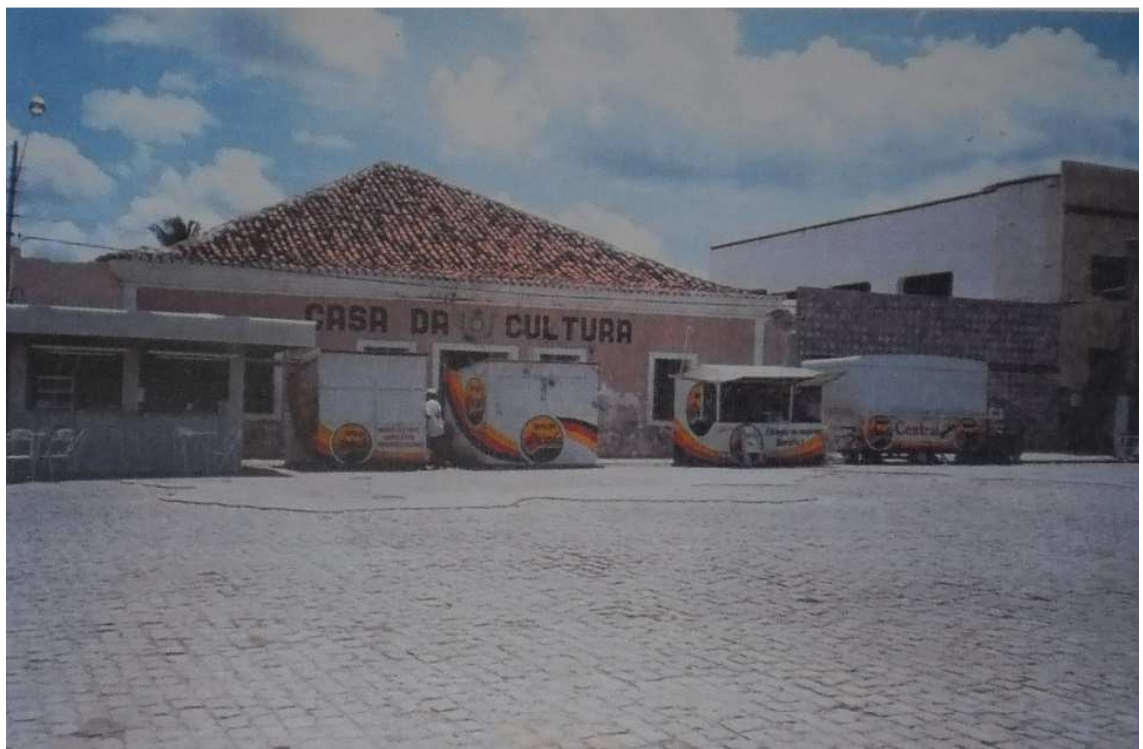
Foto16- Casa da Cultura em 2002 (IPHAEP, 0030, 2002, fl. 19).

Contudo, mesmo escondida dos olhos da maior parte da população que parecem estar alheios a esse tipo de situação, talvez por não entender o valor histórico que cada objeto representa dentro da própria cidade, apesar disso, é da própria população que surge a iniciativa para se buscar soluções que possam manter preservadas as heranças deixadas através do tempo.