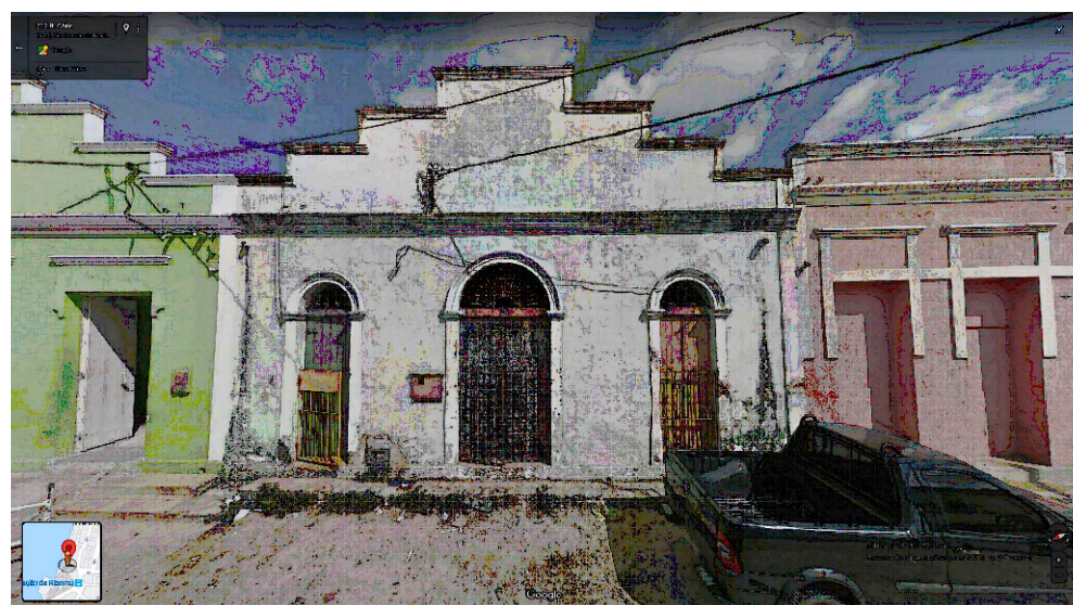
IMAGEM FRONTAL EDIFICAÇÃO RC-241 (JUN. DE 2016)